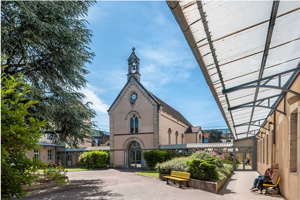
La cour intérieure et la chapelle : vue ouest

39, Lons-le-Saunier, 1 avenue de Montciel