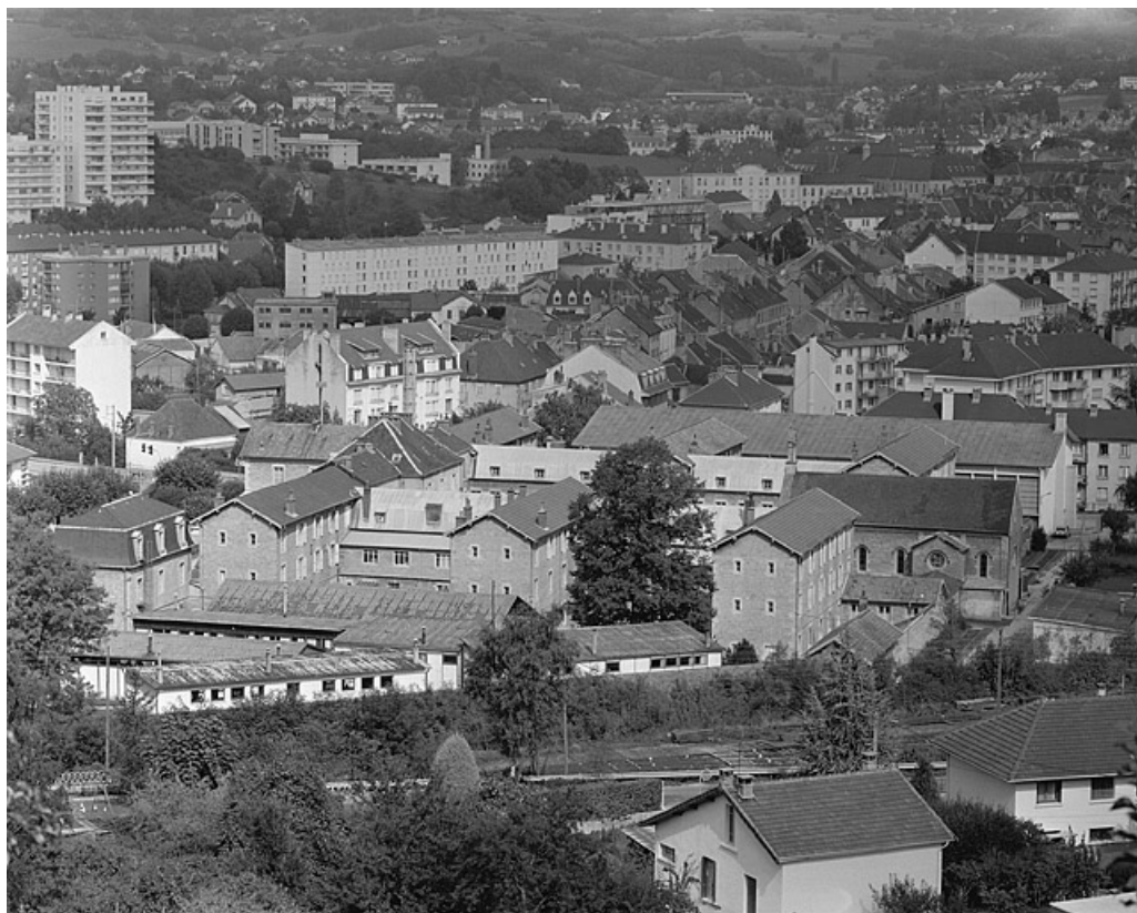
Vue générale depuis le sud.

39, Lons-le-Saunier, 1 avenue de Montciel