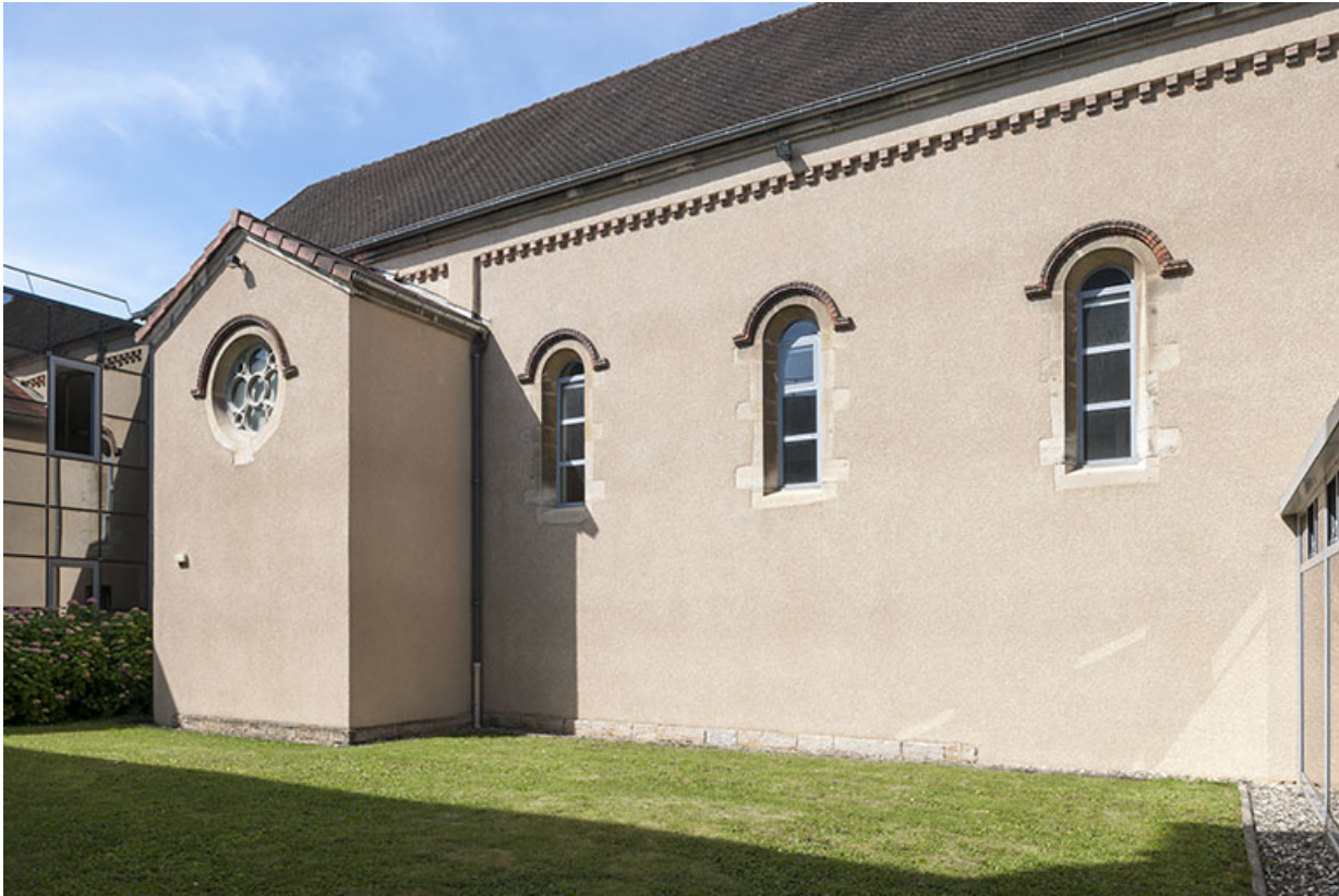
Façade latérale de la chapelle

39, Lons-le-Saunier, 1 avenue de Montciel