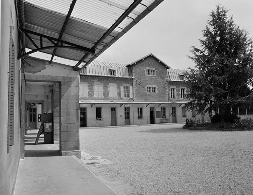
Cour intérieure, vue depuis le pavillon d'entrée.

39, Lons-le-Saunier, 1 avenue de Montciel