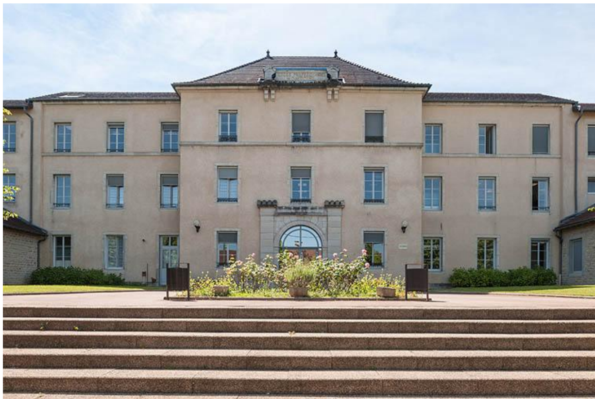
Façade du lycée depuis l'avenue Montciel

39, Lons-le-Saunier, 1 avenue de Montciel