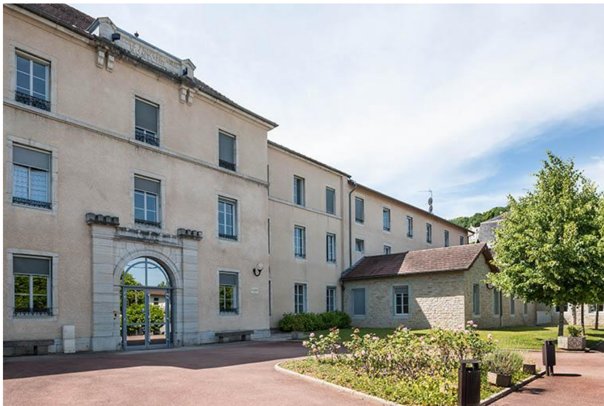
Façade antérieure du pavillon d'entrée 39, Lons-le-Saunier, 1 avenue de Montciel