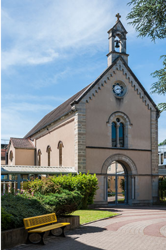
Chapelle : vue extérieure

39, Lons-le-Saunier, 1 avenue de Montciel