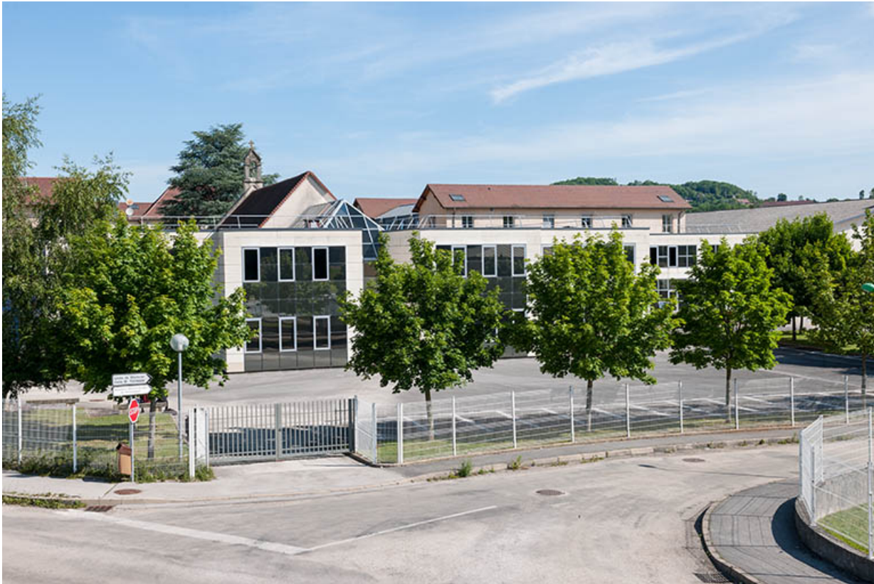
Extension Sud : bâtiments, passage et chevet de la chapelle, parking.

39, Lons-le-Saunier, 1 avenue de Montciel