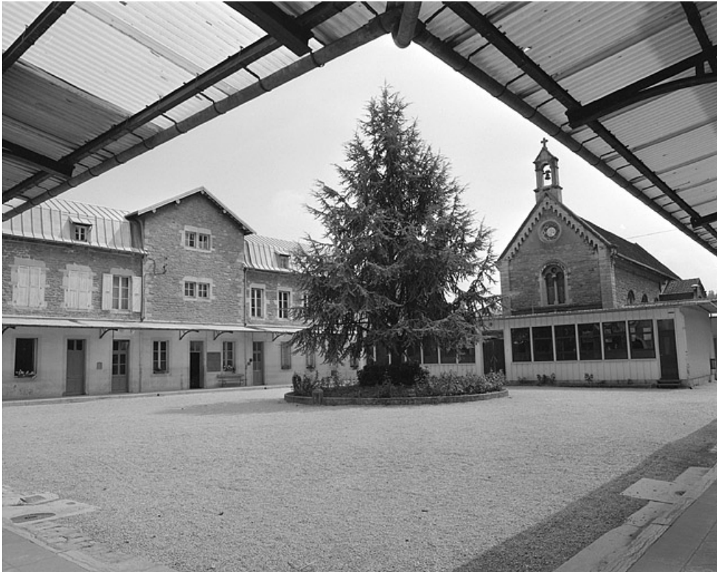
Cour intérieure et chapelle.

39, Lons-le-Saunier, 1 avenue de Montciel