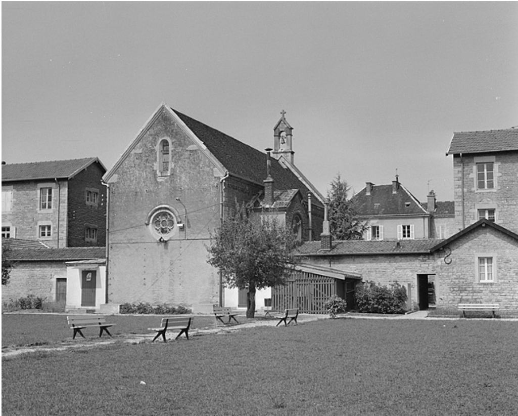
Chapelle, façade postérieure.

39, Lons-le-Saunier, 1 avenue de Montciel