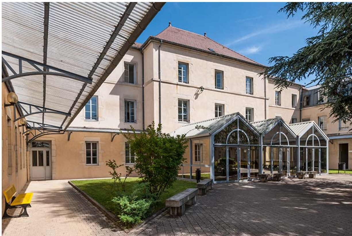
Façade postérieure du pavillon d'entrée 39, Lons-le-Saunier, 1 avenue de Montciel