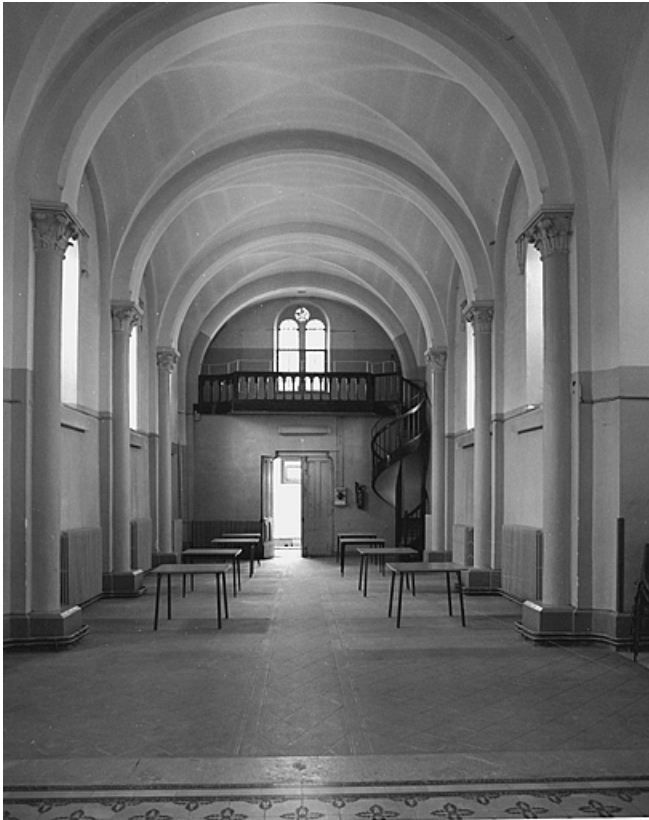
Chapelle, vue intérieure.

39, Lons-le-Saunier, 1 avenue de Montciel