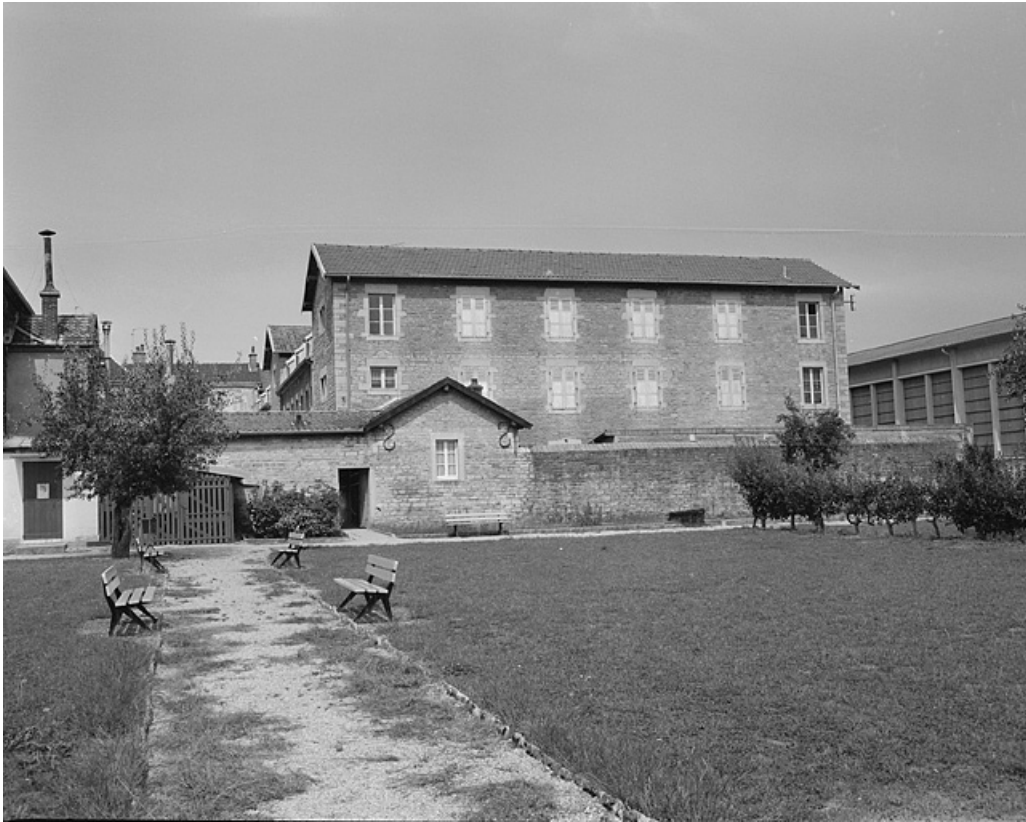
Façade latérale d'un des pavillons.

39, Lons-le-Saunier, 1 avenue de Montciel