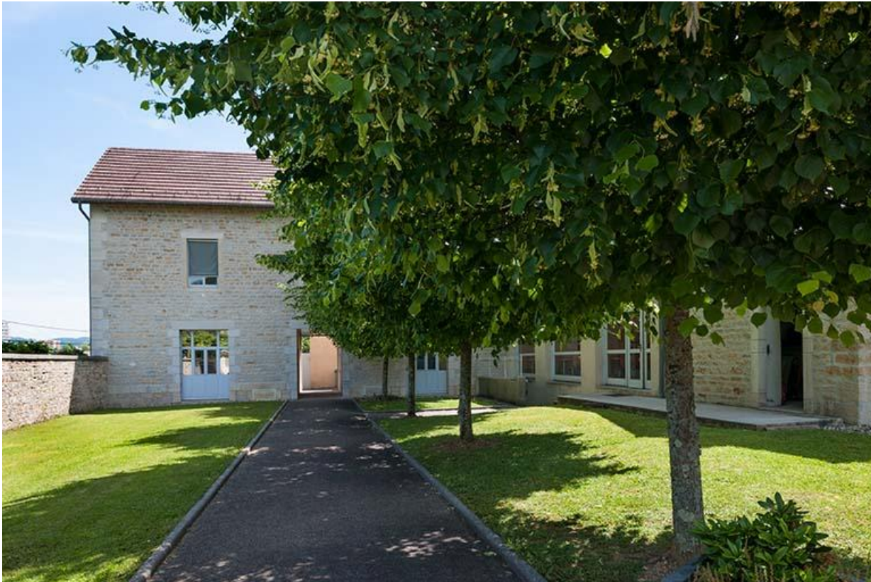
Façade antérieure de l'aile gauche occupée par l'atelier des agents

39, Lons-le-Saunier, 1 avenue de Montciel