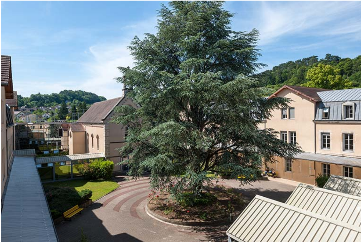
Vue de la cour intérieure

39, Lons-le-Saunier, 1 avenue de Montciel