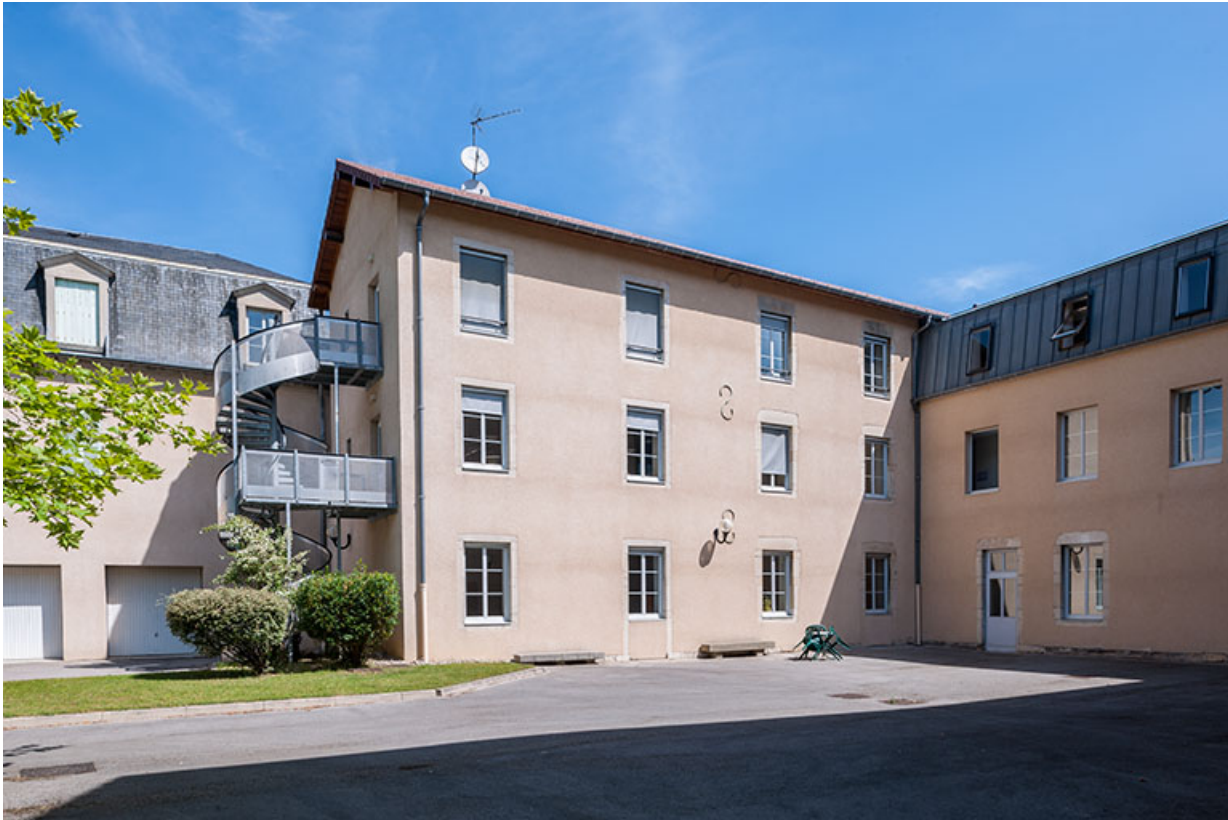
Façades postérieures des bâtiments administration.

39, Lons-le-Saunier, 1 avenue de Montciel