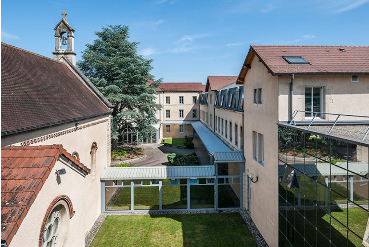
Façades Est sur cour : externat, chapelle.

39, Lons-le-Saunier, 1 avenue de Montciel