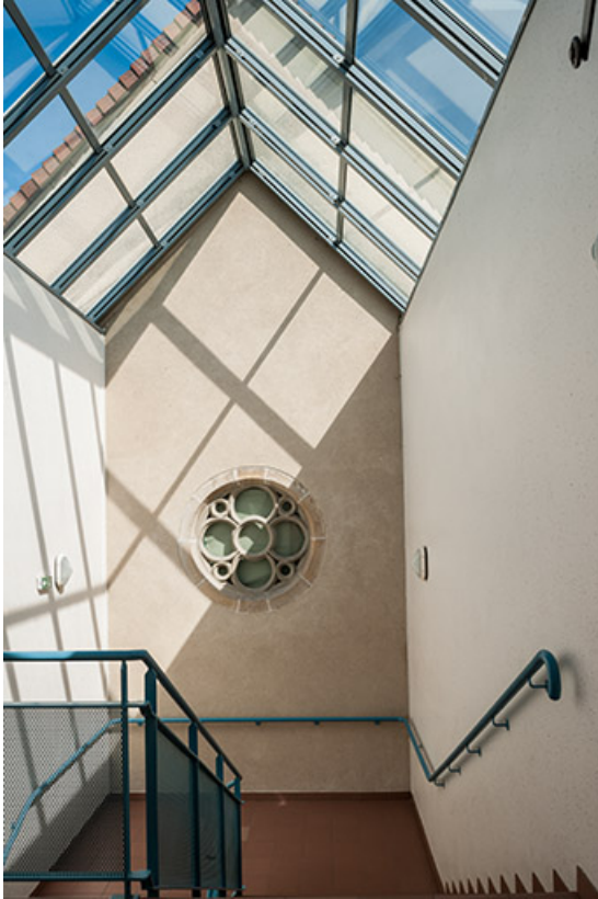
Chapelle : chevet, jonction avec l'extension sud

39, Lons-le-Saunier, 1 avenue de Montciel