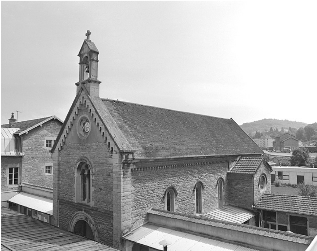
Chapelle, vue des parties hautes.

39, Lons-le-Saunier, 1 avenue de Montciel