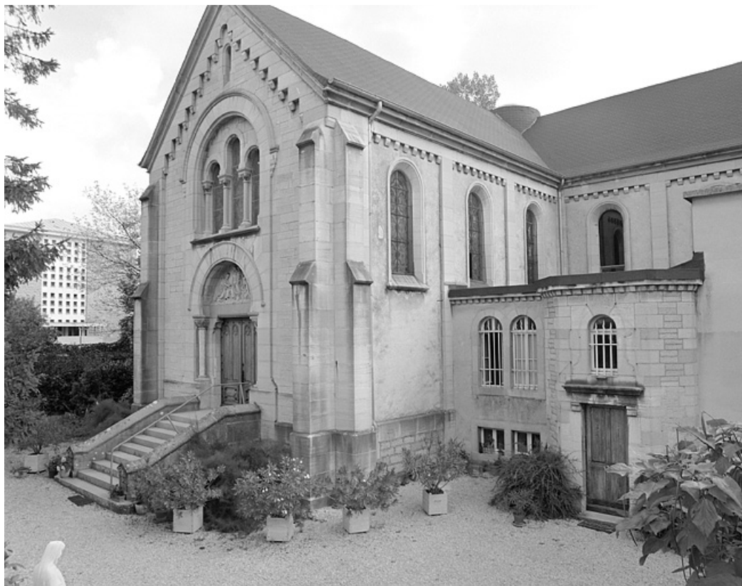
Eglise : vue générale.

39, Lons-le-Saunier, 230 rue du Docteur Jean Michel