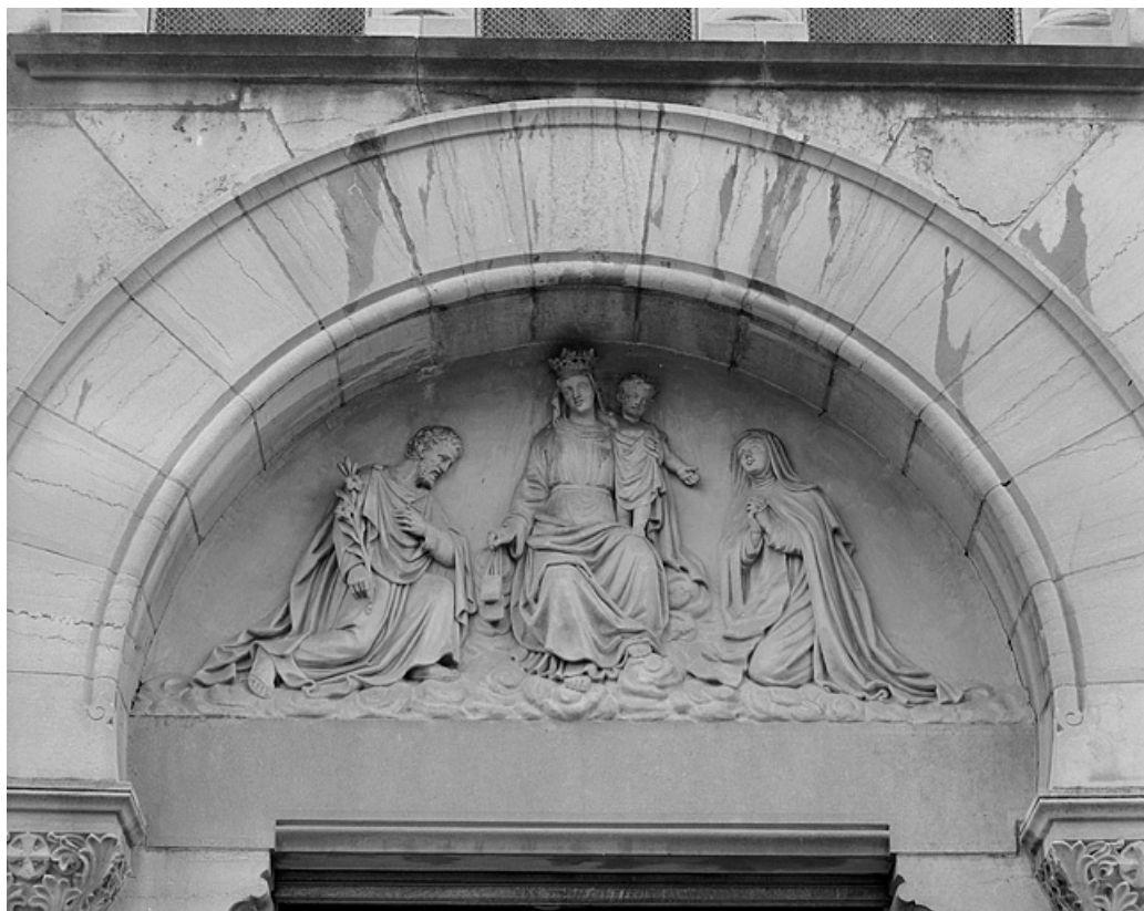
Eglise : tympan du portail de la façade principale.

39, Lons-le-Saunier, 230 rue du Docteur Jean Michel