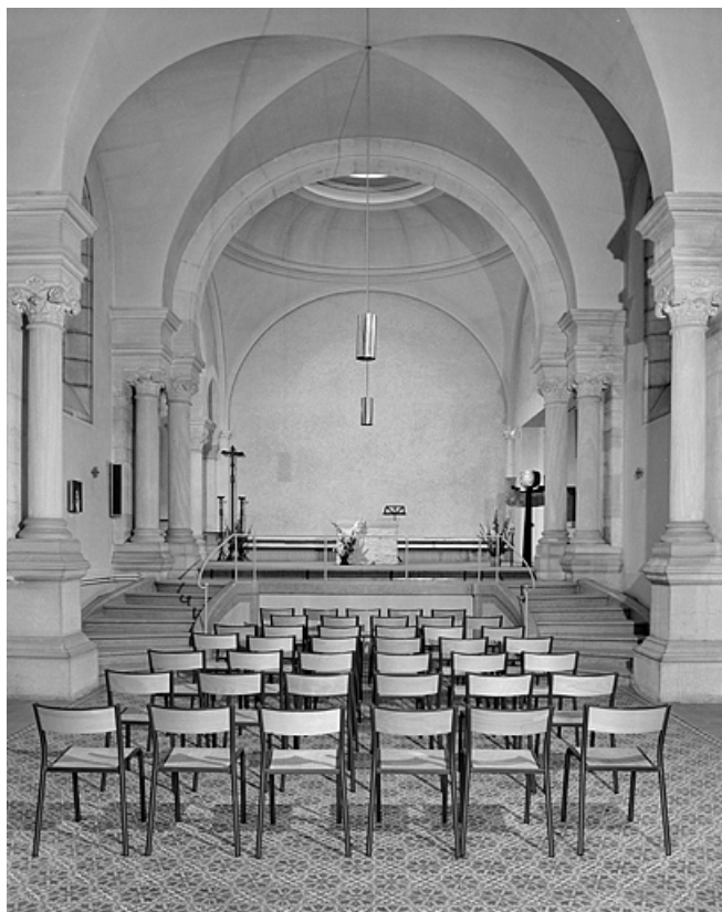
Eglise : vue de la nef.

39, Lons-le-Saunier, 230 rue du Docteur Jean Michel