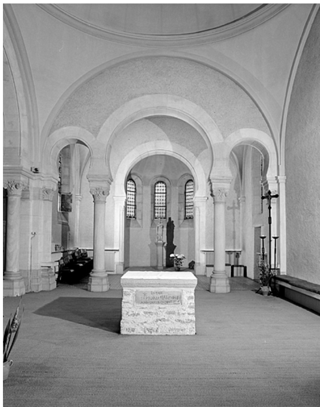
Eglise : vue de la chapelle nord depuis le chœur. 39, Lons-le-Saunier, 230 rue du Docteur Jean Michel