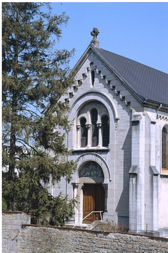
Façade antérieure de la chapelle.