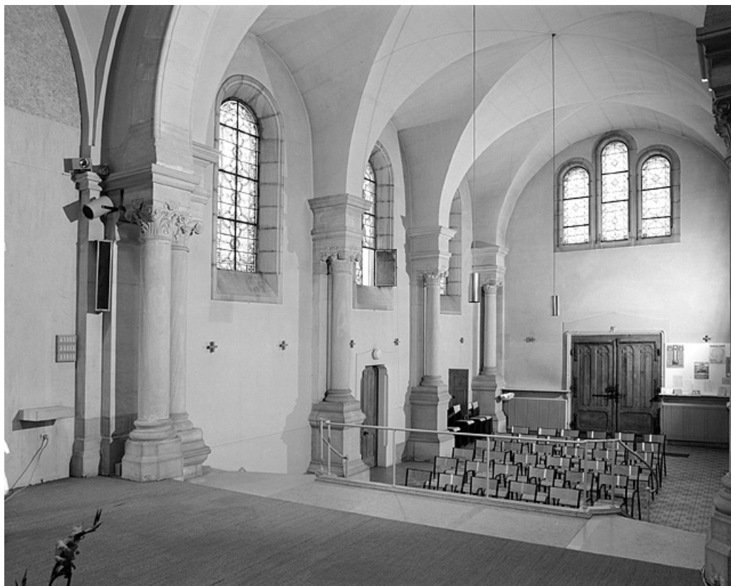
Eglise : élévation intérieure et voûtement de la nef.

39, Lons-le-Saunier, 230 rue du Docteur Jean Michel