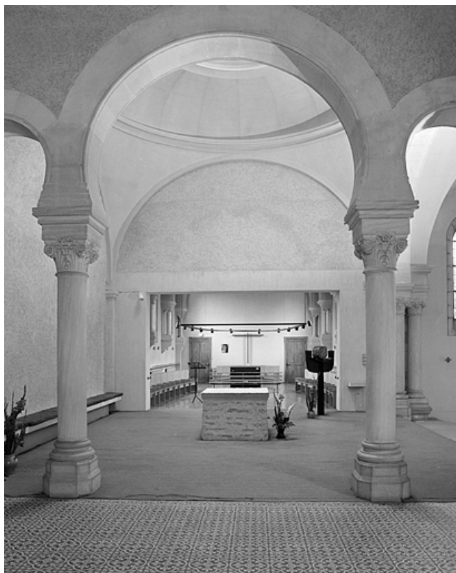
Eglise : vue du choeur depuis la chapelle nord.

39, Lons-le-Saunier, 230 rue du Docteur Jean Michel