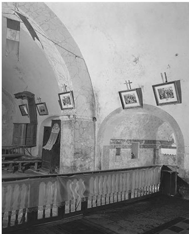
Intérieur : nef, élévation gauche vue depuis le chœur. 39, Briod