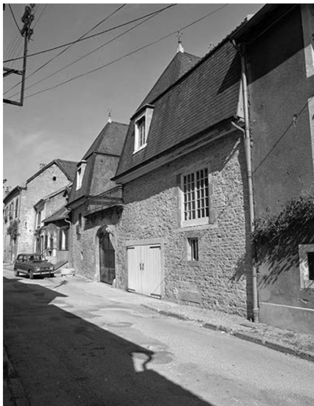
Vue générale depuis la rue. 25, Vuillafans