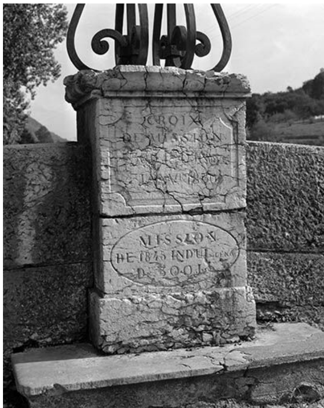
Détail du socle avec l'inscription et la date.