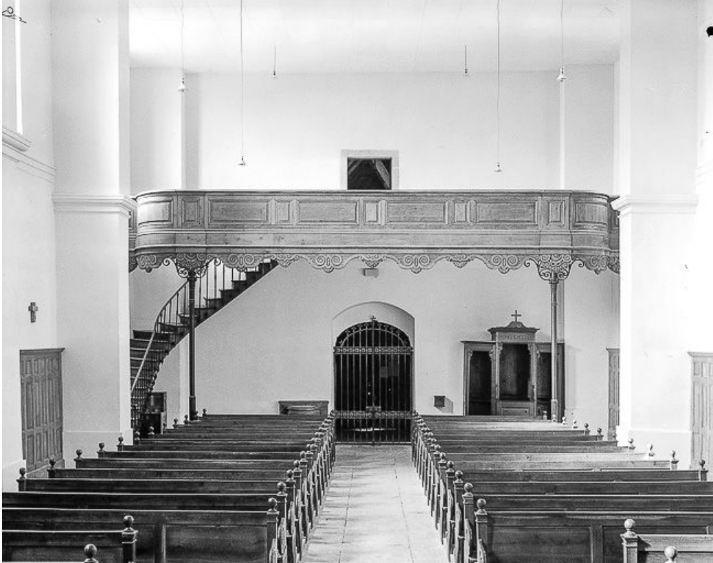
La nef vue depuis le chœur.