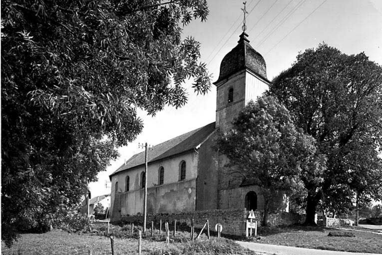
Face latérale gauche.