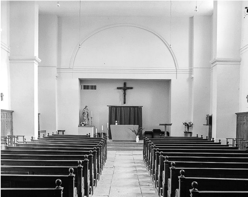
Intérieur : la nef et le chœur vus depuis l'entrée.