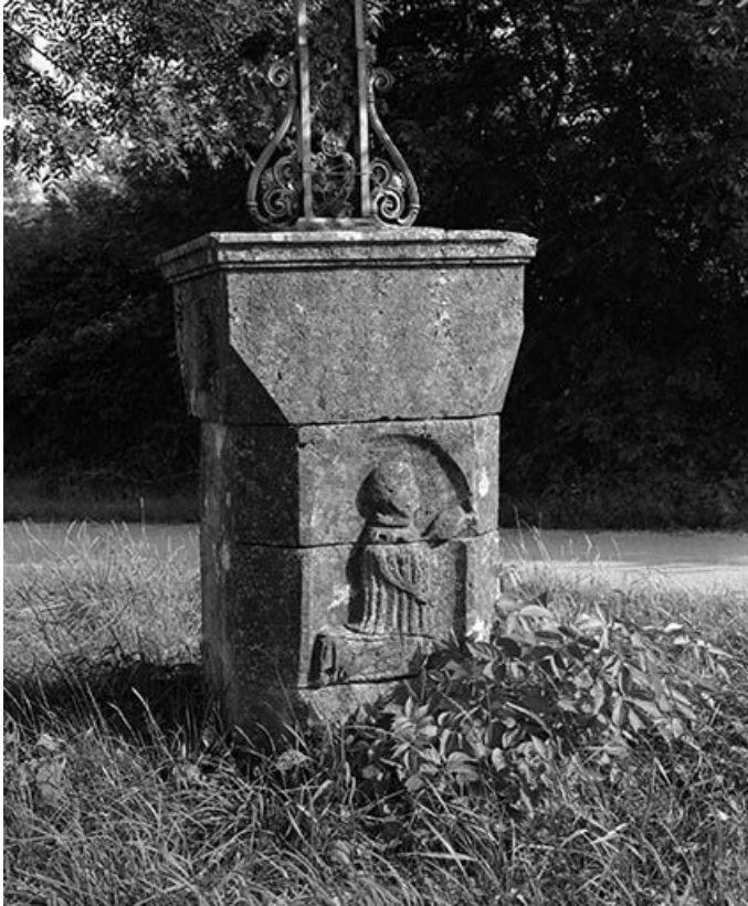
Détail du soubassement : relief semi-méplat représentant un personnage en prière. 25, Saules chemin de Ceinture