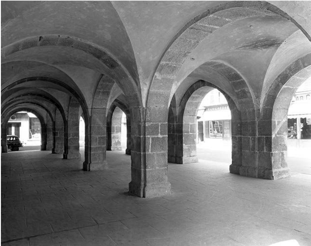
Les anciennes halles, vue de trois quarts.