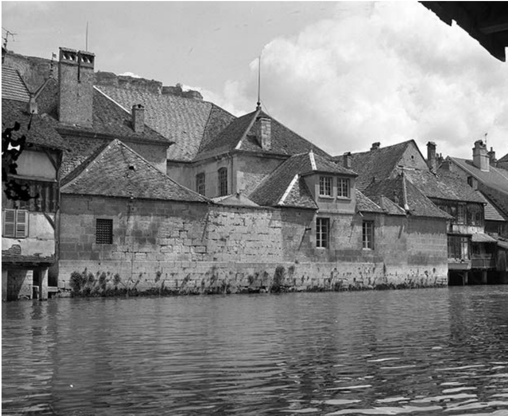
Façade postérieure, vue de trois quarts gauche.