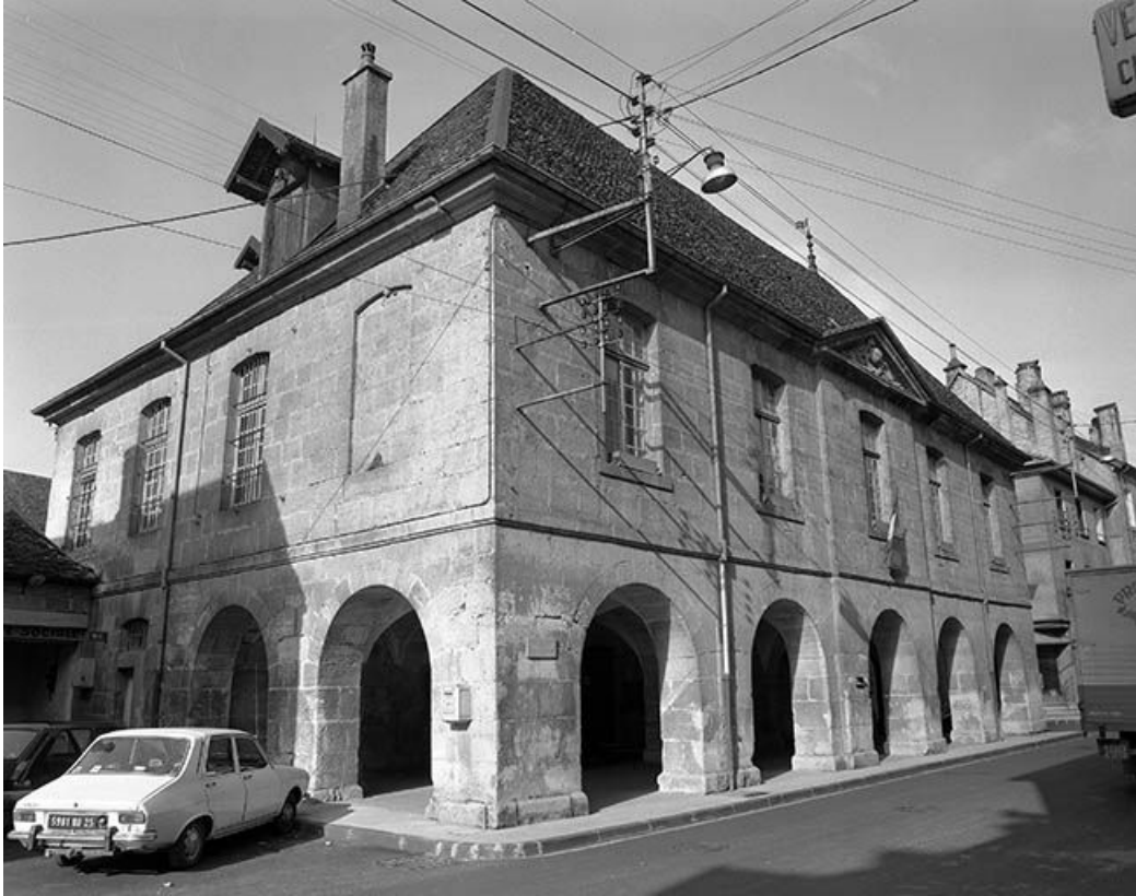
Façade antérieure et face latérale gauche.