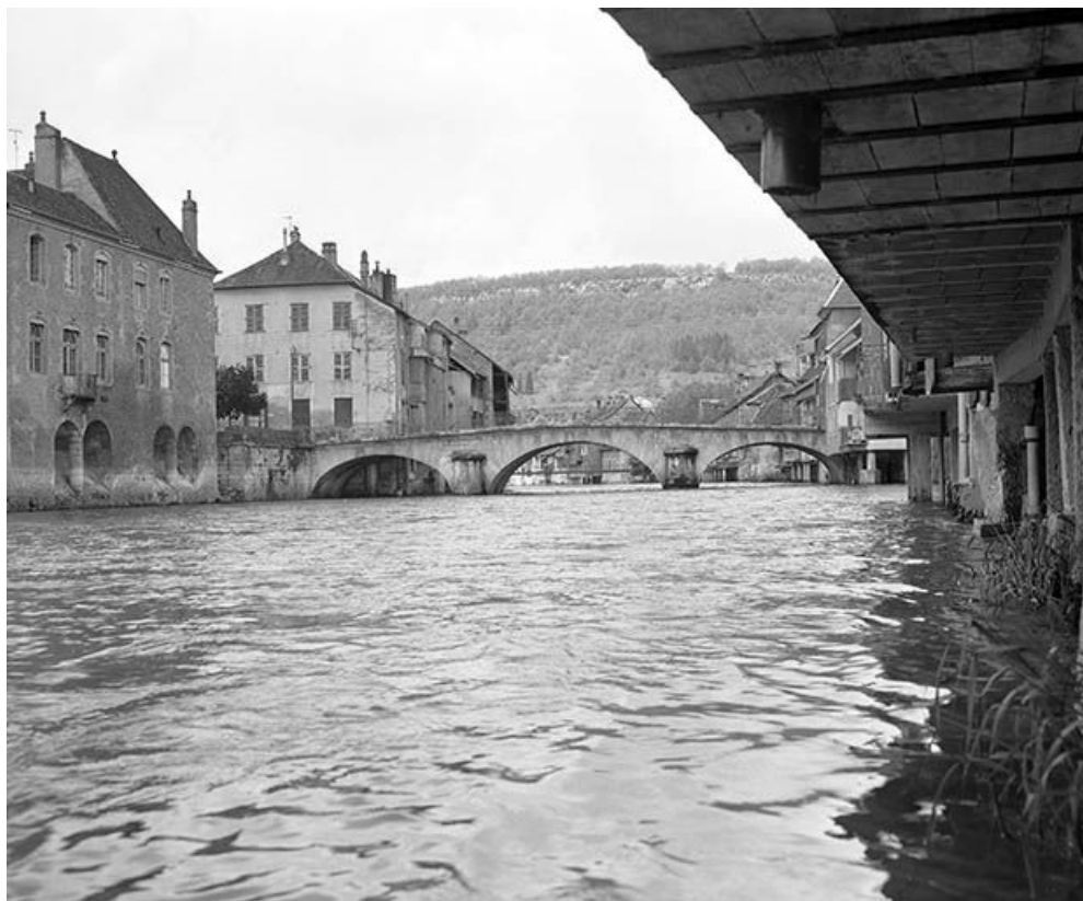
Vue générale depuis la rive droite. 25, Ornans