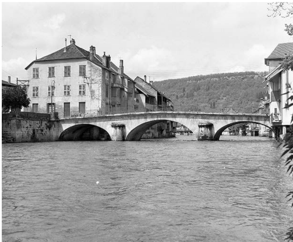
Vue de trois quarts depuis la rive droite.