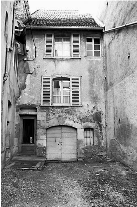
Façade antérieure sur cour.