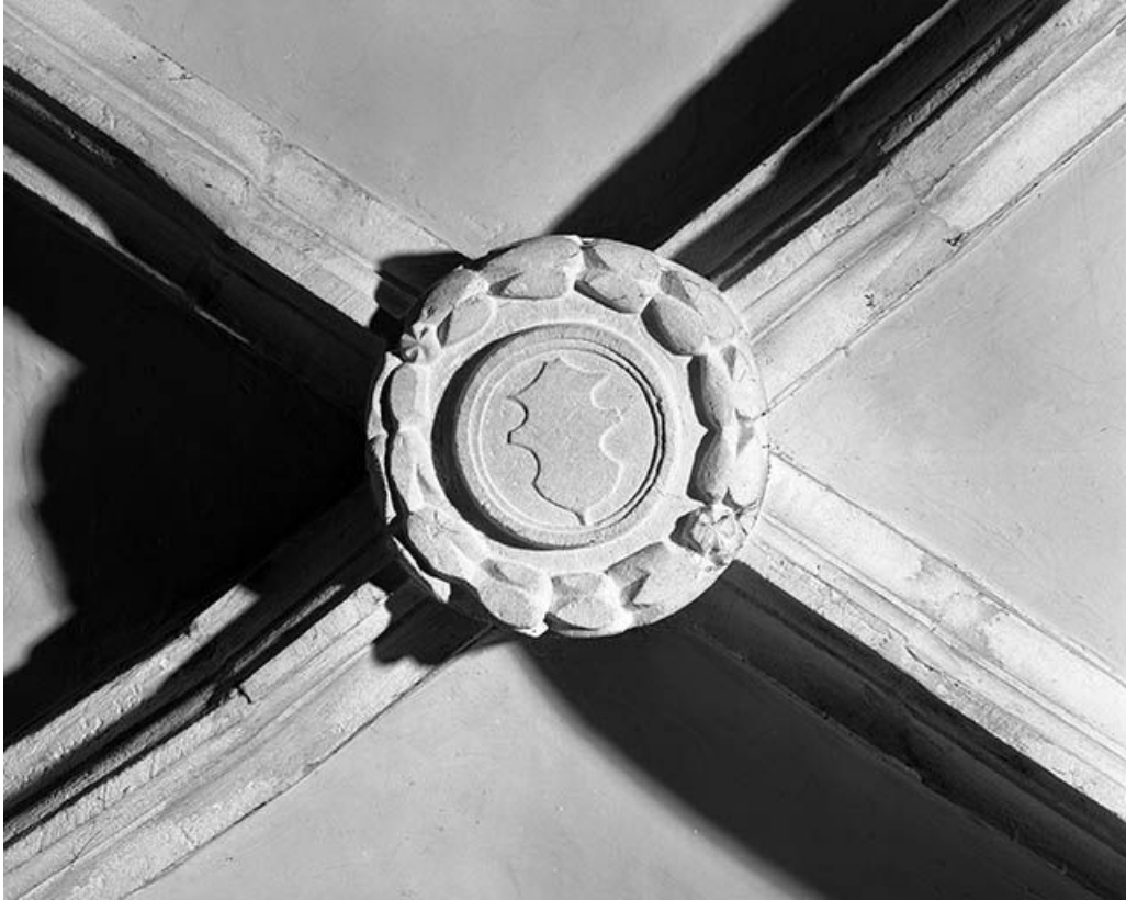
Intérieur : 5ème travée du collatéral droit, clef annulaire de la chapelle des tanneurs. 25, Mouthier-Haute-Pierre place Césaire Phisalix