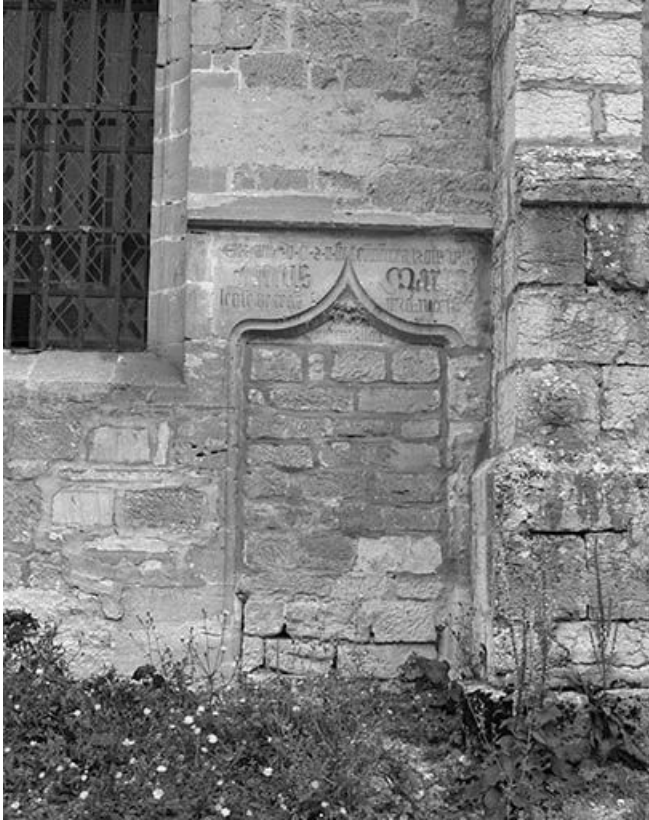
Détail de la face latérale droite : ancienne porte.

25, Mouthier-Haute-Pierre place Césaire Phisalix