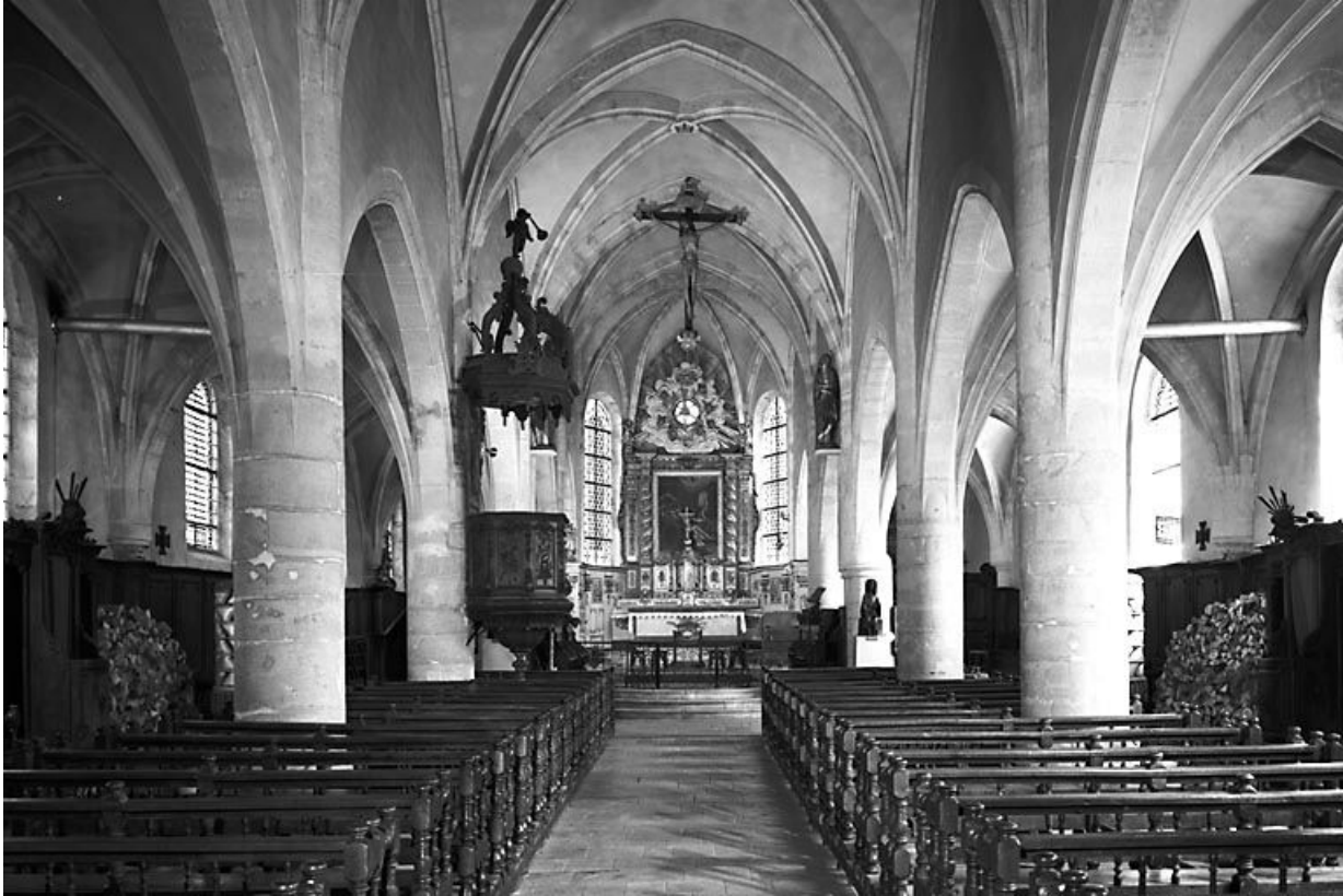
Intérieur : la nef et le choeur vus depuis l'entrée.

25, Mouthier-Haute-Pierre place Césaire Phisalix