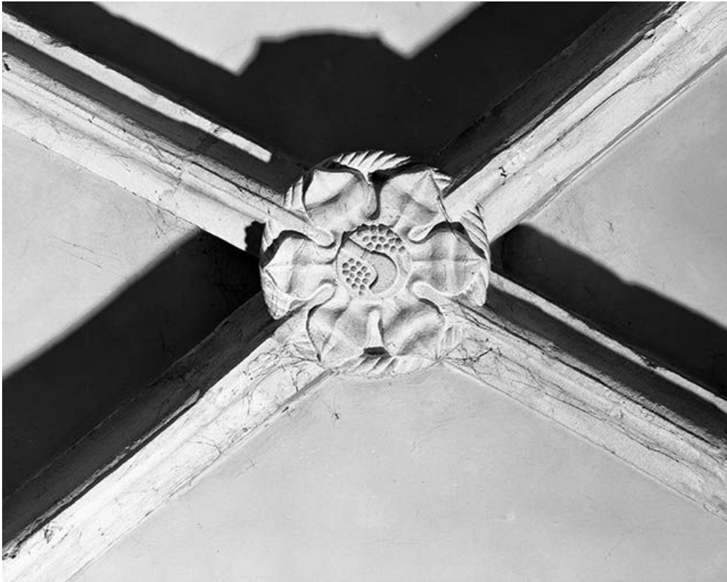
Intérieur : 4ème travée du collatéral droit, clef annulaire de la chapelle des vigneron. 25, Mouthier-Haute-Pierre place Césaire Phisalix