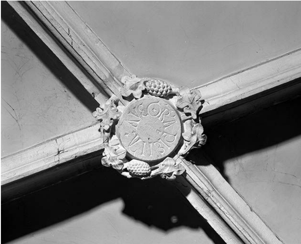
Intérieur : 1ère travée du collatéral droit, clef annulaire de la chapelle de la Vierge. 25, Mouthier-Haute-Pierre place Césaire Phisalix