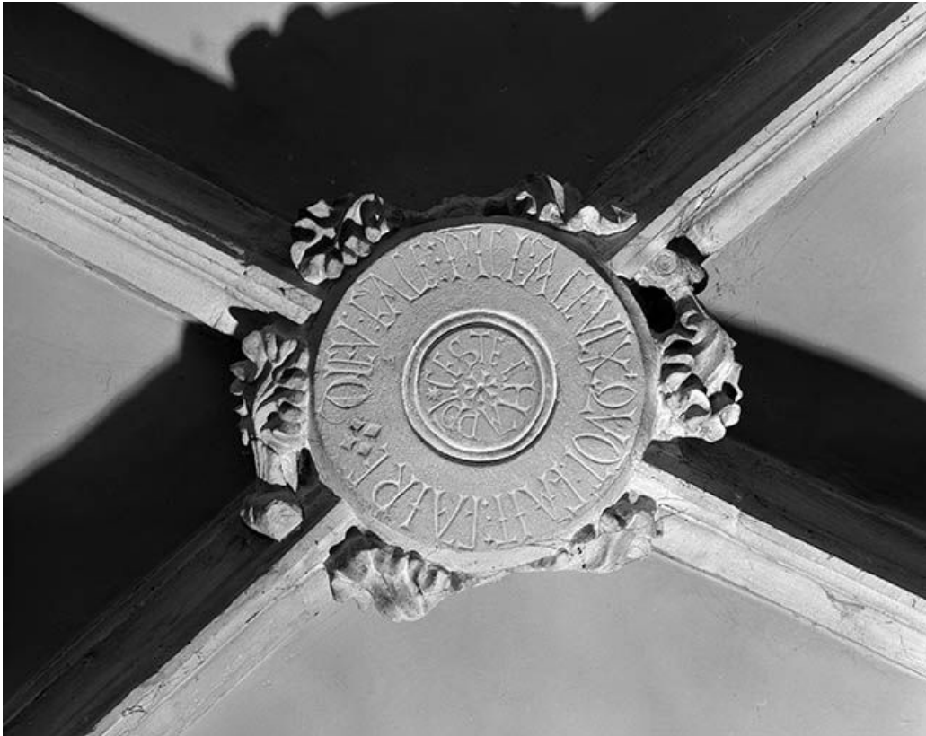
Intérieur : 2ème travée du collatéral droit, clef annulaire ornée de feuilles. 25, Mouthier-Haute-Pierre place Césaire Phisalix