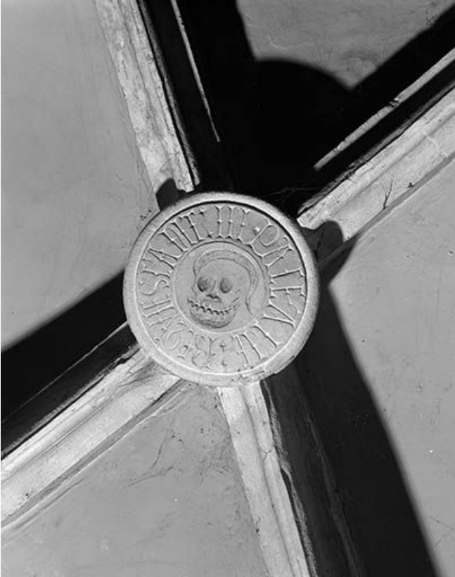
Intérieur : 1ère travée du collatéral gauche, clef annulaire de la chapelle consacrée aux défunts. 25, Mouthier-Haute-Pierre place Césaire Phisalix