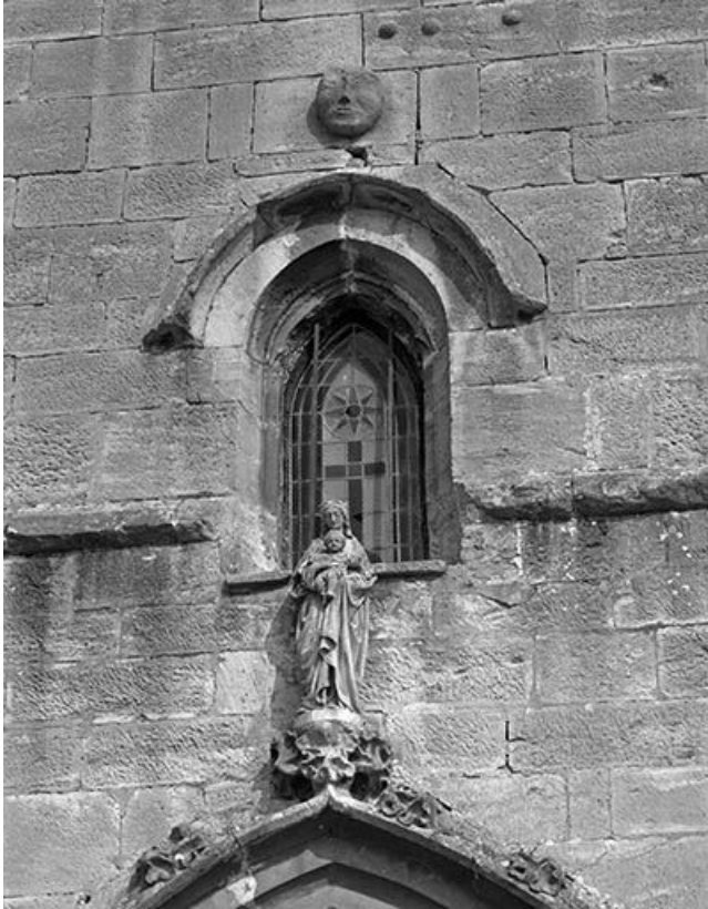
Portail : détail, statue Vierge à l'Enfant.

25, Mouthier-Haute-Pierre place Césaire Phisalix