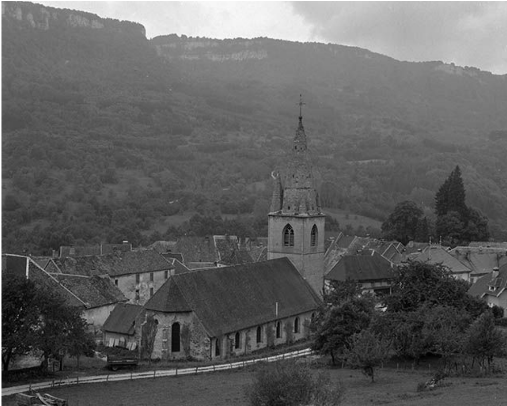
Vue générale du site depuis le sud-est.

25, Mouthier-Haute-Pierre place Césaire Phisalix