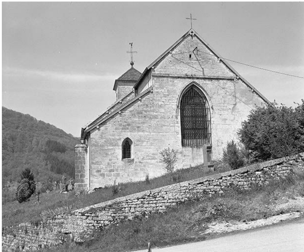
Le chevet vu de trois quarts gauche.