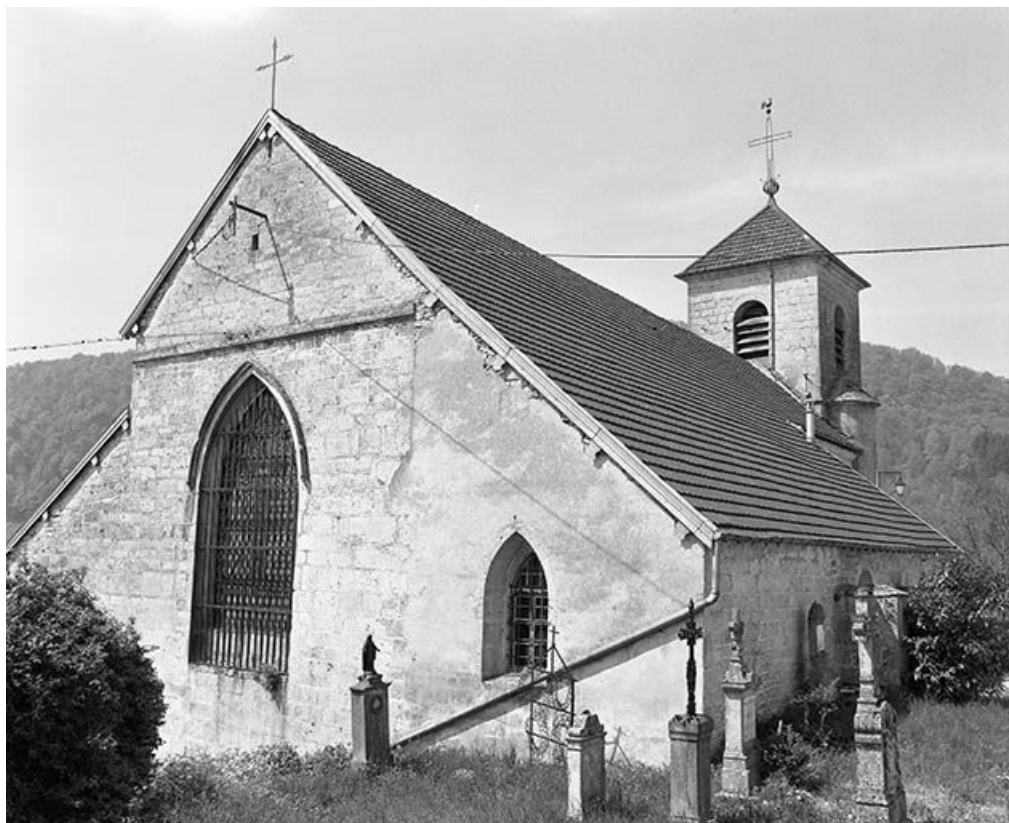
Le chevet vu de trois quarts droit.