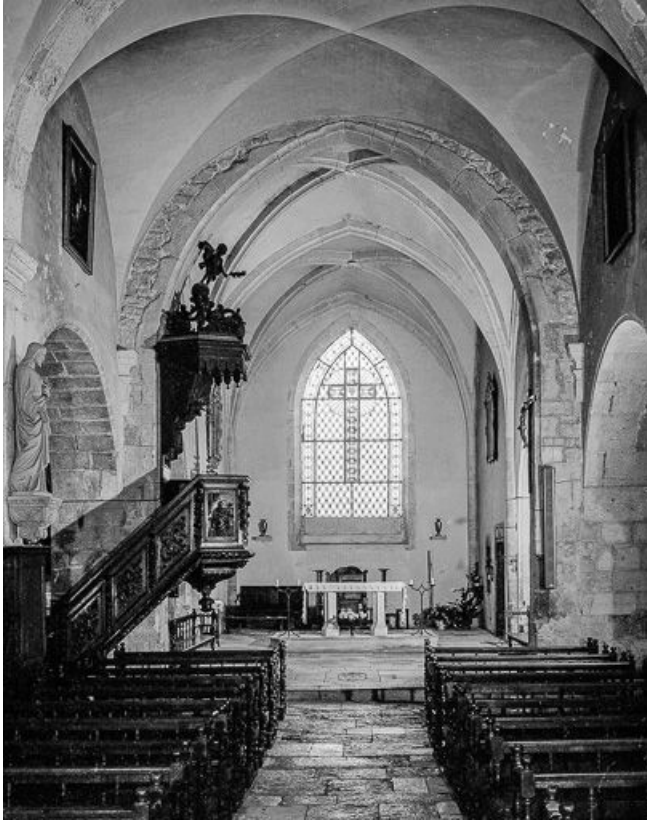
Intérieur : le chœur.