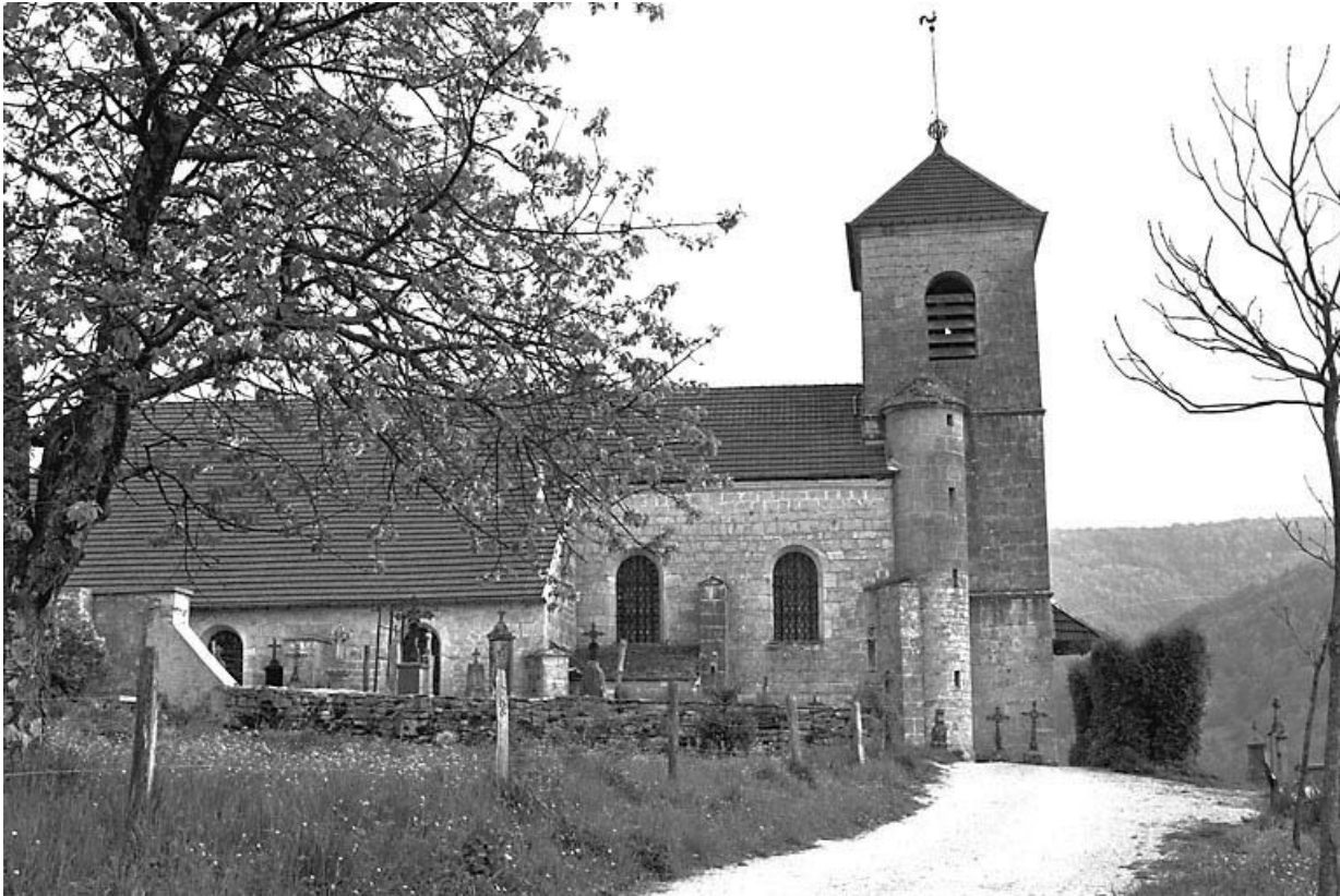
Face latérale gauche.