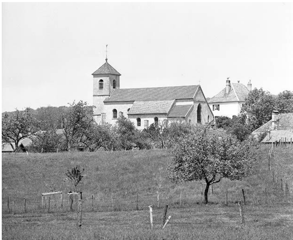
Face latérale droite et chevet.