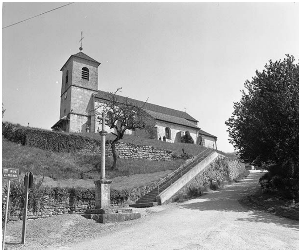
Façade antérieure et face latérale droite.