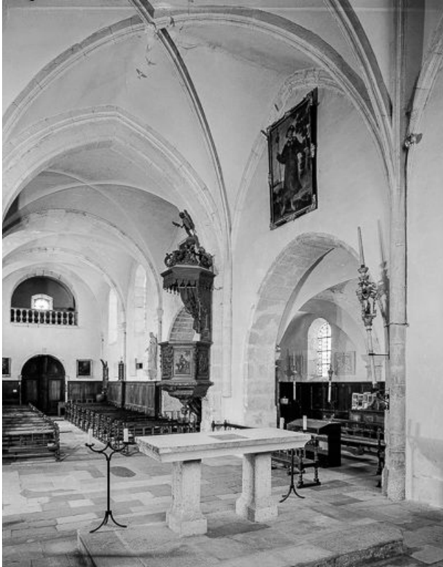
Intérieur : la nef et le transept gauche vus depuis le chœur. 25, Montgesoye