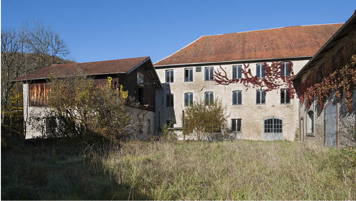
Façade sud de l'atelier.