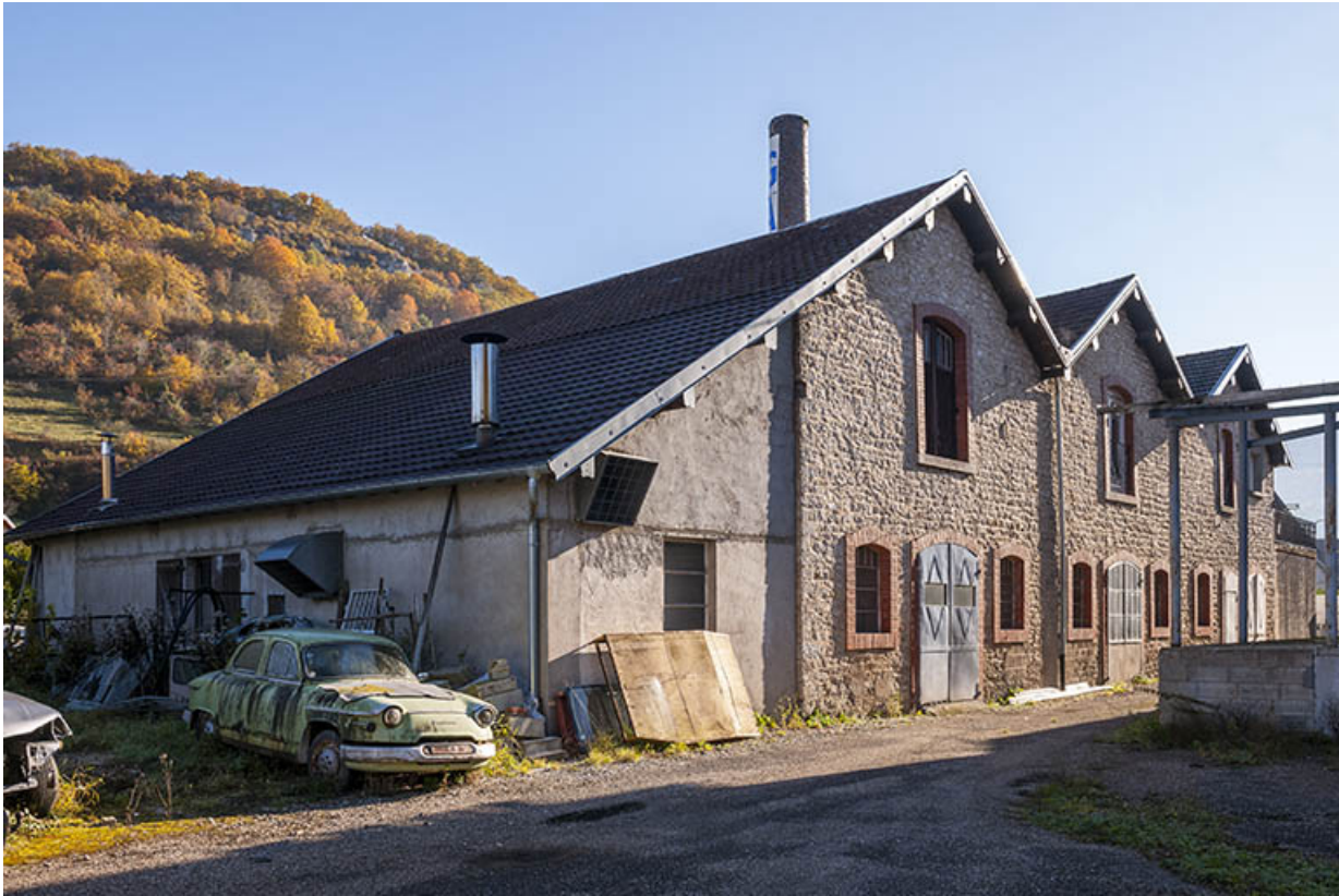
Vue de trois quarts arrière de la salle des machines.