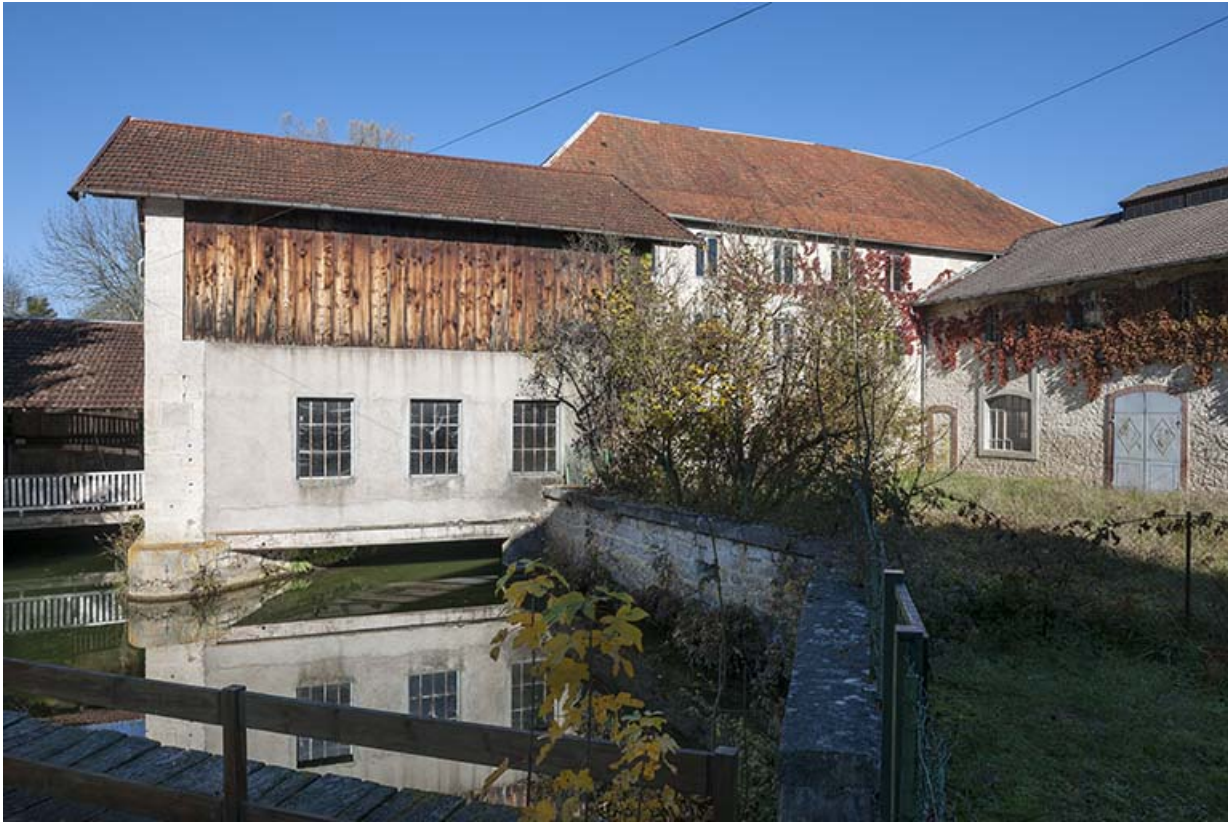
Bâtiment d'eau et atelier de fabrication.