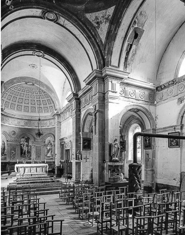
Intérieur : nef et chœur vus de trois quarts droit.

25, Mérey-sous-Montrond place de l' Eglise