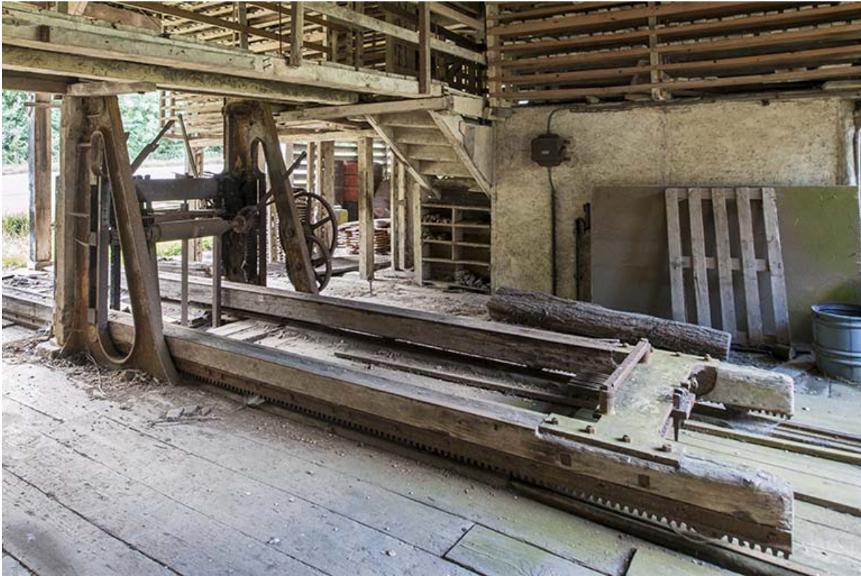
Châssis de scie et son chariot à grumes.

25, Malbrans route départementale 67, lieudit : les Combes de Punay