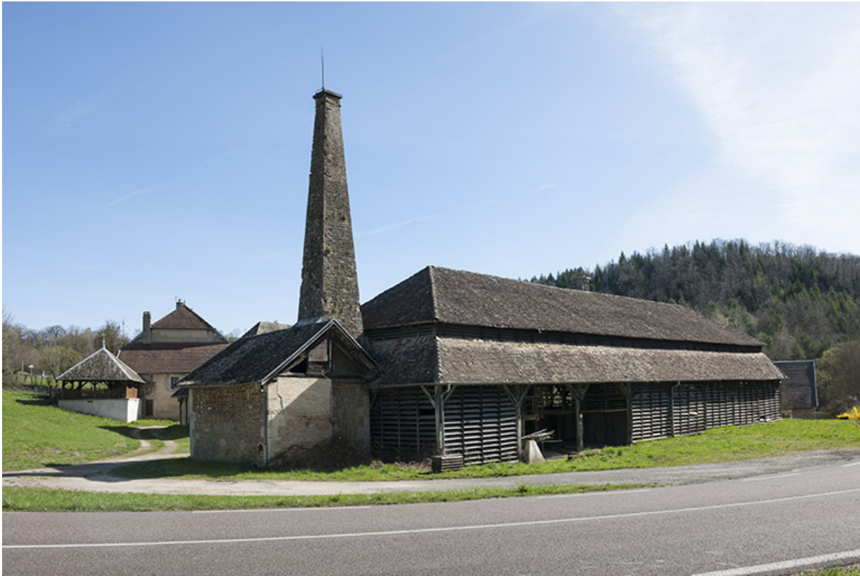
Vue d'ensemble depuis le sud-ouest.

25, Malbrans route départementale 67, lieudit : les Combes de Punay