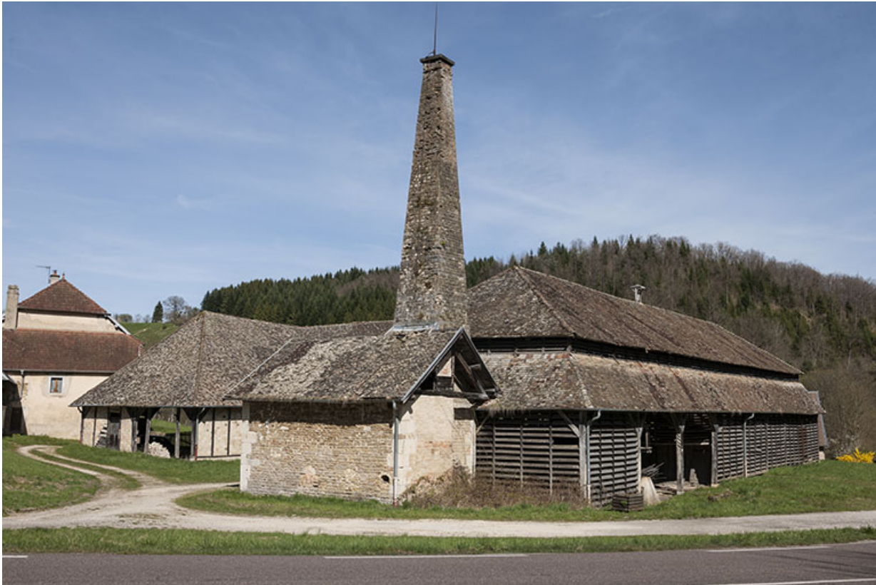
Vue rapprochée depuis le sud-ouest.