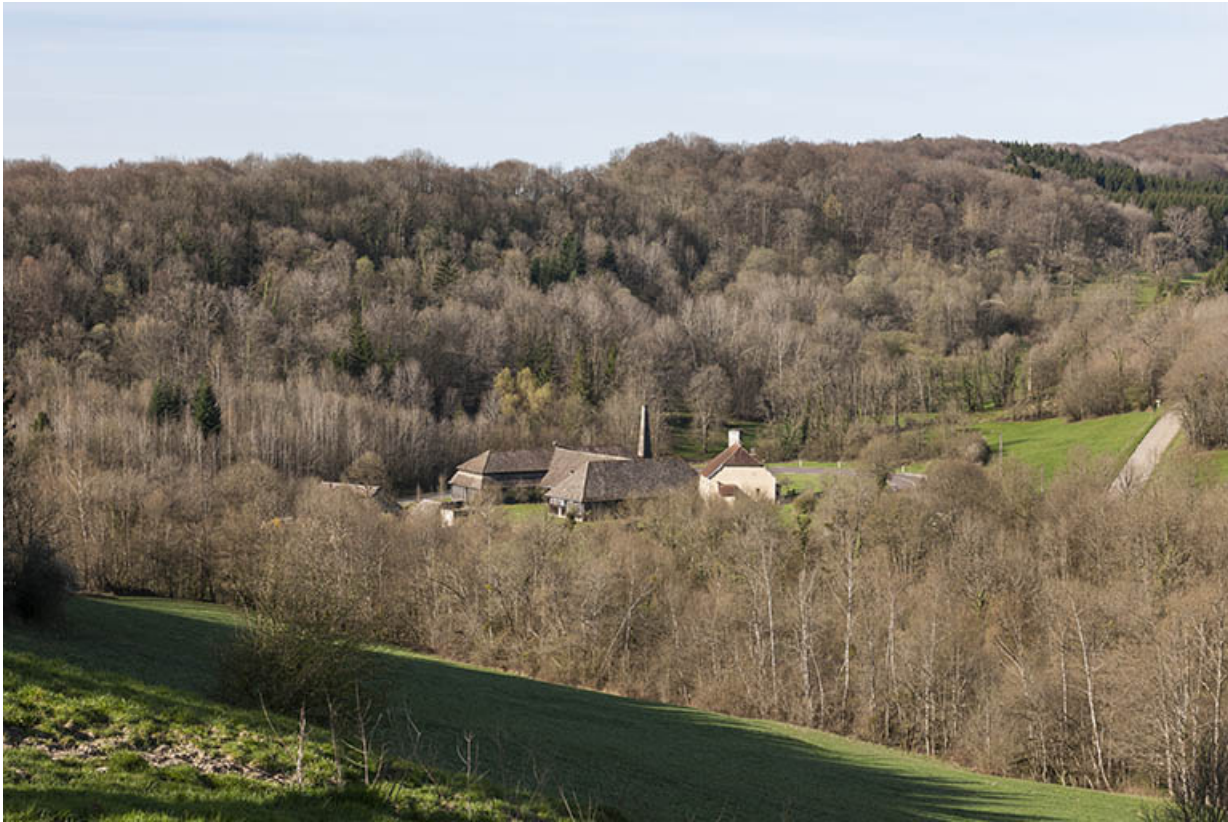
Vue d'ensemble depuis le nord-est.

25, Malbrans route départementale 67, lieudit : les Combes de Punay