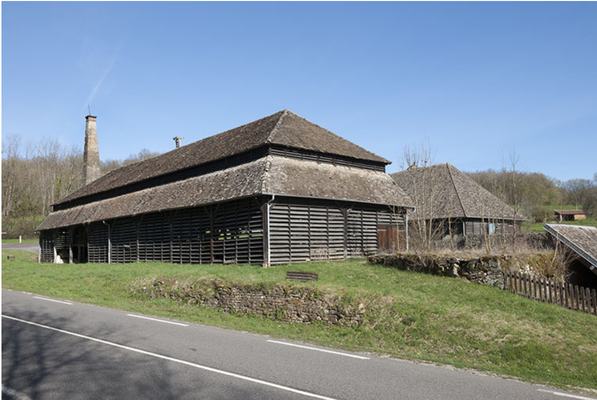
Vue d'ensemble depuis le sud-est.

25, Malbrans route départementale 67, lieudit : les Combes de Punay