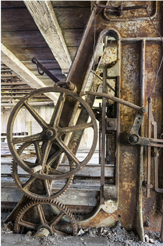
Détail du mécanisme d'entraînement du châssis.

25, Malbrans route départementale 67, lieudit : les Combes de Punay