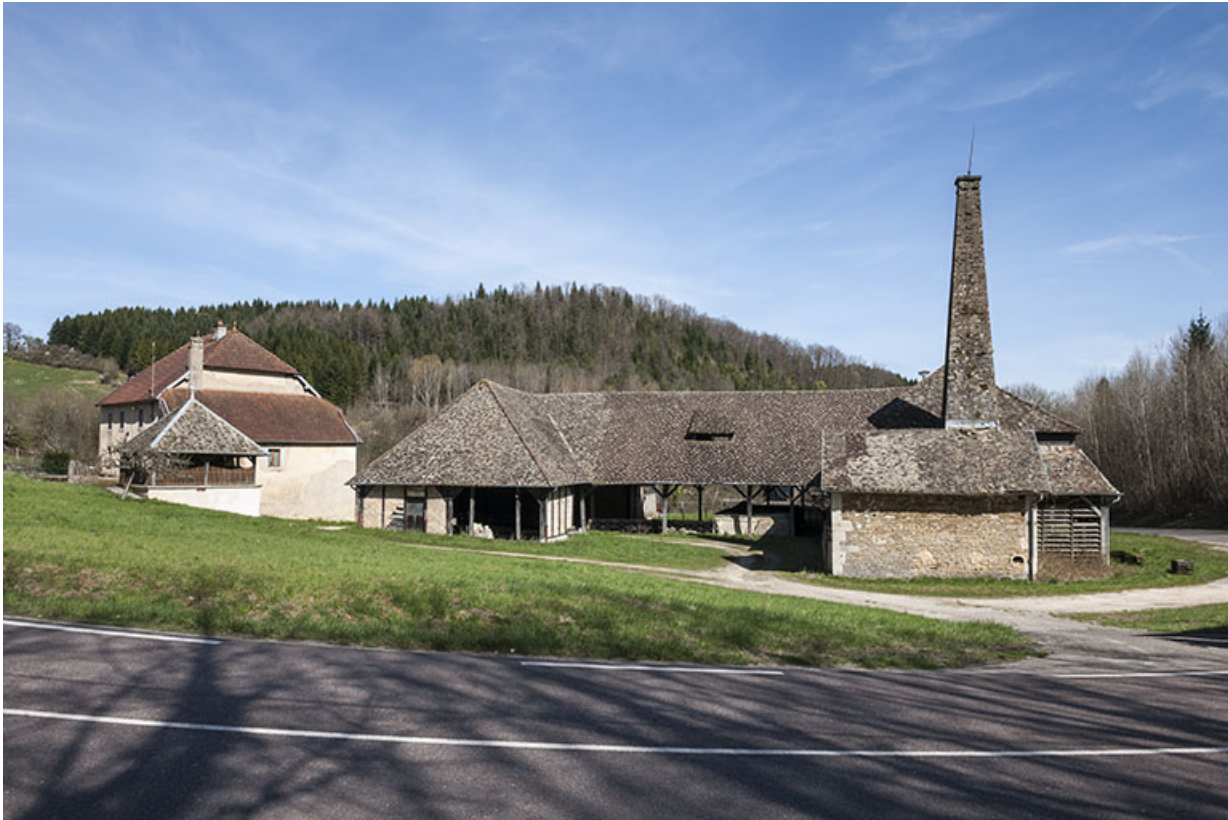
Vue d'ensemble depuis l'ouest.

25, Malbrans route départementale 67, lieudit : les Combes de Punay