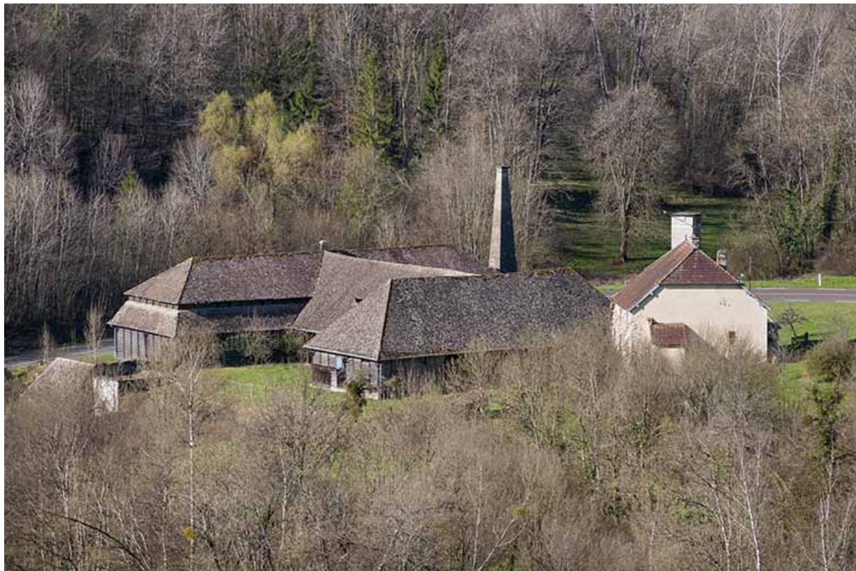
Vue plongeante depuis le nord-est.