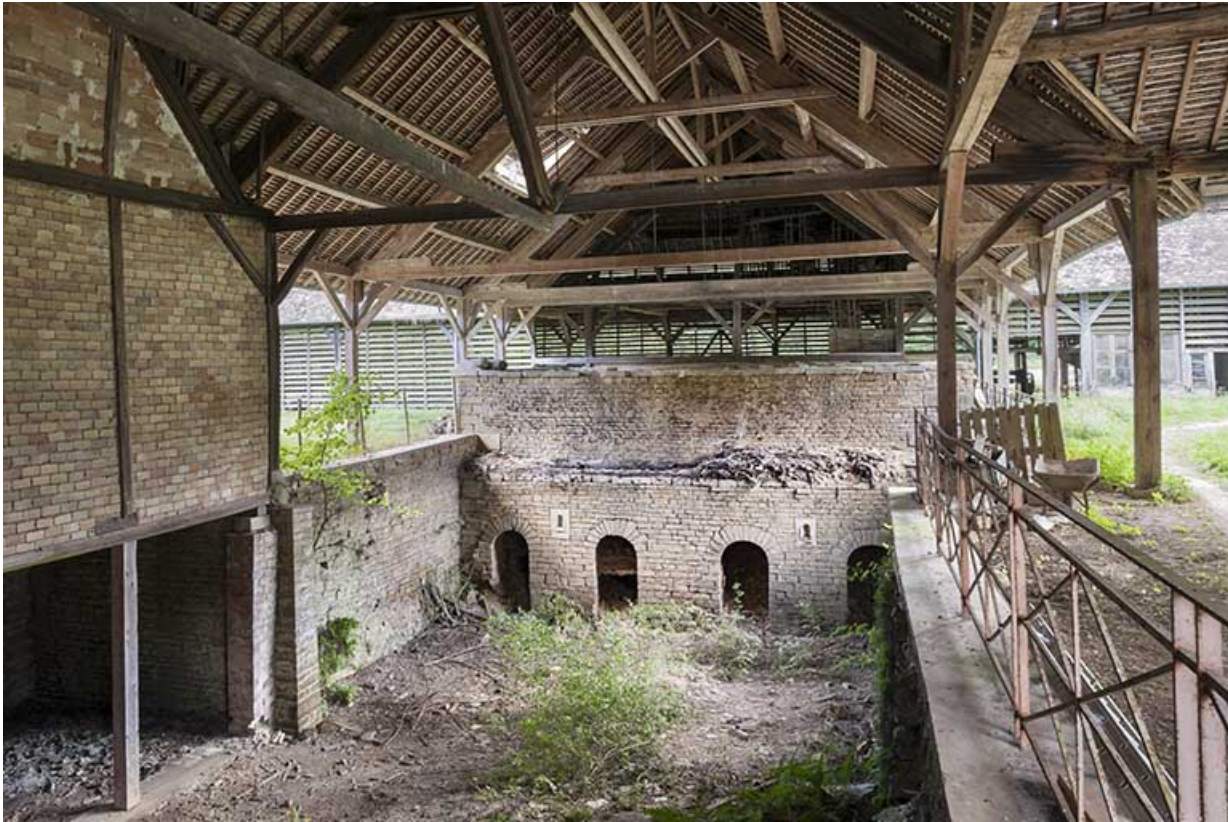
Aire d'enfournement et gueules de charge des fours.