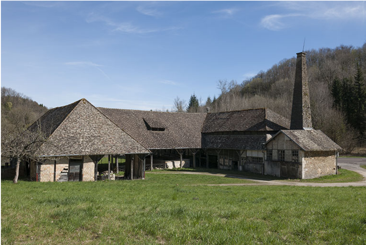
Vue rapprochée depuis le nord-ouest.

25, Malbrans route départementale 67, lieudit : les Combes de Punay