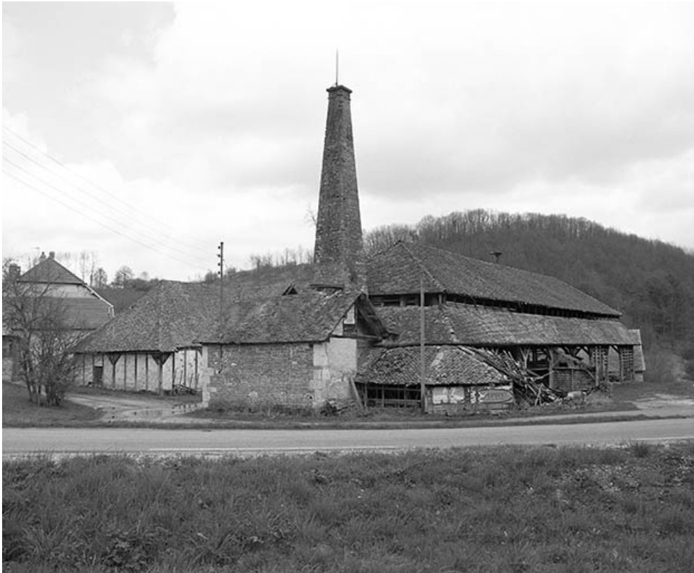
Vue d'ensemble depuis le sud-ouest.

25, Malbrans route départementale 67, lieudit : les Combes de Punay