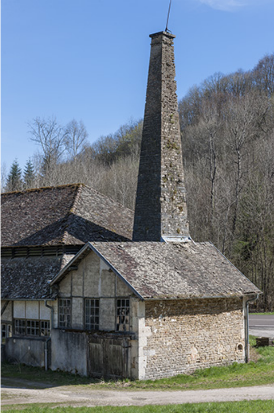
Chauferie et salle de la machine à vapeur.

25, Malbrans route départementale 67, lieudit : les Combes de Punay