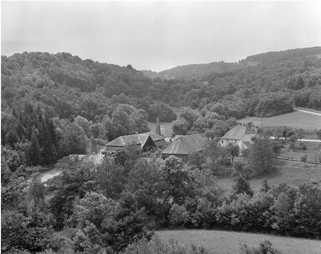
Vue générale du site depuis le nord-est.