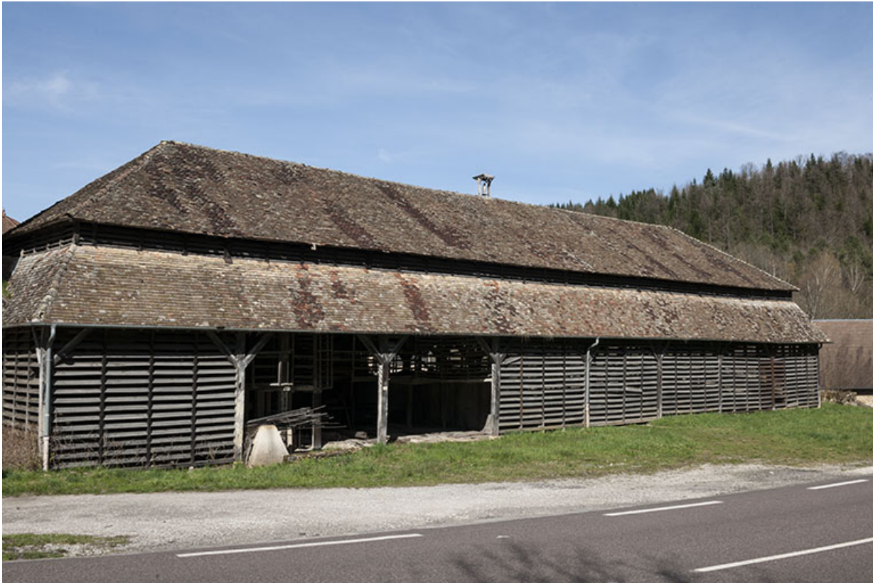
Façade sud de l'atelier de façonnage et du séchoir.

25, Malbrans route départementale 67, lieudit : les Combes de Punay