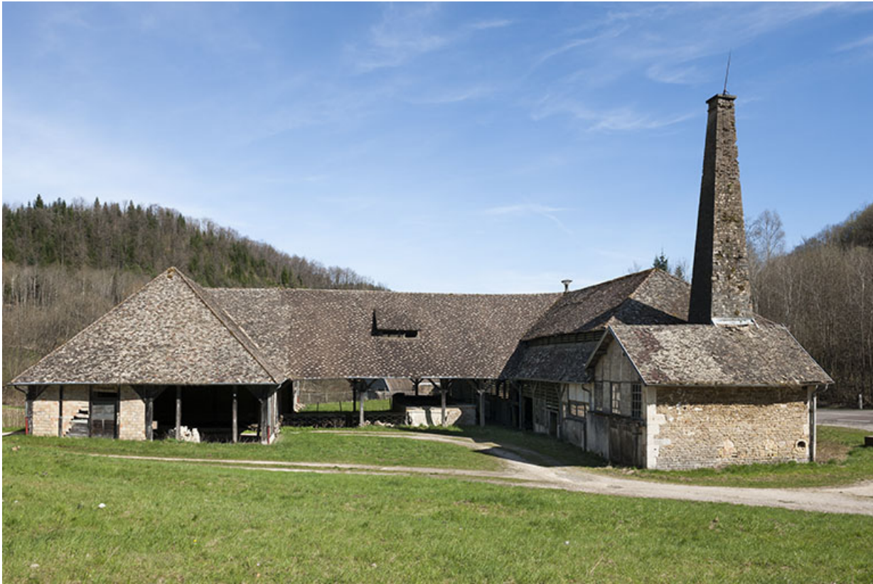
Vue rapprochée depuis l'ouest.