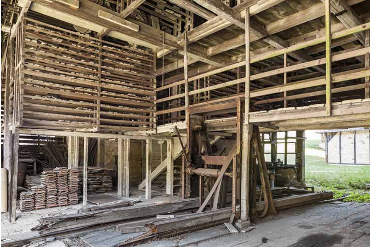
Le séchoir. Au premier plan, le châssis de scie.

25, Malbrans route départementale 67, lieudit : les Combes de Punay