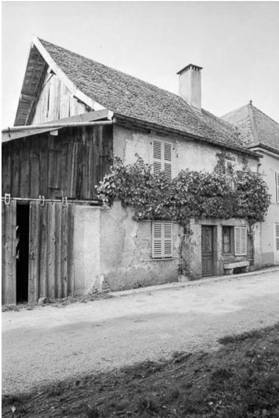
Ferme cadastrée 1971 AB 74 : vue générale. 25, Malbrans