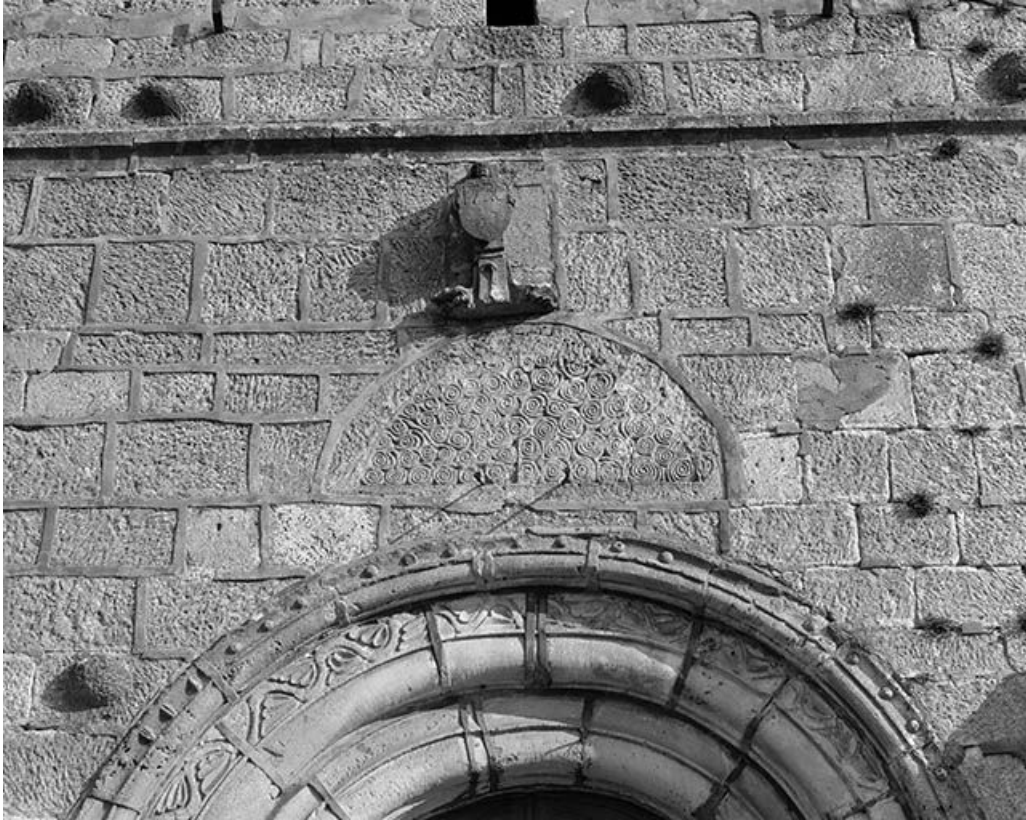
Vue de l'ancien tympan.