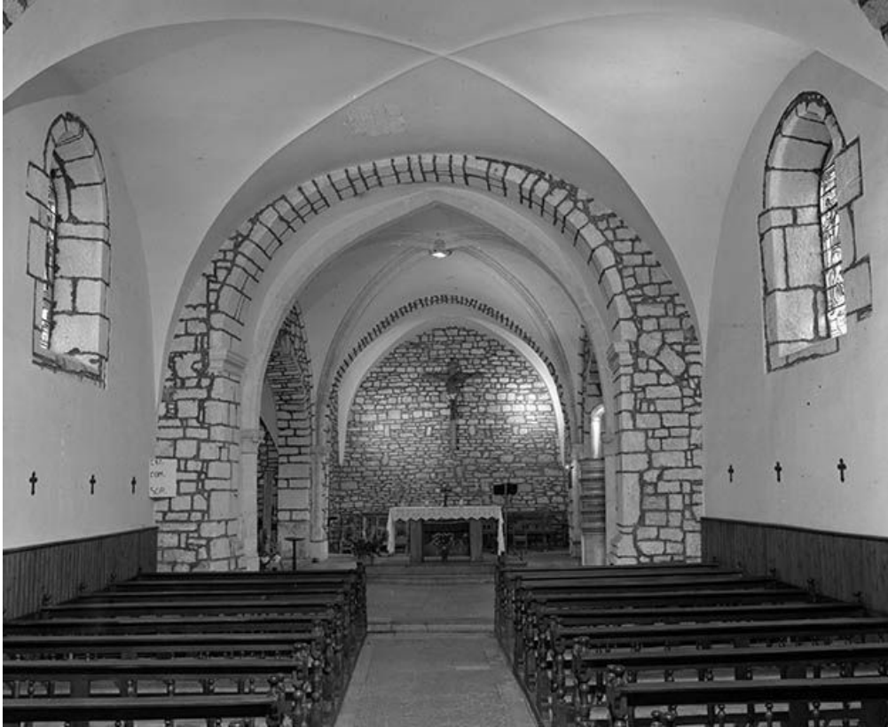
Intérieur : le chœur et la nef vus depuis l'entrée.