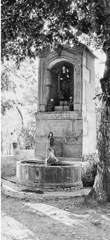
Vue générale, vers 1965.