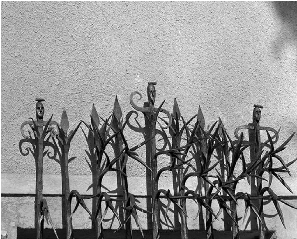
Détail de la grille d'une baie du rez-de-chaussée des communs.