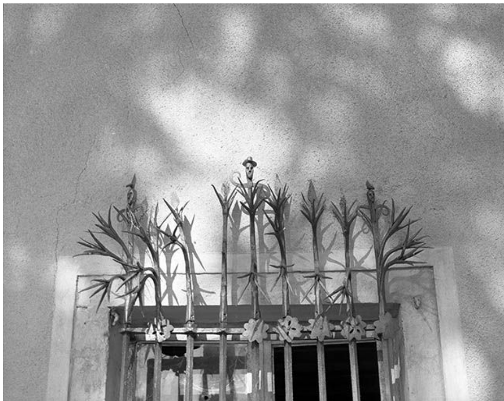
Détail de la grille d'une baie du rez-de-chaussée des communs.