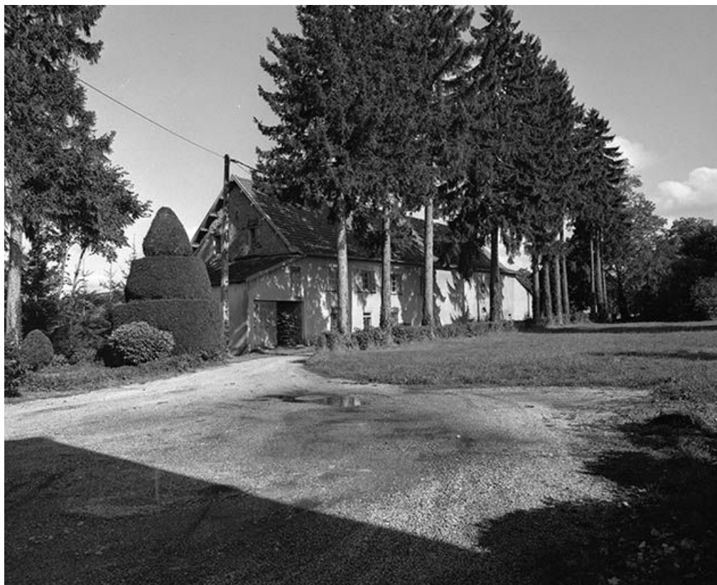
Vue générale des communs.