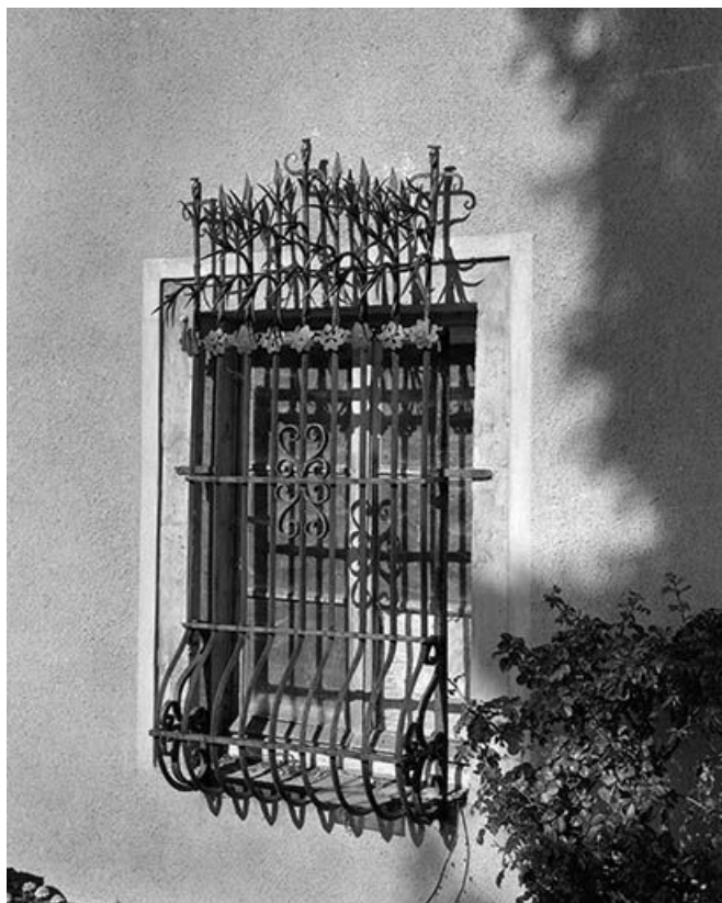
Une des baies du rez-de-chaussée des communs.