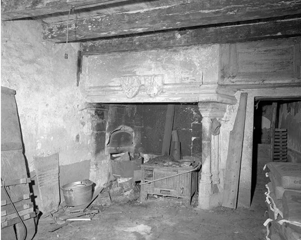
Les communs : cheminée de l'ancien logis du gardien figurant les armes de la famille de Vienne-Grandson. 25, Durnes rue du Château