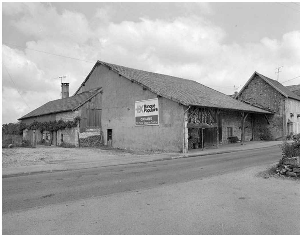
Vue générale de trois quarts gauche. 25, Chantrains