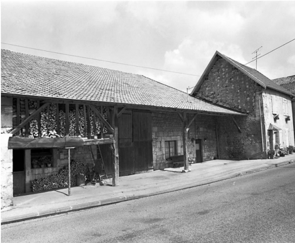
Façade antérieure de trois quarts gauche. 25, Chantrans route de Salins