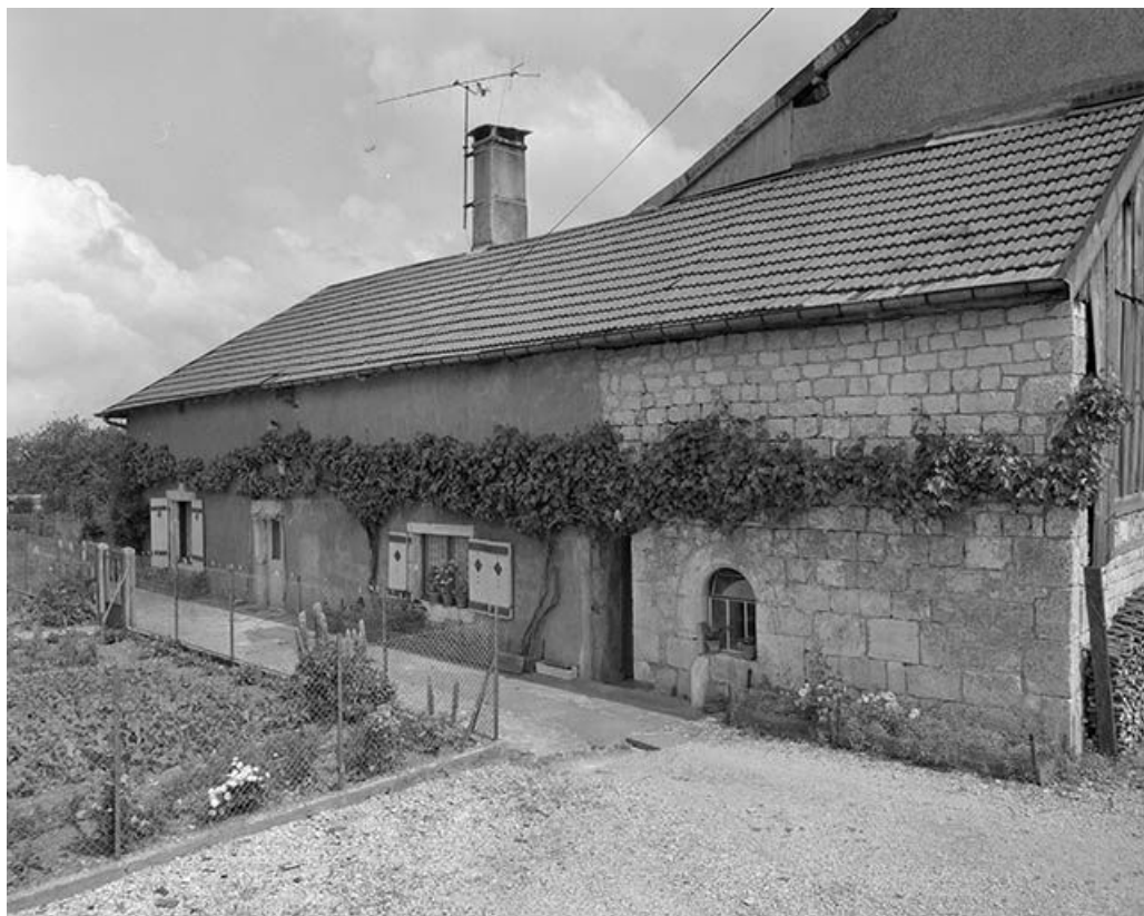
Face latérale gauche de trois quarts droit.