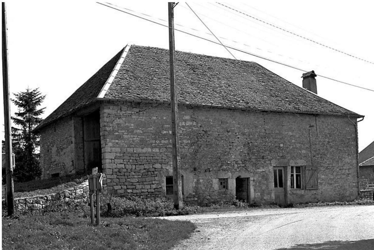
Façade antérieure vue de trois quarts gauche.