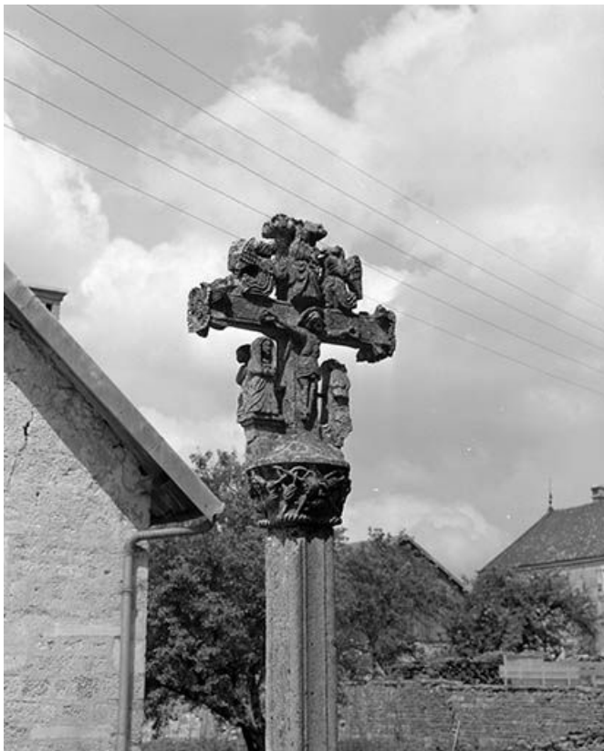
Détail : scène du Calvaire de trois quarts gauche.

25, Amathay-Vésigneux rue de l' Eglise, lieudit : Vésigneux