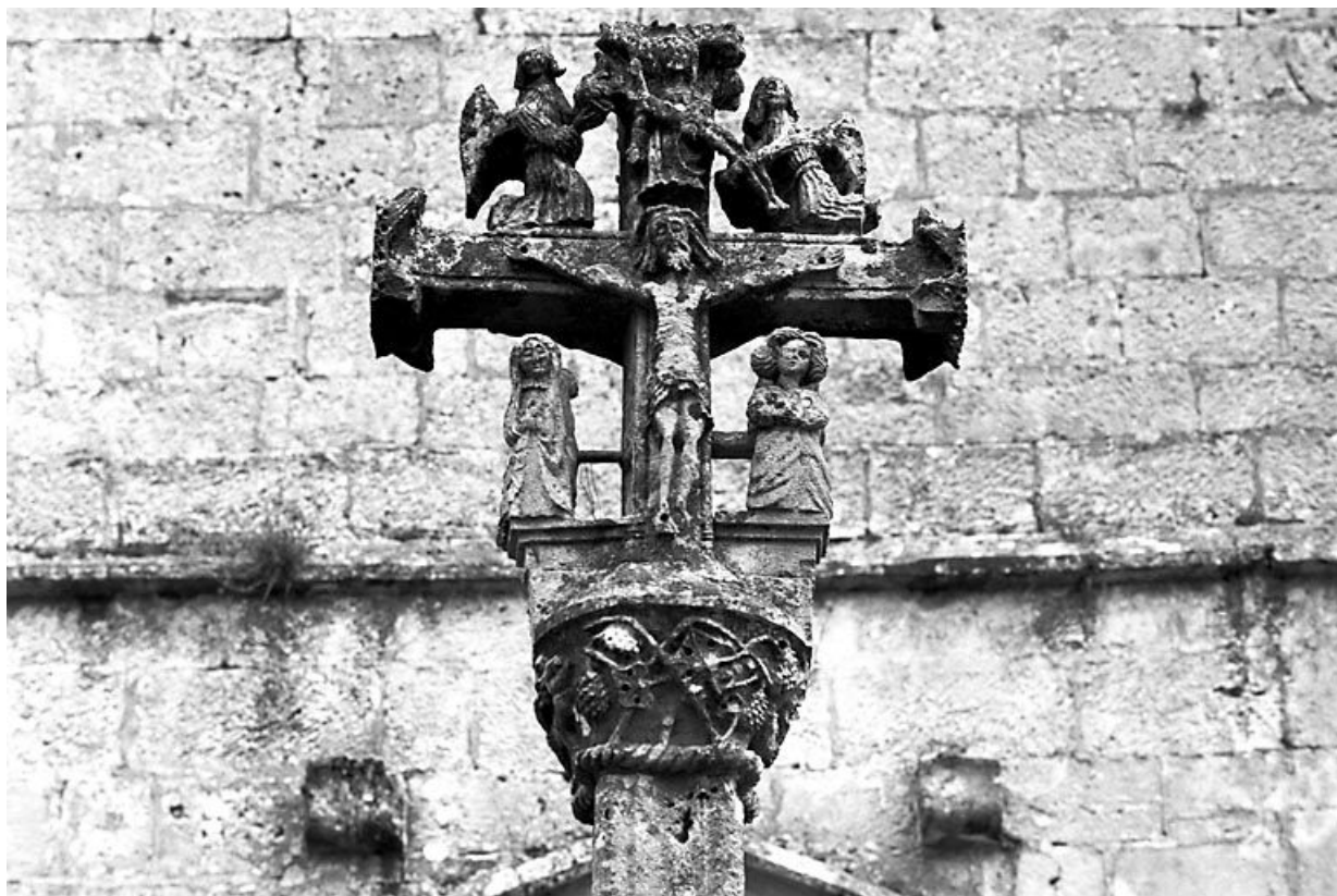
Détail : scène du Calvaire de face.

25, Amathay-Vésigneux rue de l' Eglise, lieudit : Vésigneux