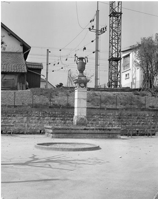
Vue générale de trois quarts gauche.