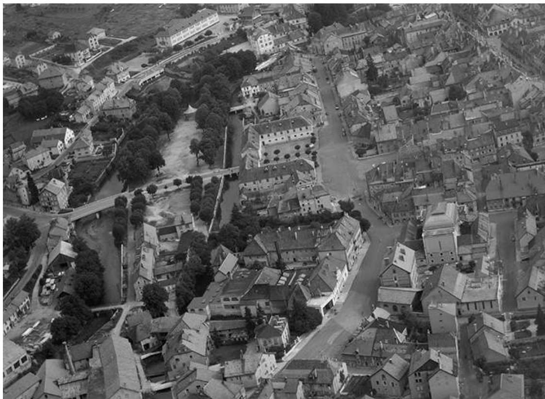
Le quai du Doubs, la rue Jeanne d'Arc et la place Jules Pagnier au centre en 1956 25, Pontarlier