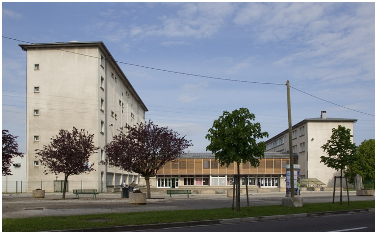
Vue d'ensemble, depuis l'est. 25, Pontarlier, 3 rue des Fusillés