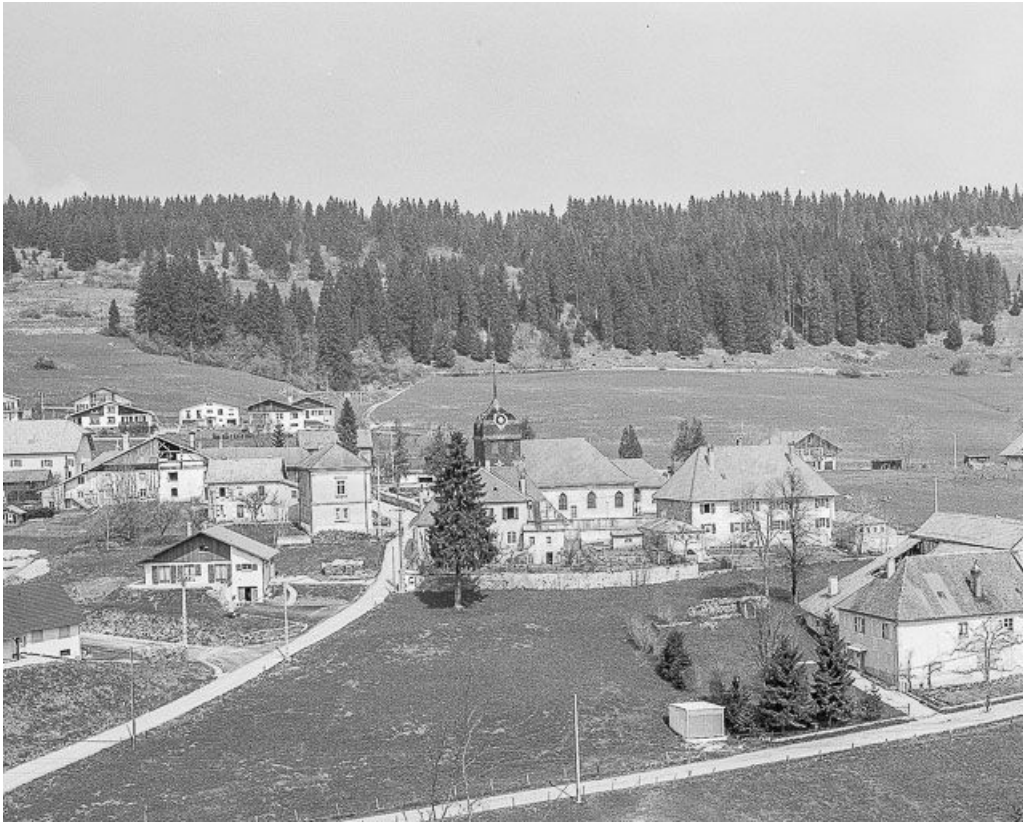
Vue de l'église dans le village.