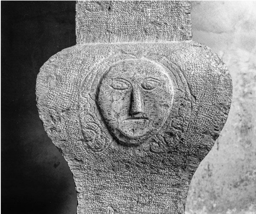
Détail culot : soleil.