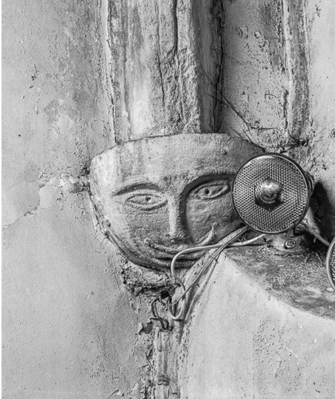
Détail culot : masque.