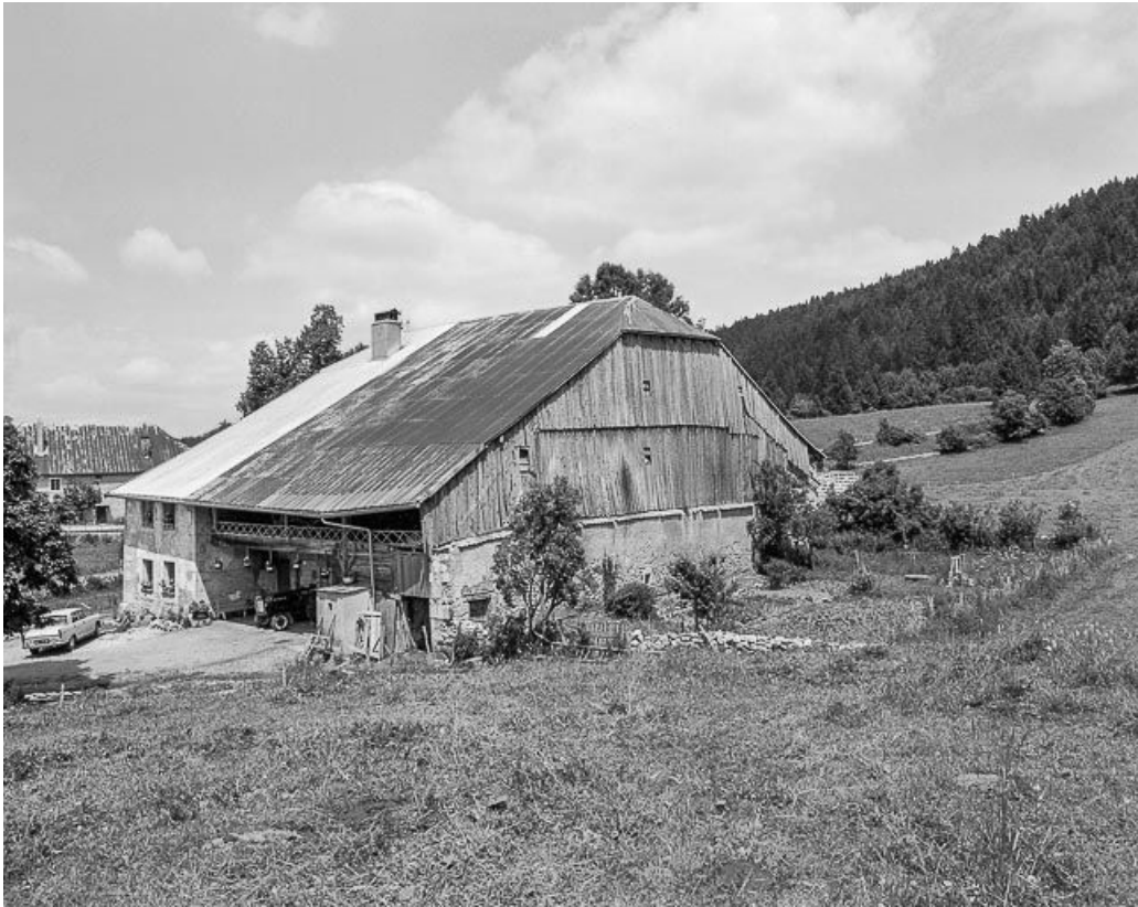
Façade postérieure et latérale droite.

25, Les Hôpitaux-Vieux chemin des Coudrettes