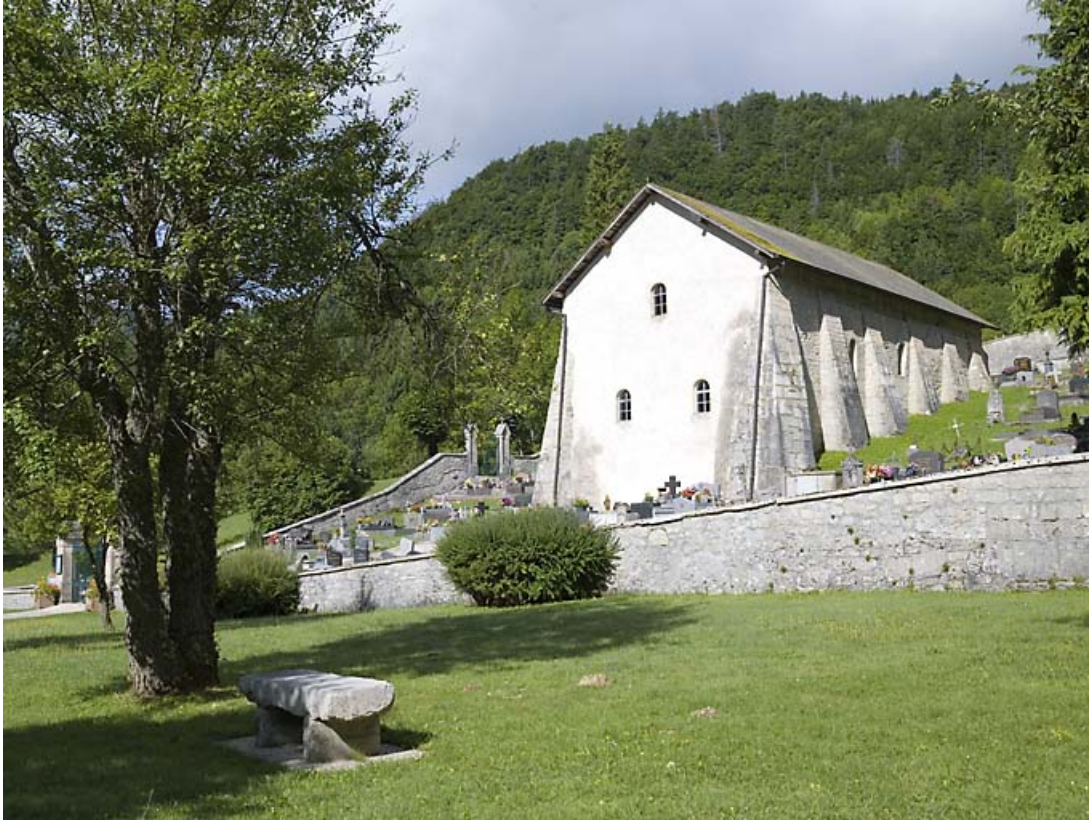
Vue générale, depuis le sud-est.