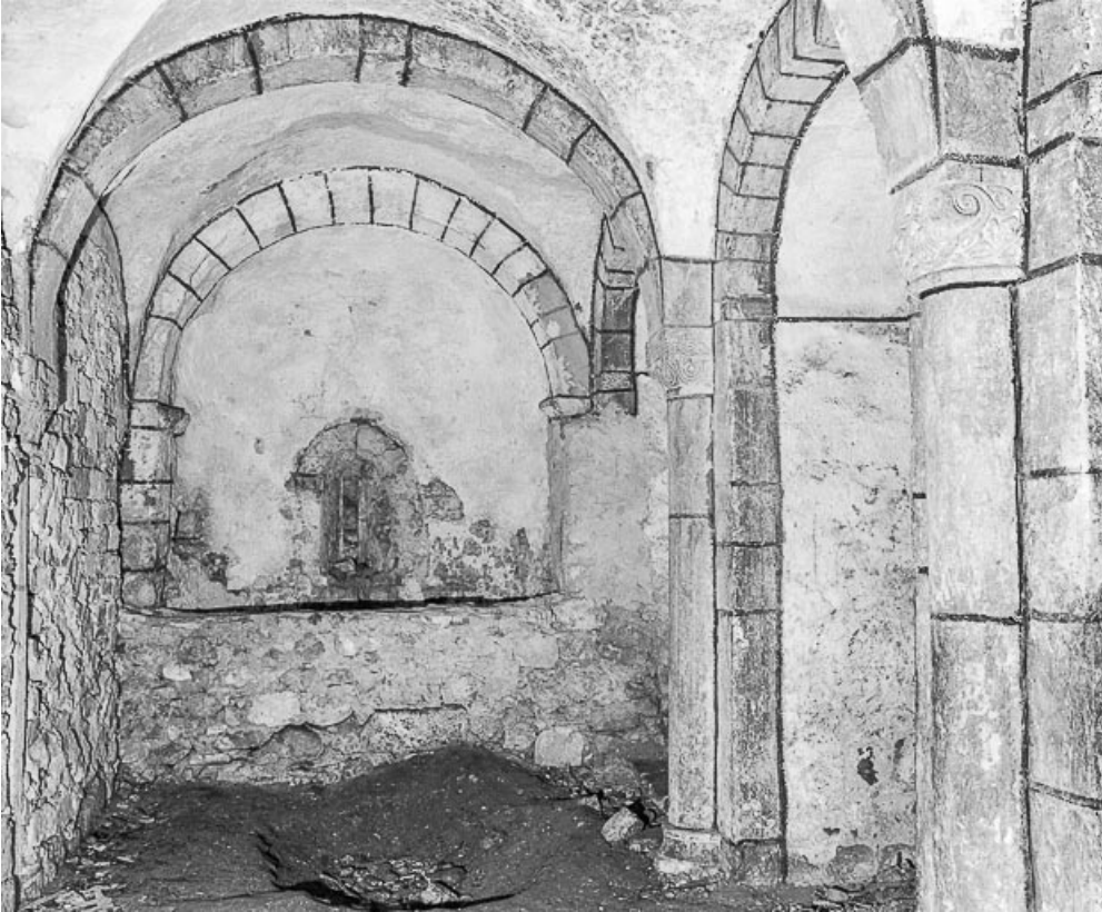
Vue d'ensemble de la crypte.