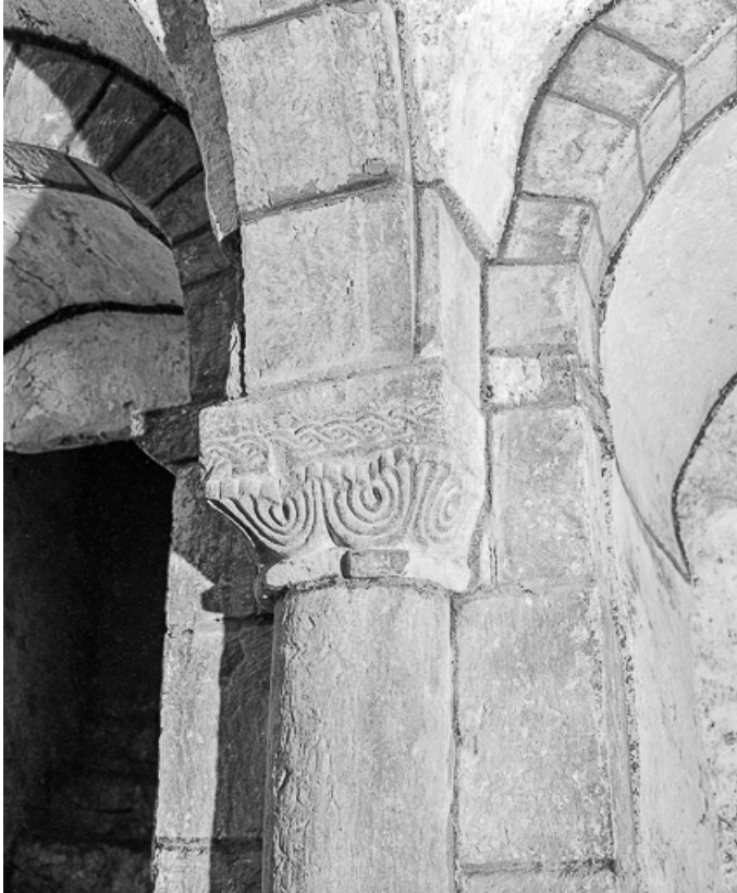
Crypte : chapiteau du mur ouest, côté sud.