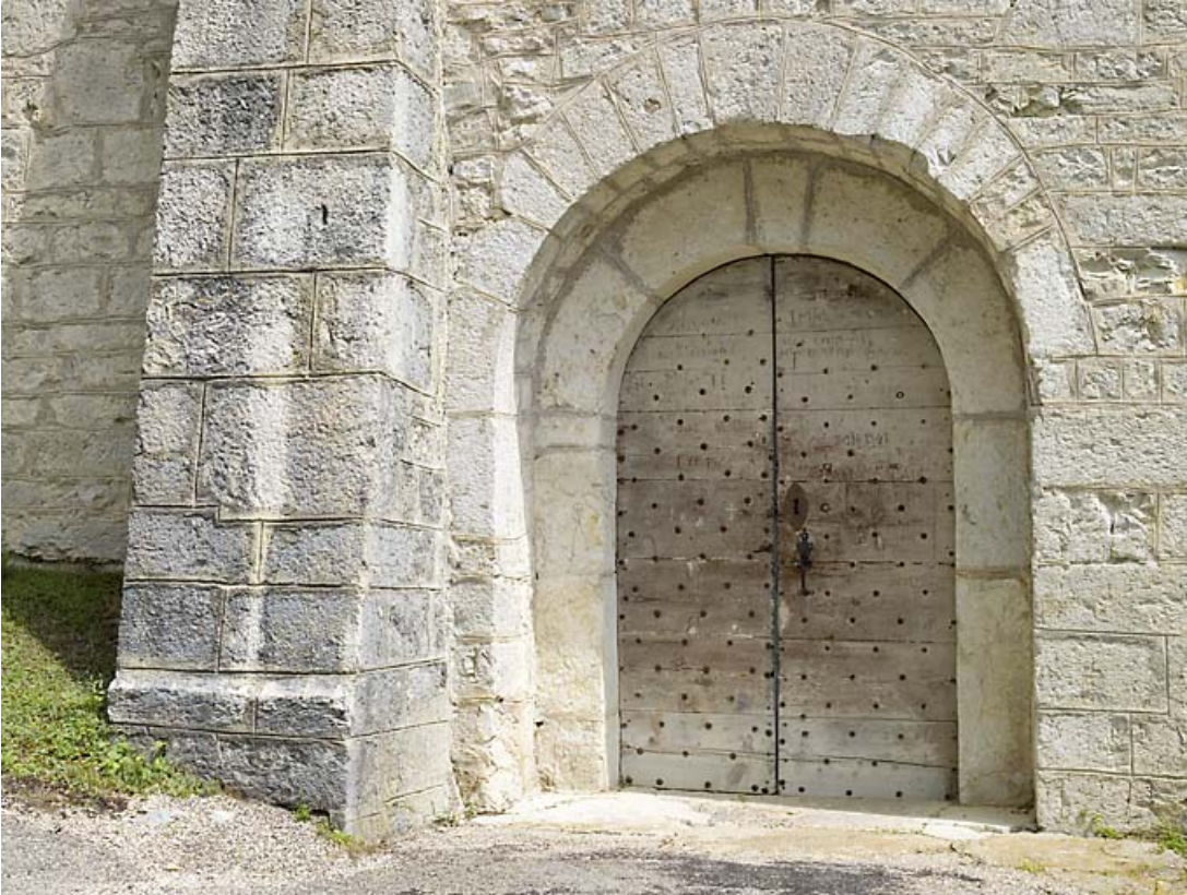
Façade sud : entrée.