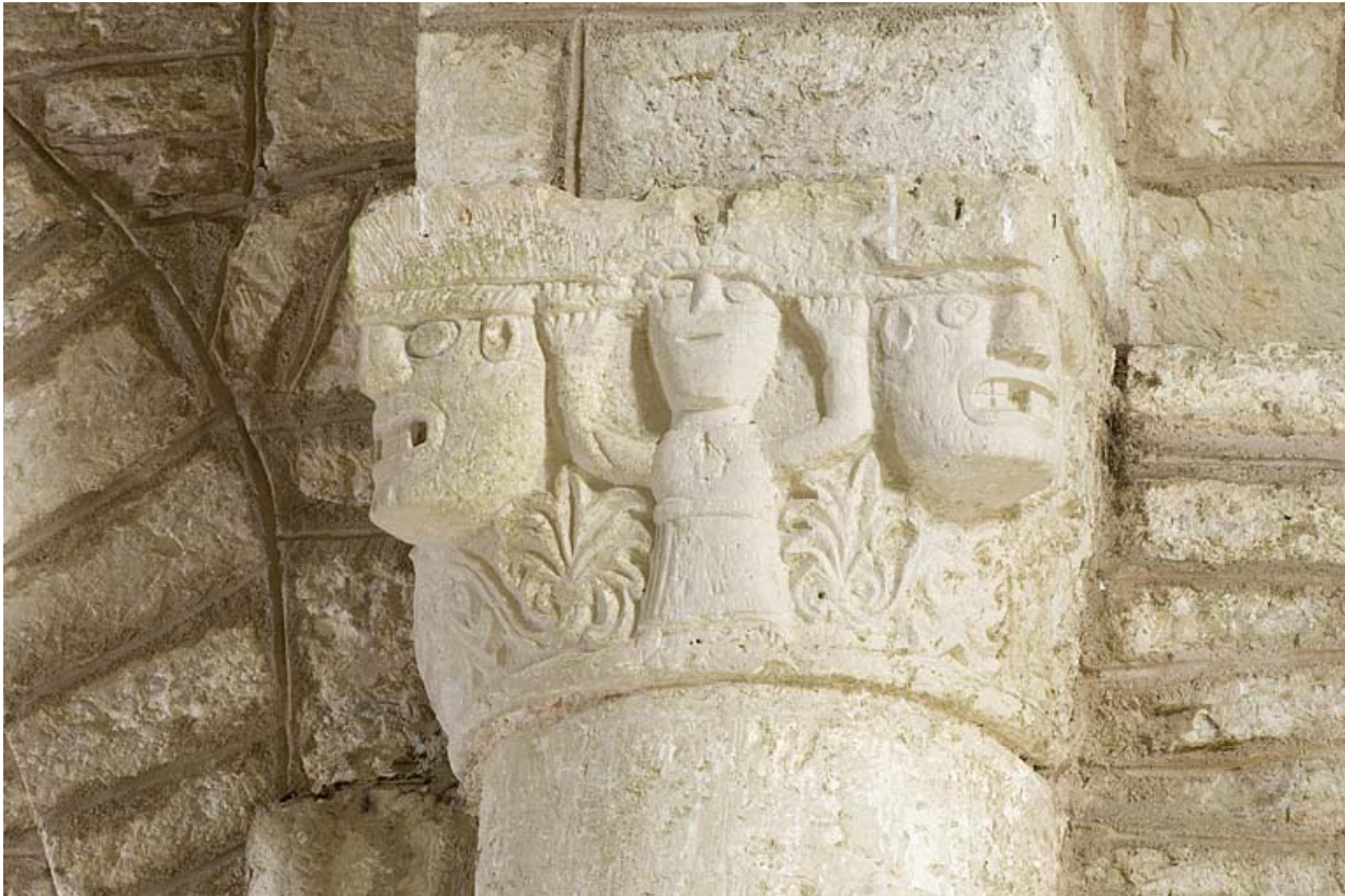
Intérieur : détail du chapiteau avec un personnage.