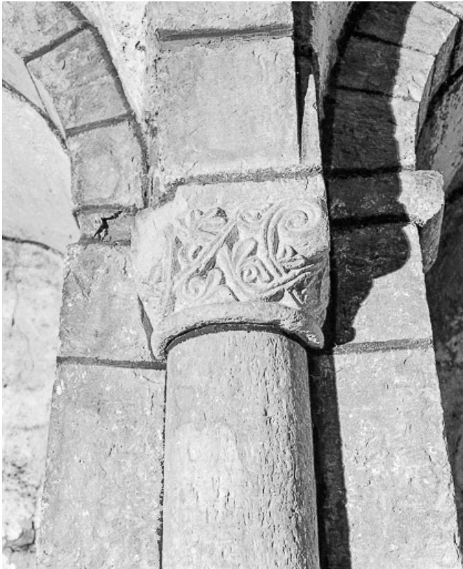
Crypte : chapiteau du mur ouest, côté nord.