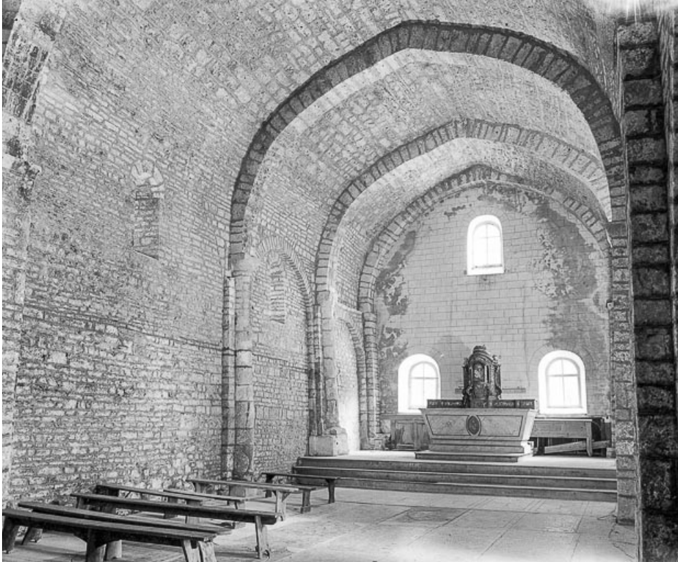
Intérieur de la chapelle.