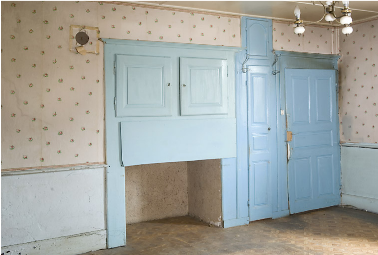
Grande chambre (du 2nd étage ?) : placard, emplacement de l'horloge comtoise et porte. 25, Jougne, 17 rue du Faubourg