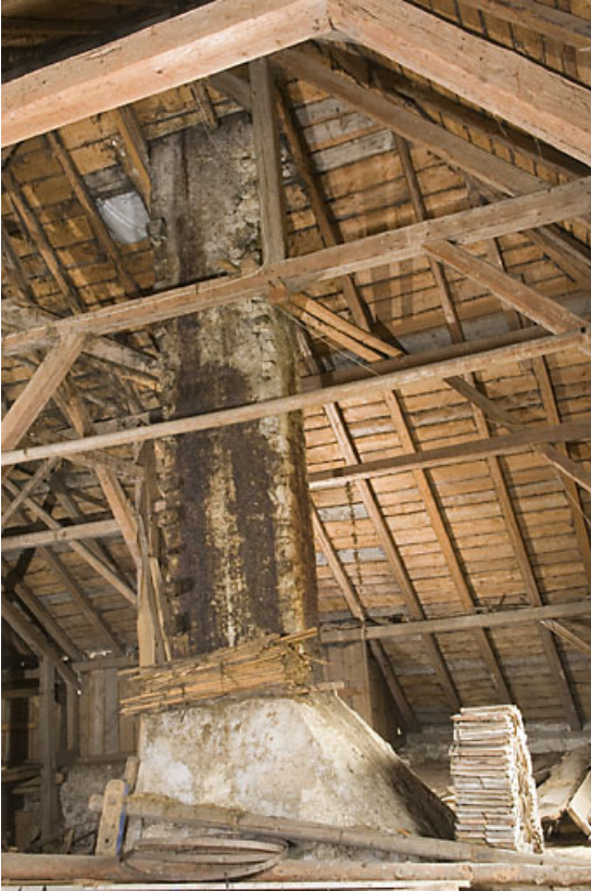
Grange : conduit de cheminée. 25, Jougne, 17 rue du Faubourg