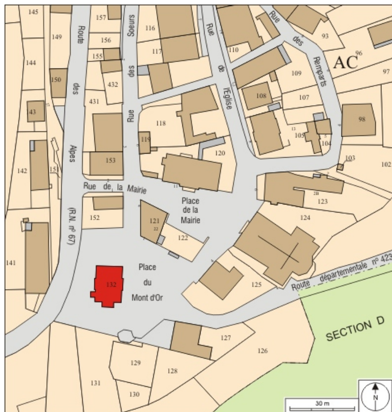
Plan-masse et de situation. Extrait du plan cadastral, 2008, section AC, échelle 1:1 000. 25, Jougue place du Mont d'Or