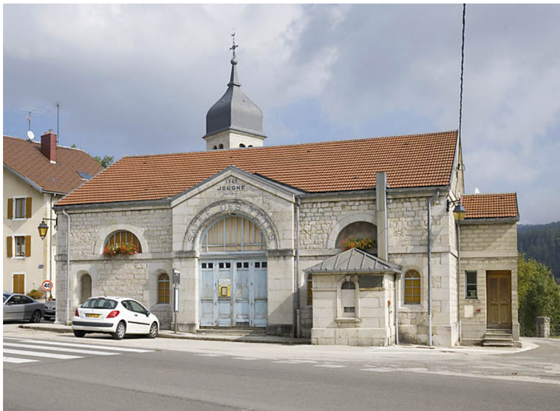
Façade antérieure de trois quarts droit.