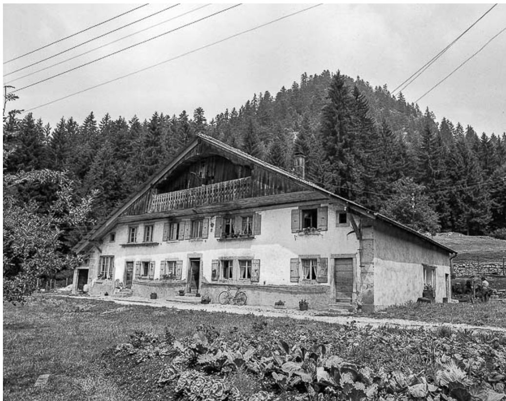
Ferme située au lieu-dit Le Dessus de la Fin, cadastrée B 1-6 : façades antérieure et latérale droite. 25, Les Gras, 6 rue le Dessus de la Fin, lieudit : le Dessus de la Fin