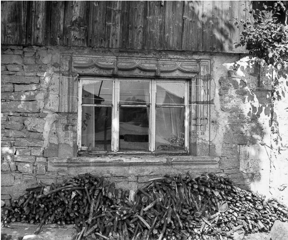
Façade antérieure : fenêtre.

25, Grand'Combe-Châteleu 1ère ferme, lieudit : les Cordiers