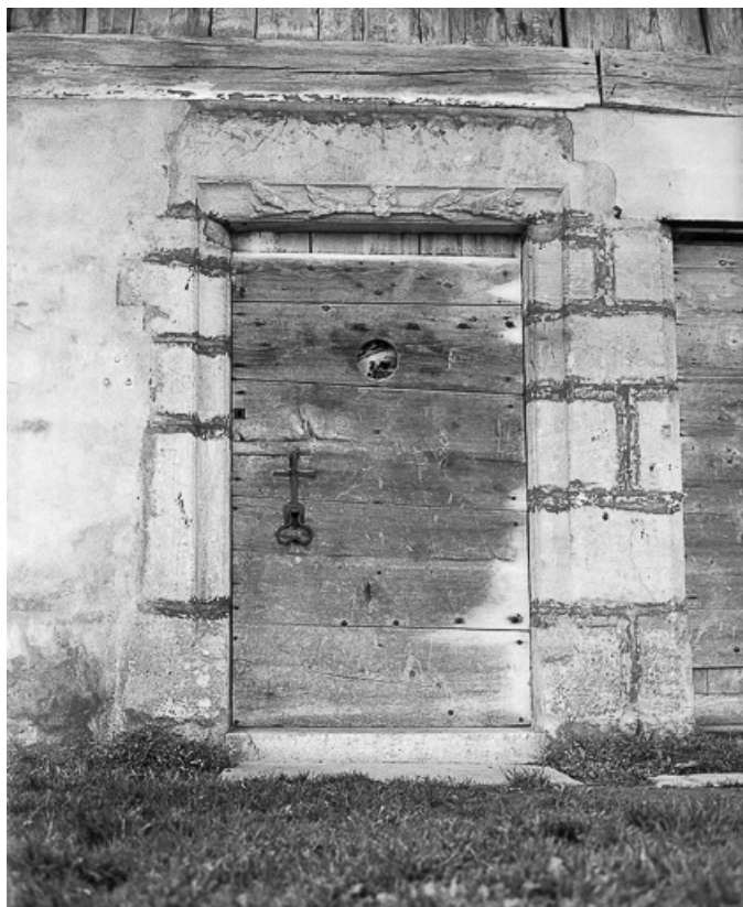
Extérieur : porte sur le mur gouttereau.

25, Grand'Combe-Châteleu 1ère ferme, lieudit : les Cordiers