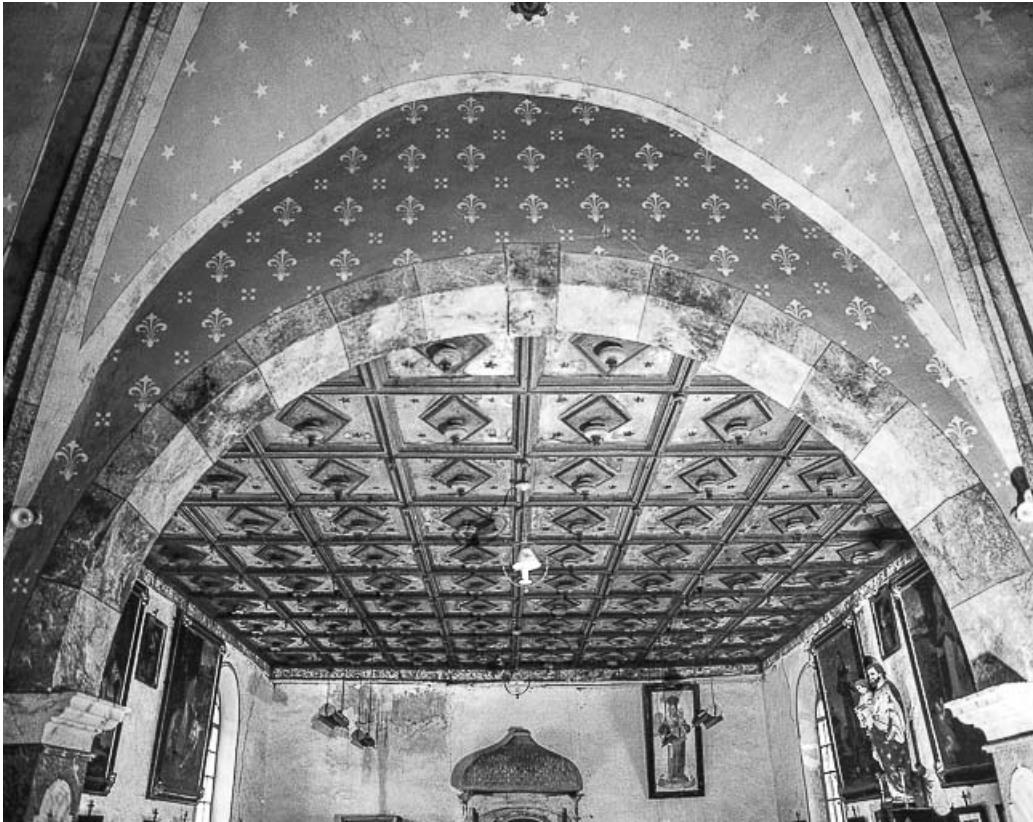
Plafond de la nef.

25, Villers-le-Lac, lieudit : les Bassots