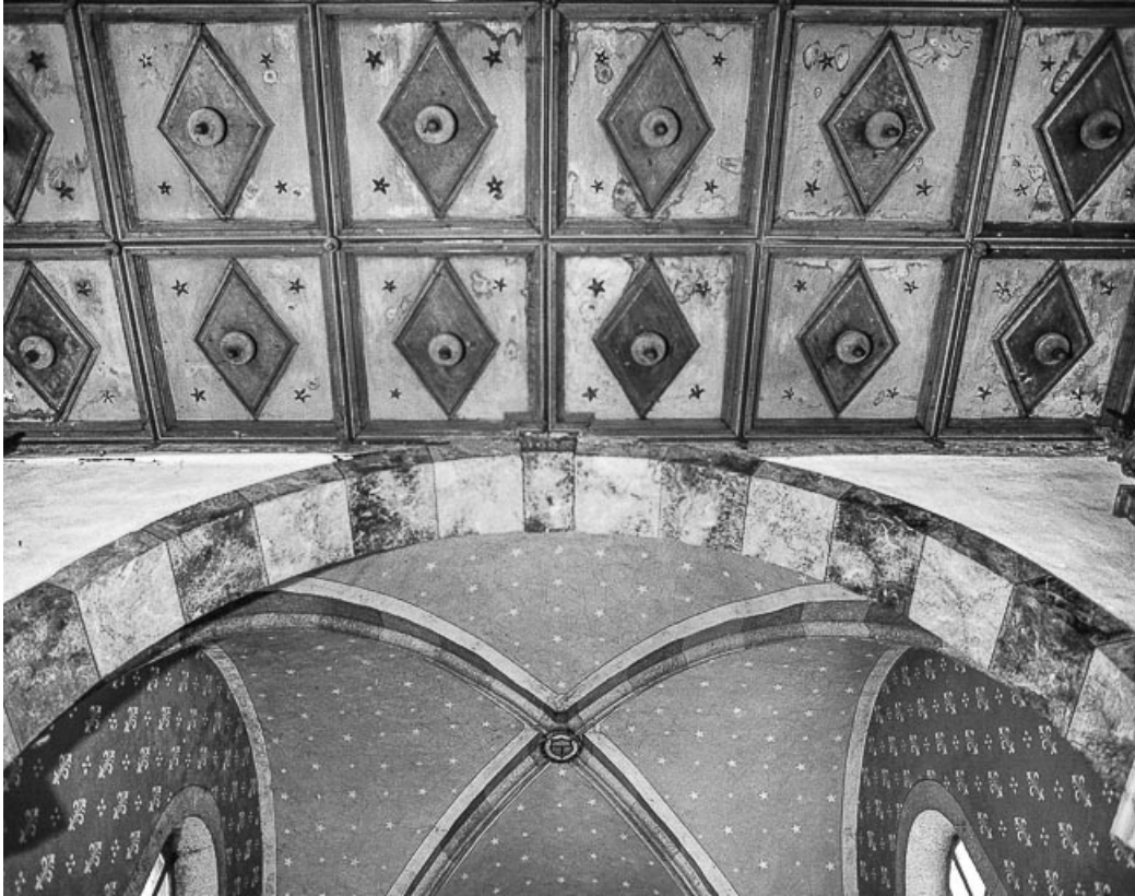
Plafond de la nef, arc triomphal, voûte du chœur.

25, Villers-le-Lac, lieudit : les Bassots