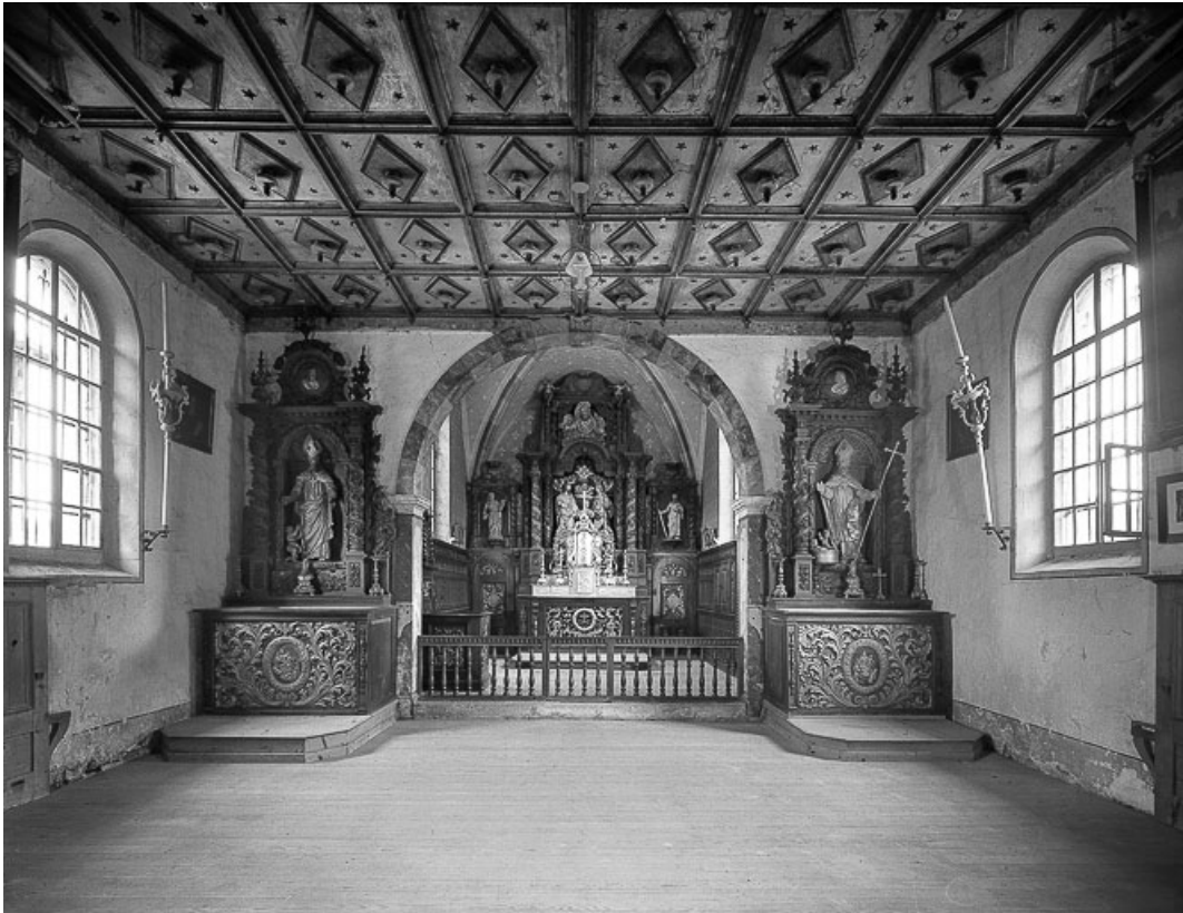
Vue de la nef et du chœur.

25, Villers-le-Lac, lieudit : les Bassots