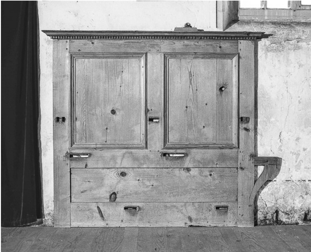
Détail des boiseries de la nef.

25, Villers-le-Lac, lieudit : les Bassots