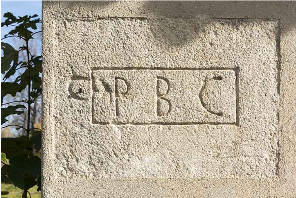
Initiales sur la façade latérale gauche.