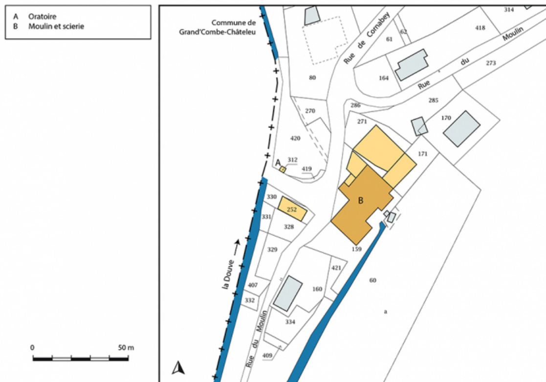
Plan-masse et de situation. Extrait du plan cadastral, 2017, section A, 1/1 000. 25, Montlebon, lieudit : Cornabey