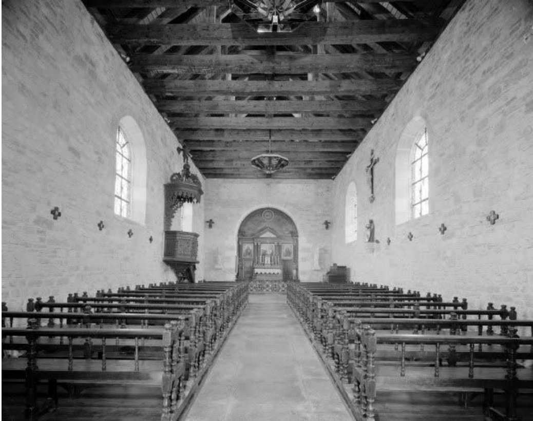
Intérieur : nef et chœur.