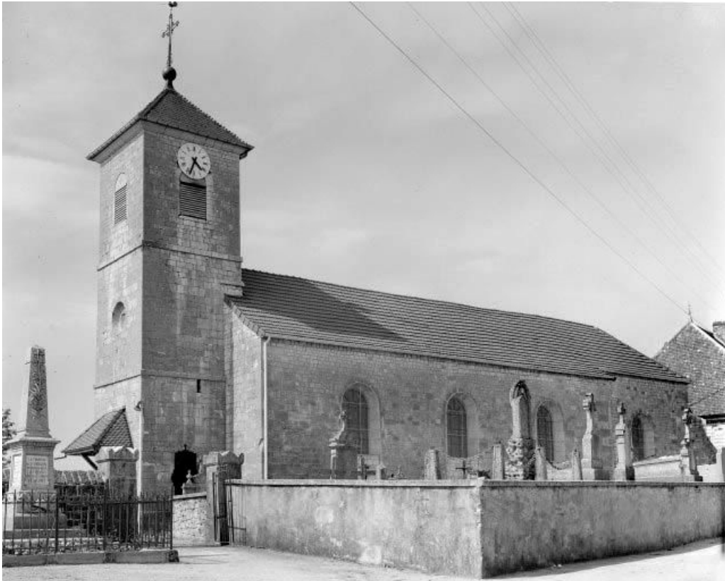
Façades antérieure et latérale droite. 25, Saint-Gorgon-Main