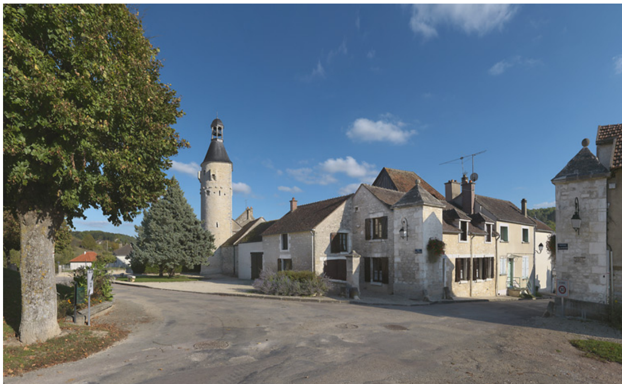
La tour dite de l'horloge et la porte de la Poterne. 89, Cravant