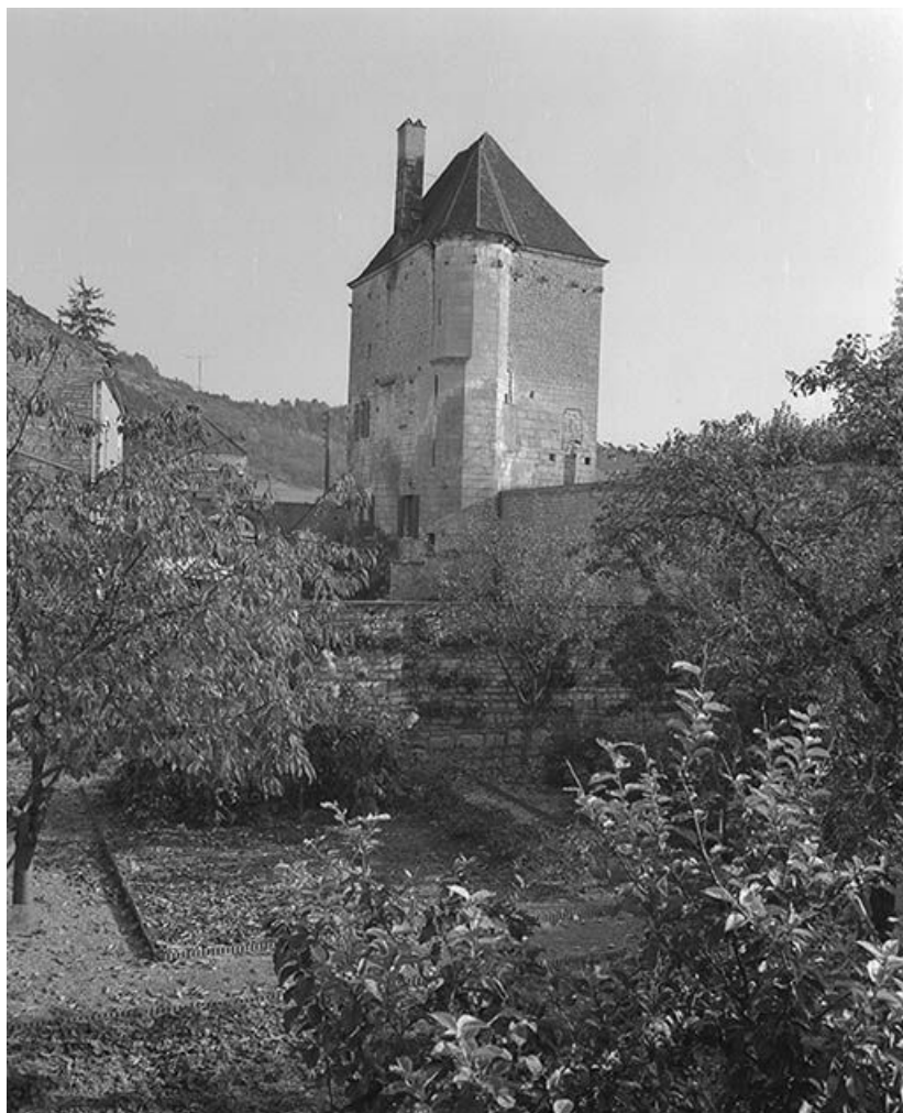
Le donjon. 89, Cravant