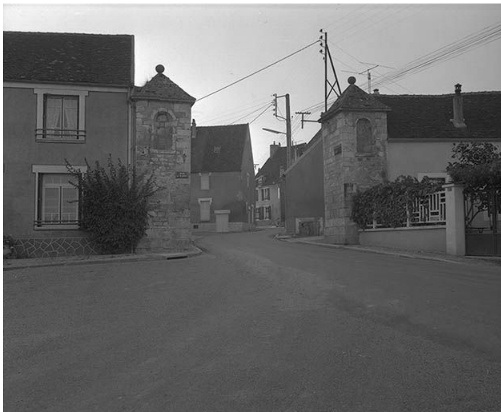
Porte d'Arbault. 89, Cravant