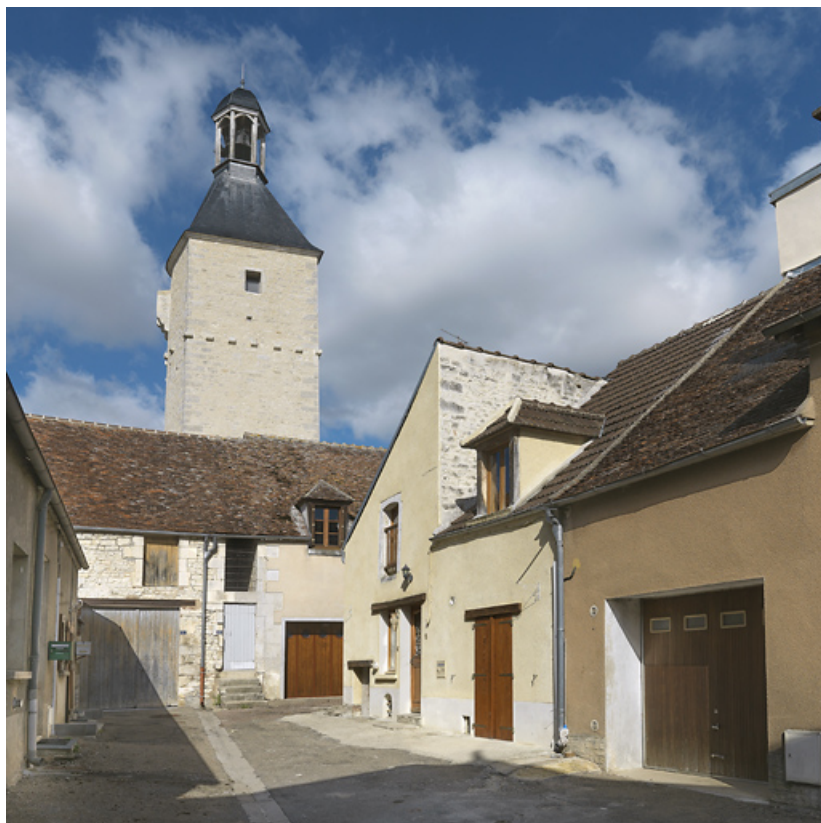
Vue de l'arrière de la tour de l'horloge.