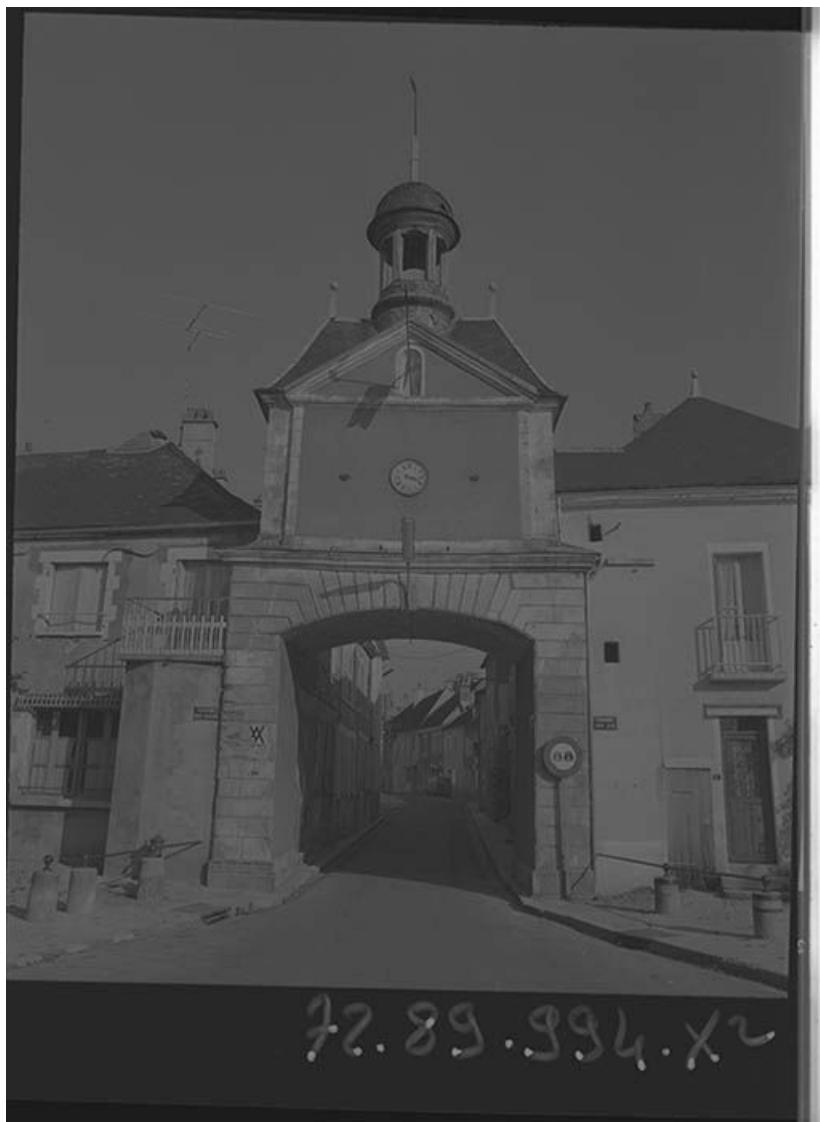
Porte d'En Bas.