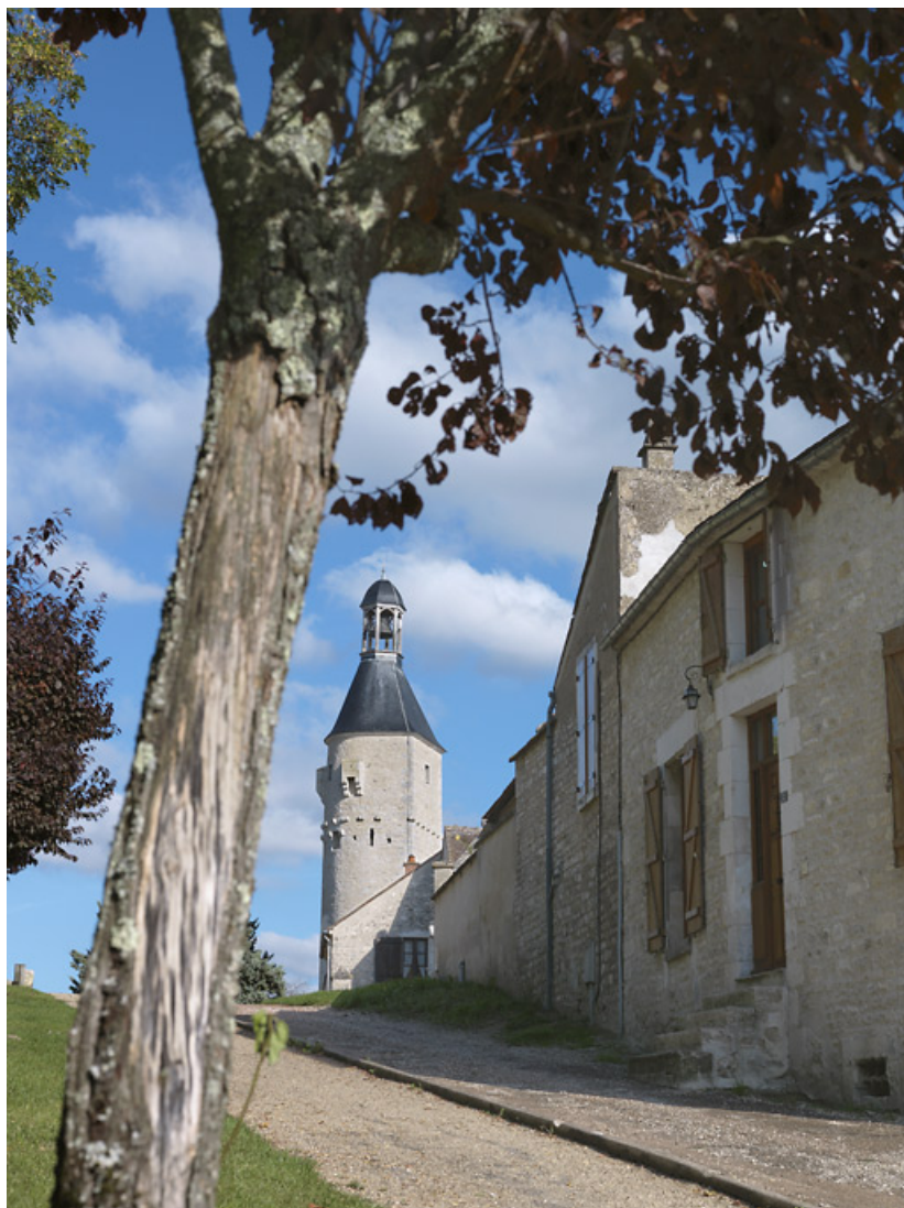
Vue d'ensemble de la tour de l'horloge. 89, Cravant