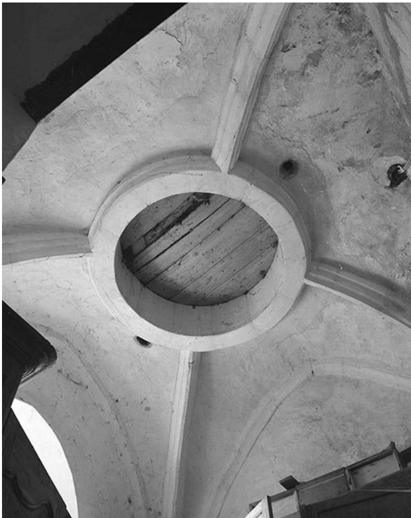
Clocher, niveau inférieur : voûte. 89, Mailly-la-Ville