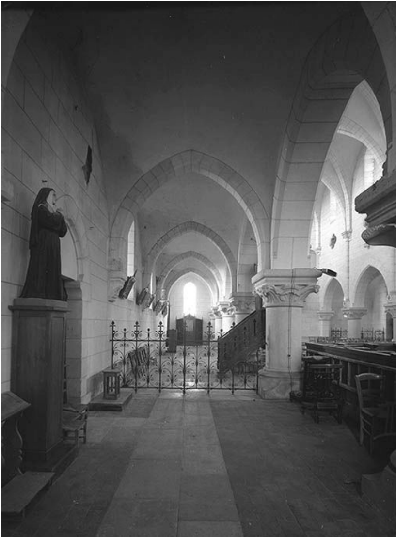
Collatéral droit. 89, Mailly-la-Ville