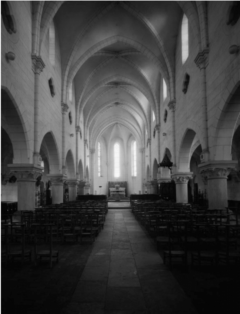
Nef et chœur.