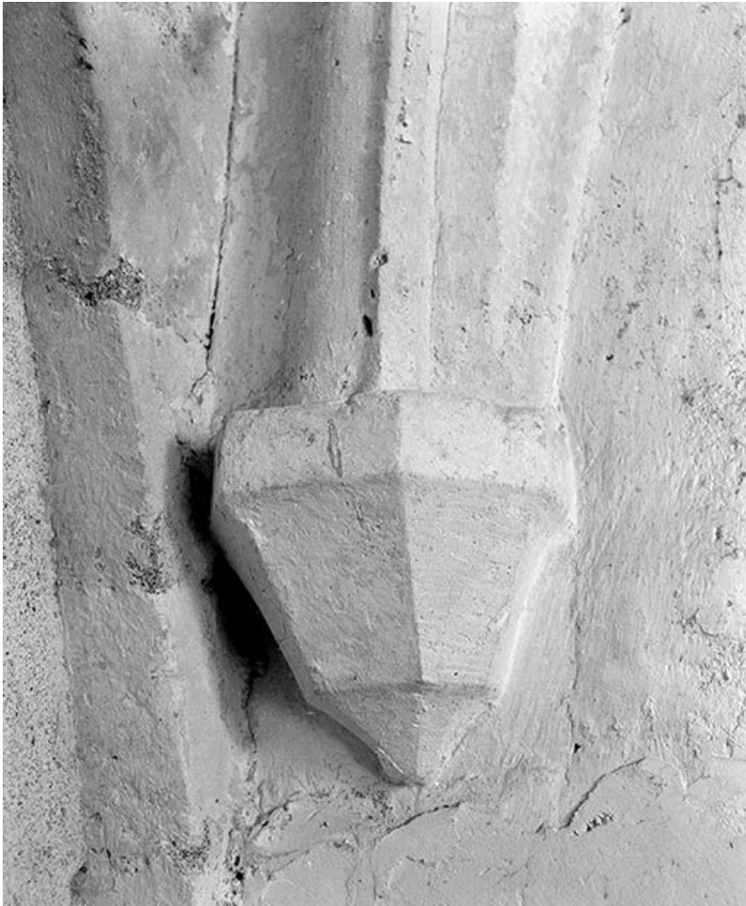
Clocher, niveau inférieur : culot postérieur gauche.