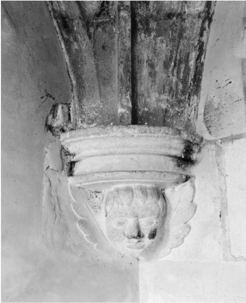
Culot avec ange sculpté, sacristie.