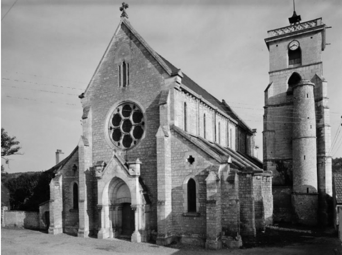
Façade et élévation droite.