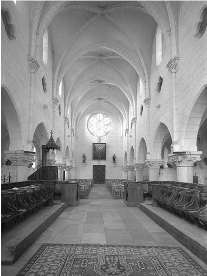
Nef, vue du chœur.