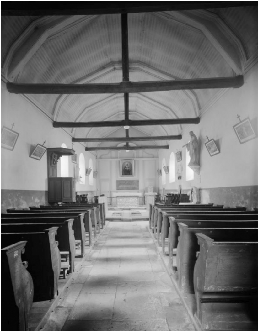
Nef et chœur.