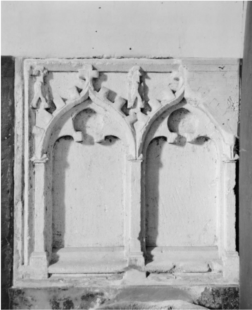
Eléments d'architecture en remploi.