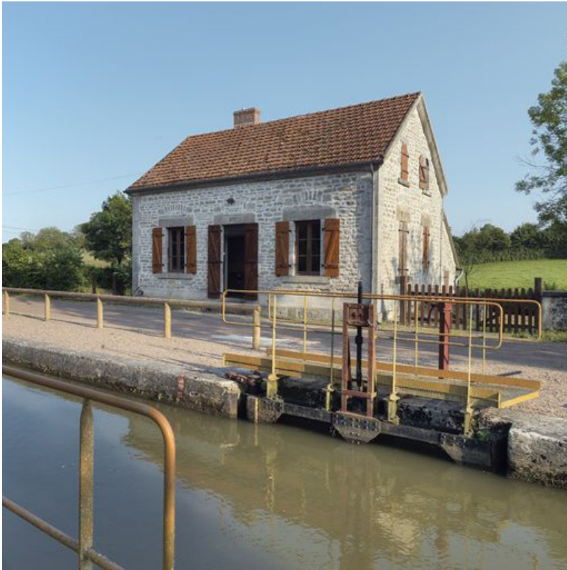
La maison éclusière, vue de 3/4 avant.

58, Brinay bief 22 du versant Loire, lieudit : bief 22 du versant Loire