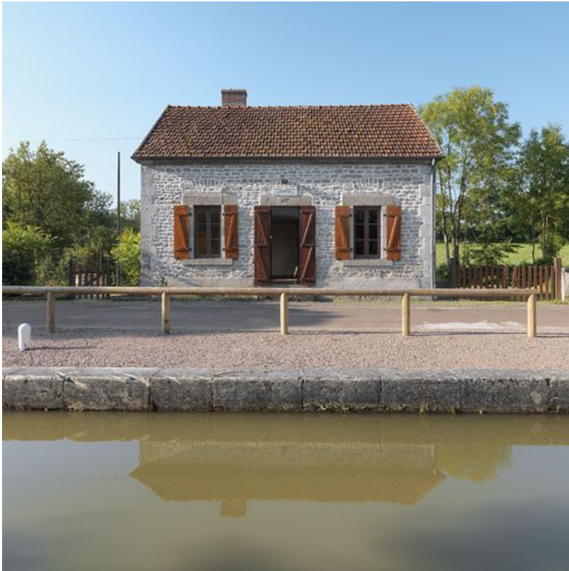
La maison éclusière : vue de face.

58, Brinay bief 22 du versant Loire, lieudit : bief 22 du versant Loire