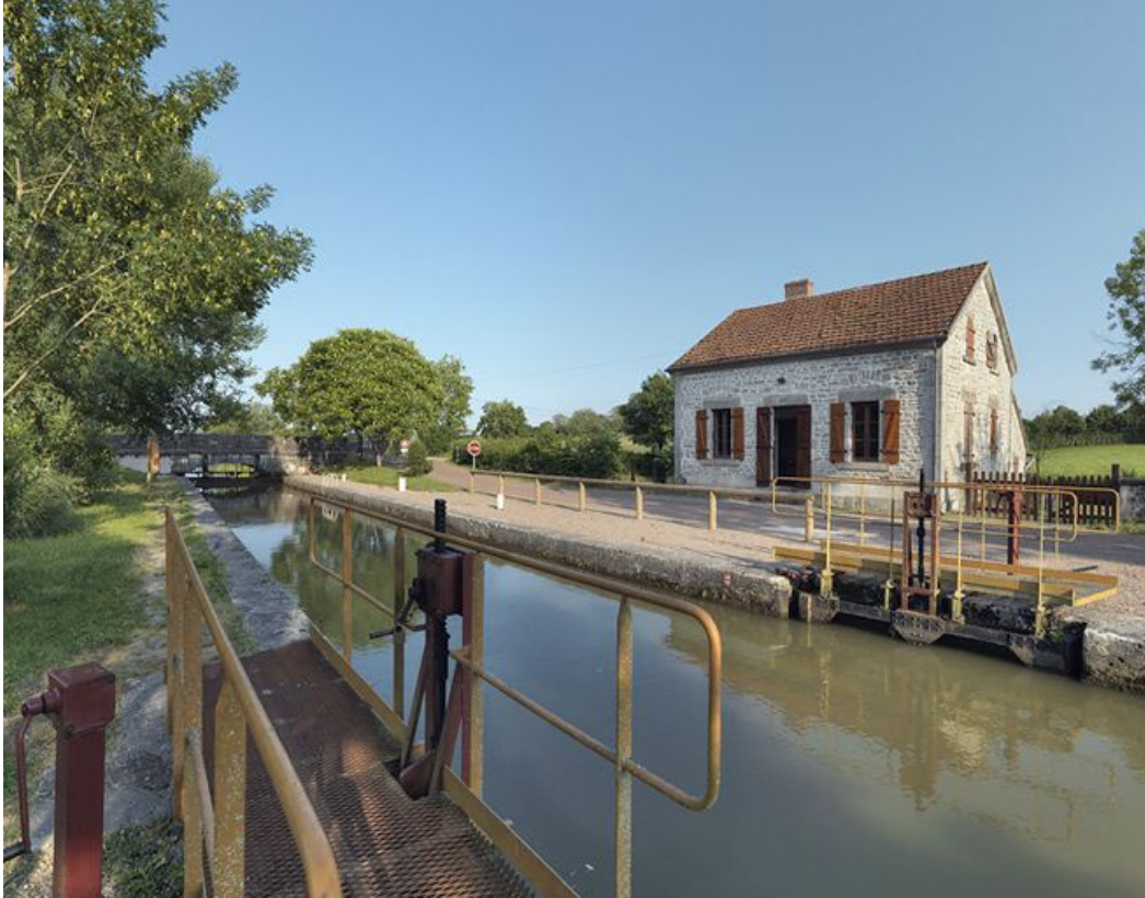
Le site d'écluse avec la maison éclusière, rive droite.

58, Brinay bief 22 du versant Loire, lieudit : bief 22 du versant Loire