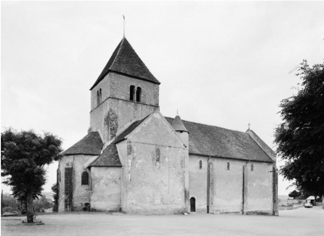
Elévation latérale gauche, vue prise du nord-est.