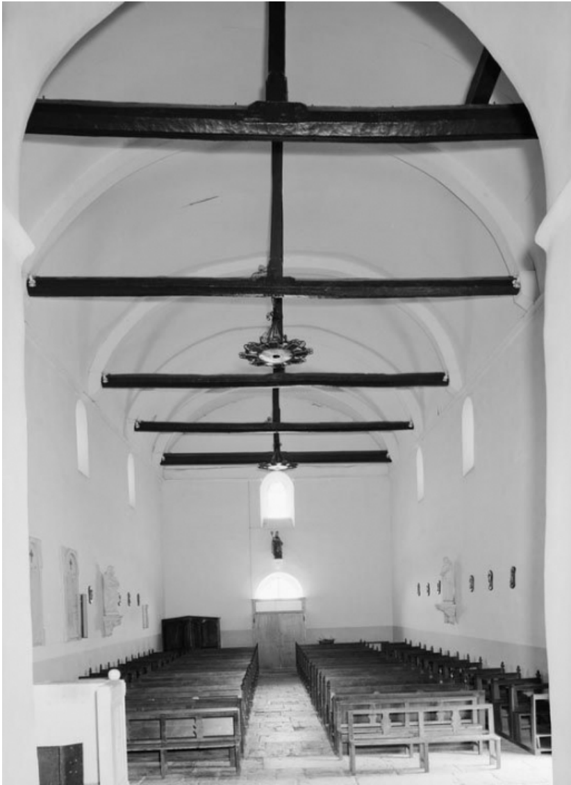
La nef, vue d'ensemble depuis la croisée du transept. 58, Cercy-la-Tour