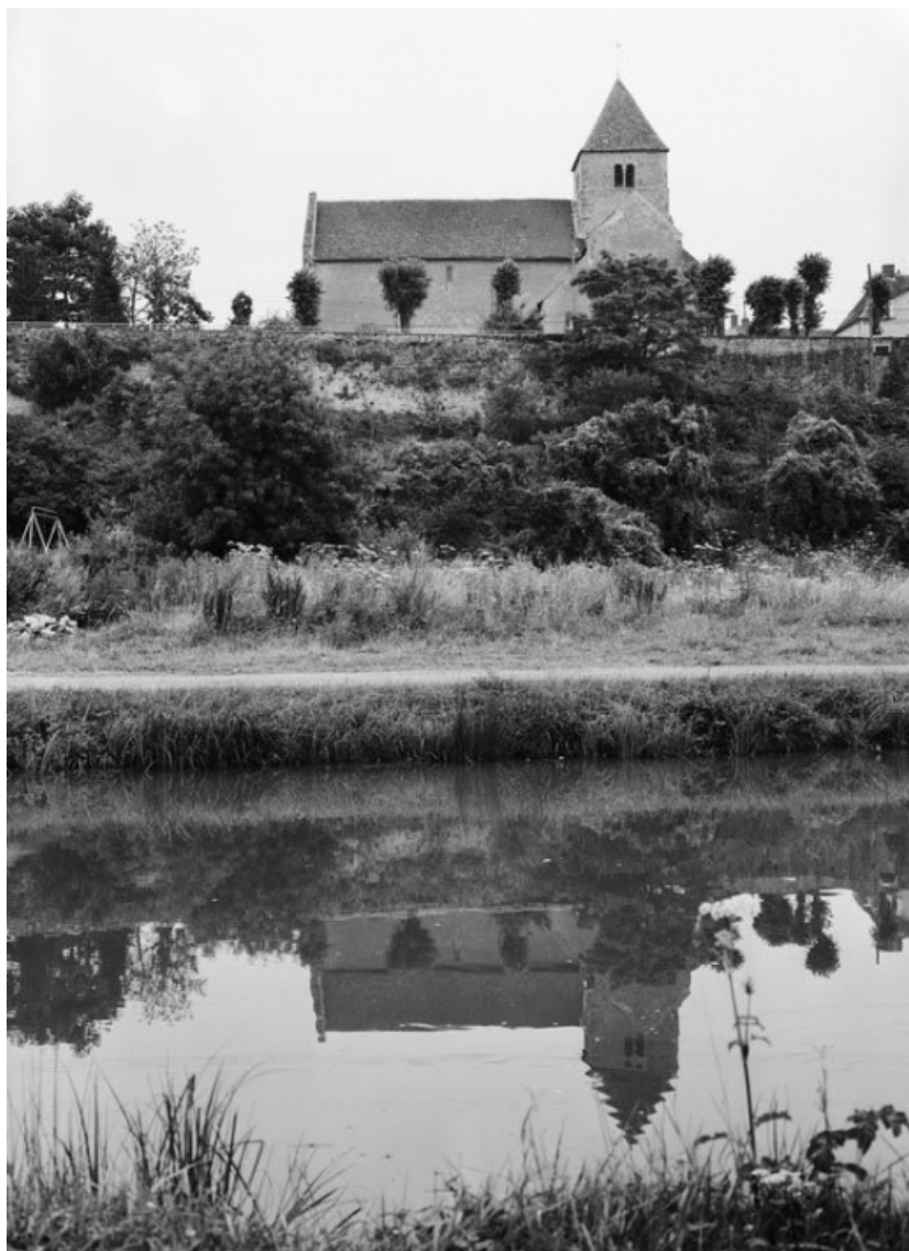
Vue d'ensemble depuis le canal.