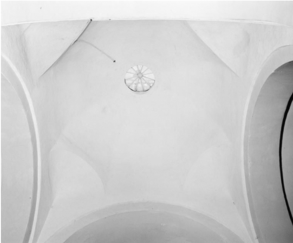
Détail de la voûte de la croisée du transept.