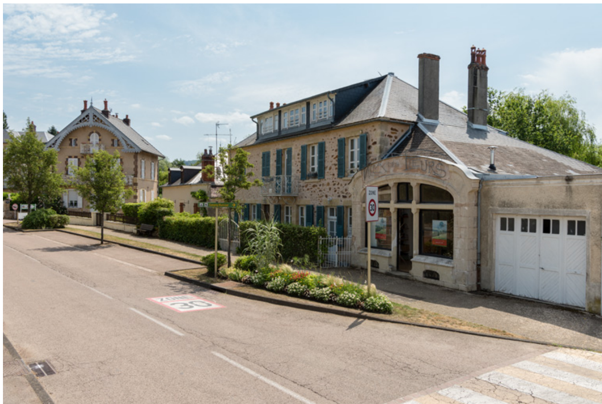
Façade actuelle sur la rue, vue de trois-quarts.

58, Saint-Honoré-les-Bains, 15-17 avenue Eugène Collin