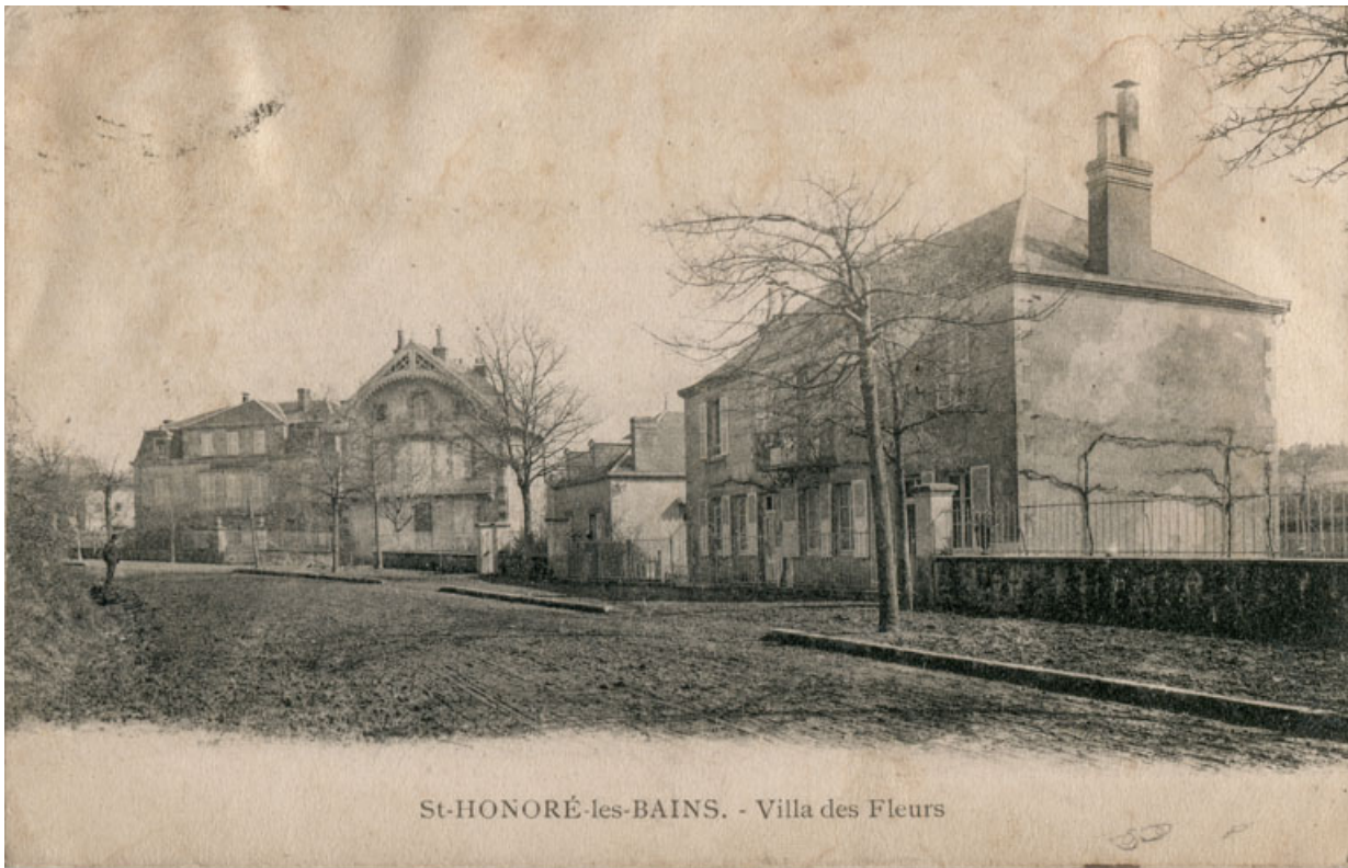
St-HONORÉ-les-BAINS. - Villa des Fleurs

Élévation depuis la rue avant la construction de la pharmacie.