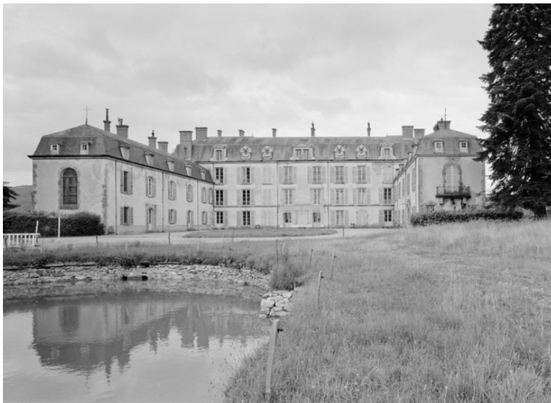
Façade sur la cour et le bassin, vue de trois-quarts prise en 1977.

58, Saint-Honoré-les-Bains, lieu-dit : écart de La Montagne