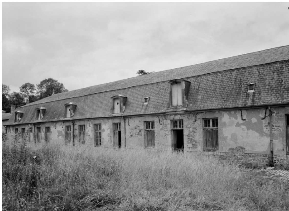
Bâtiment de l'ancienne écurie, vue depuis le sud prise en 1977.

58, Saint-Honoré-les-Bains, lieudit : écart de La Montagne