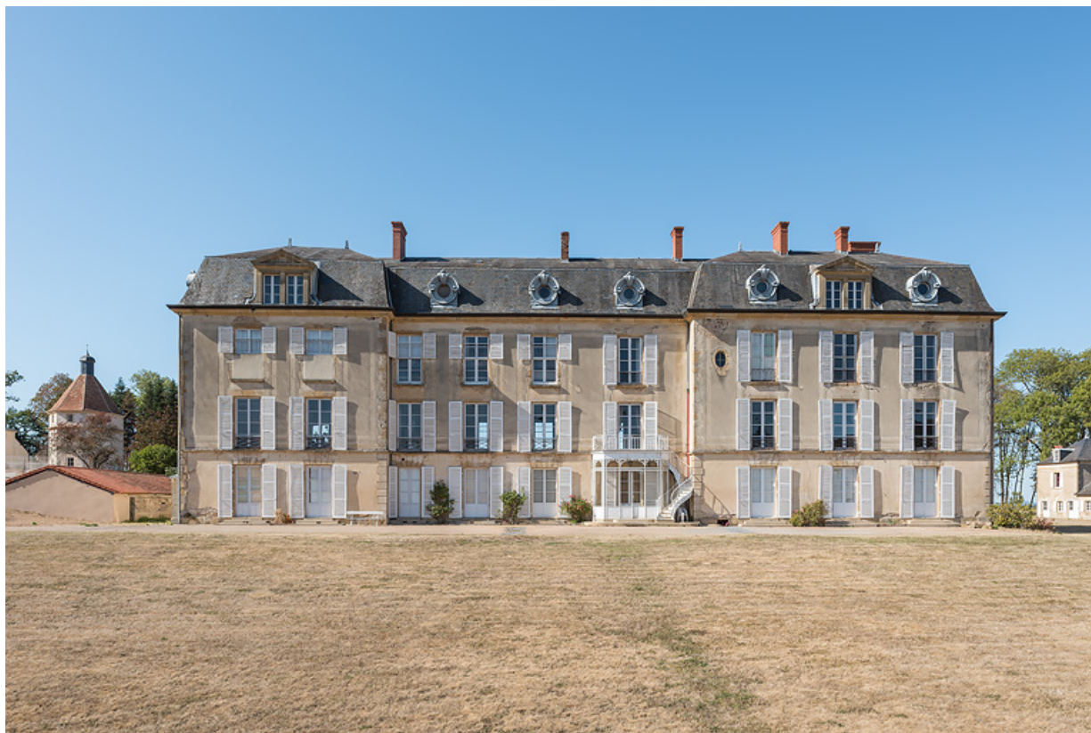
Façade sur le parc, vue de face.

58, Saint-Honoré-les-Bains, lieu-dit : écart de La Montagne