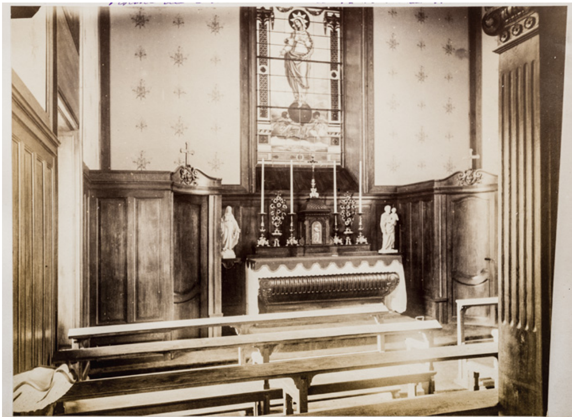
Vue intérieure de la chapelle en direction de l'autel en 1883.

58, Saint-Honoré-les-Bains, lieudit : écart de La Montagne