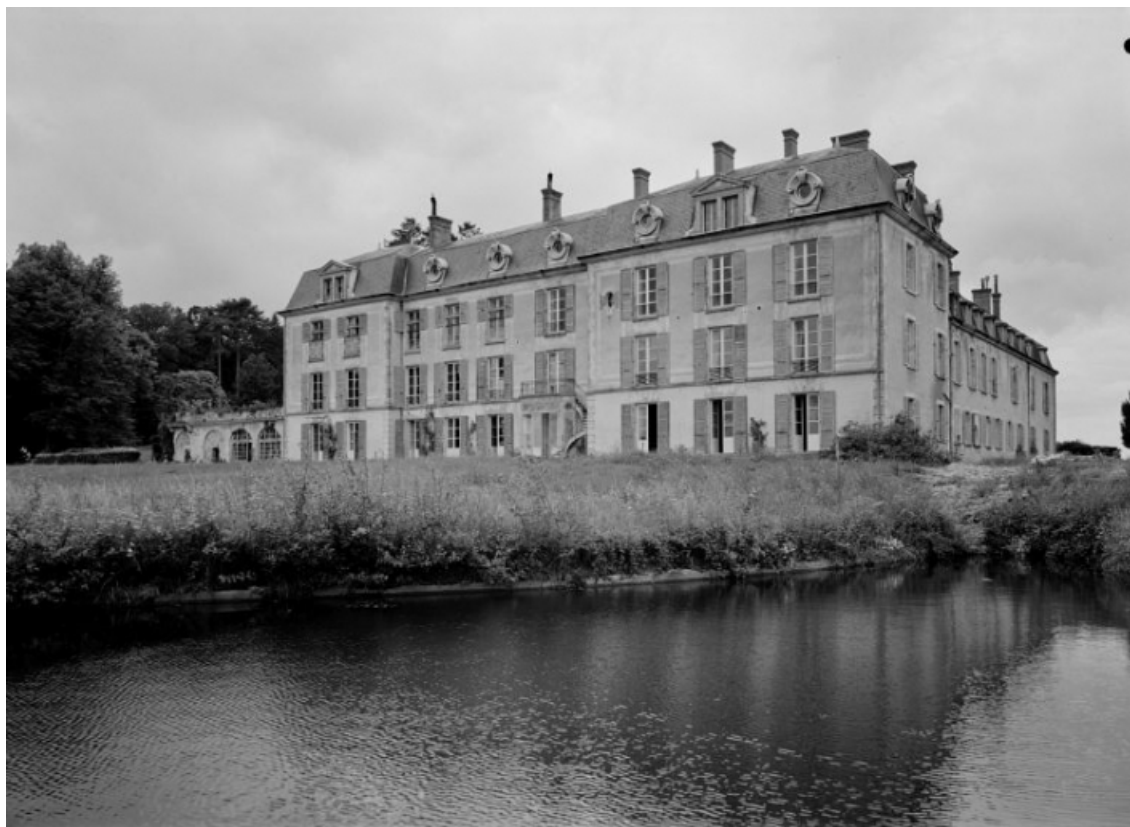
Façade sur le parc, vue de trois-quarts prise en 1977.

58, Saint-Honoré-les-Bains, lieudit : écart de La Montagne