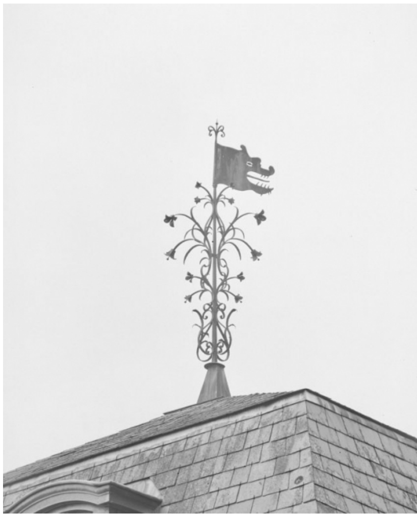
Girouette de l'aile droite, vue de trois-quarts prise en 1977.

58, Saint-Honoré-les-Bains, lieudit : écart de La Montagne