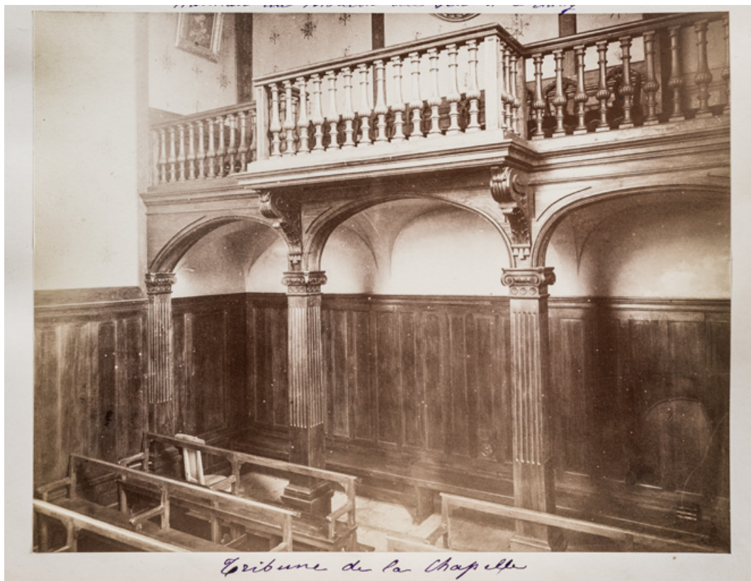
Vue intérieure de la chapelle en direction de la tribune en 1883.

58, Saint-Honoré-les-Bains, lieudit : écart de La Montagne