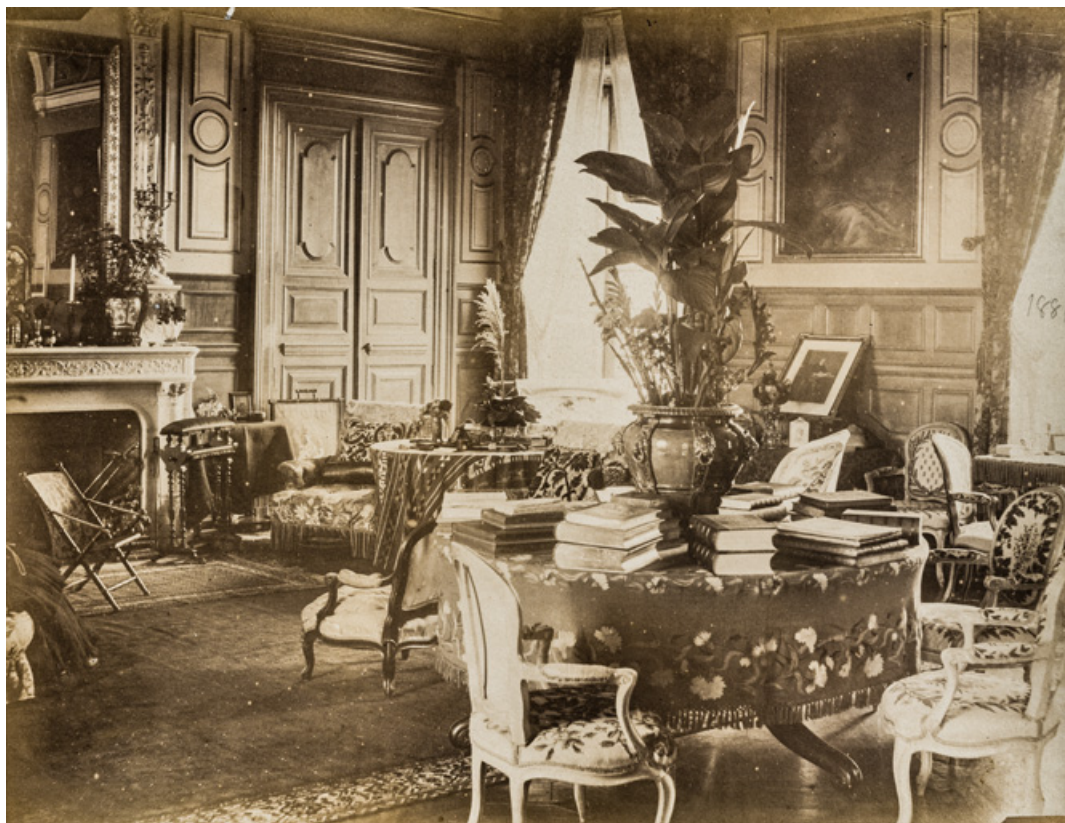
Vue intérieure du grand salon en 1881.

58, Saint-Honoré-les-Bains, lieudit : écart de La Montagne