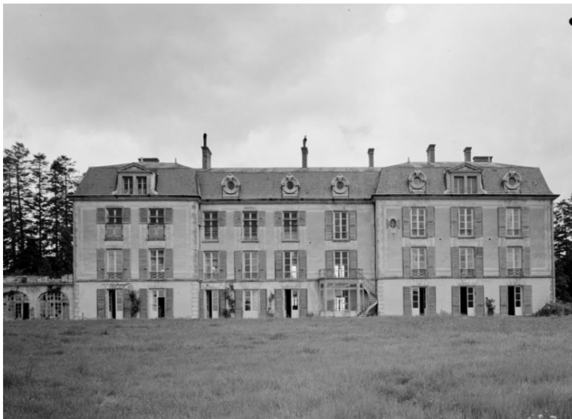
Façade sur le parc, vue de face prise en 1977.

58, Saint-Honoré-les-Bains, lieudit : écart de La Montagne