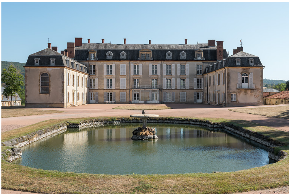
Façade sur la cour et le bassin, vue de face.

58, Saint-Honoré-les-Bains, lieu-dit : écart de La Montagne