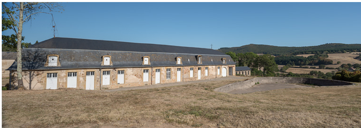
Bâtiment de l'ancienne écurie, vue depuis l'ouest.

58, Saint-Honoré-les-Bains, lieu-dit : écart de La Montagne