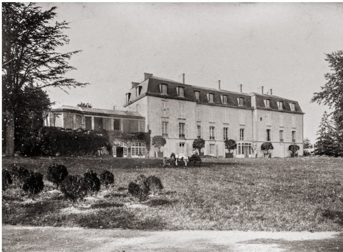
Façade sud-est du corps de logis.

58, Saint-Honoré-les-Bains, lieudit : écart de La Montagne