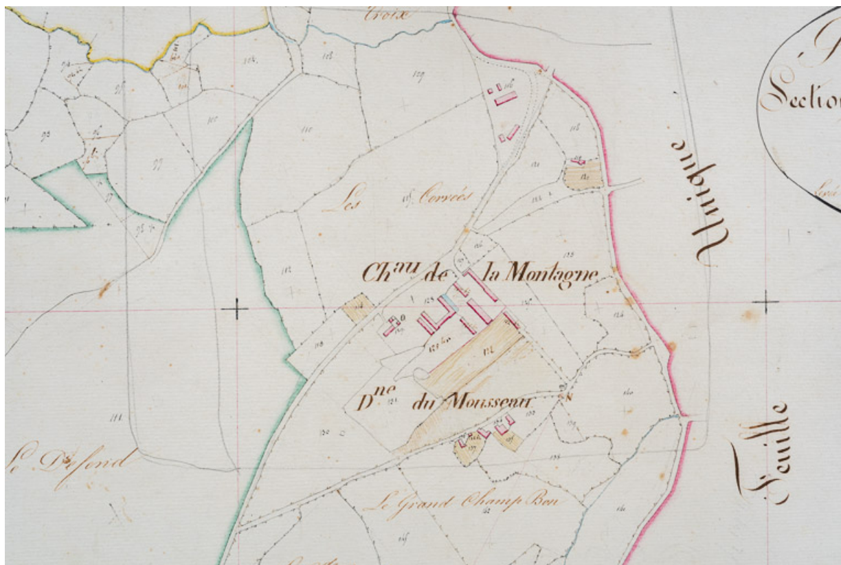
Situation du château et de ses dépendances dans le plan du cadastre ancien dit napoléonien (1832). 58, Saint-Honoré-les-Bains, lieudit : écart de La Montagne