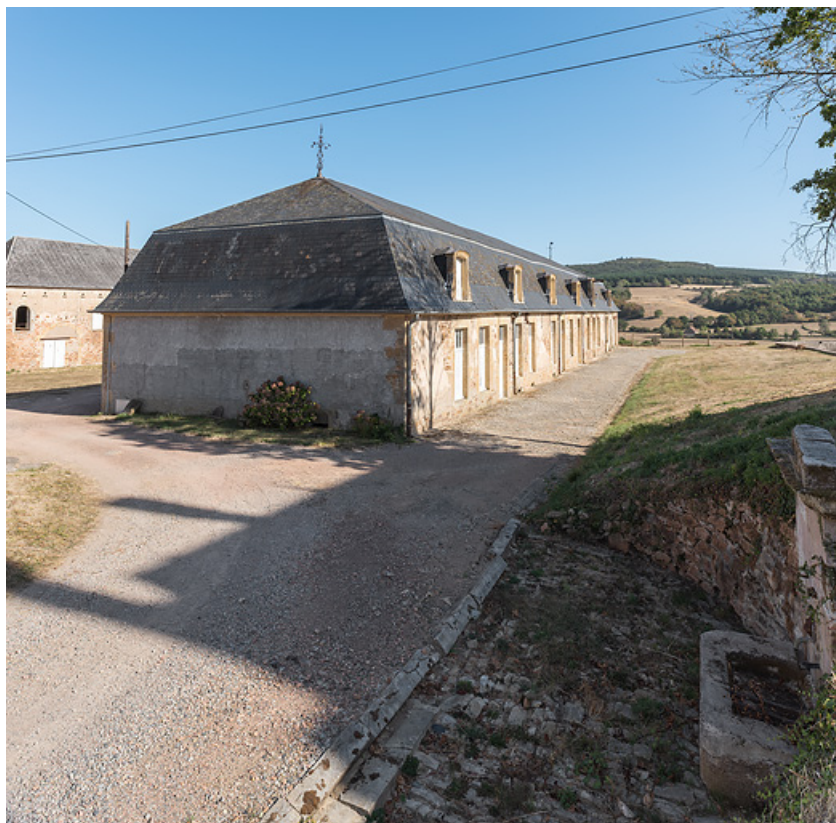
Bâtiment de l'ancienne écurie, vue depuis le nord-ouest.

58, Saint-Honoré-les-Bains, lieudit : écart de La Montagne