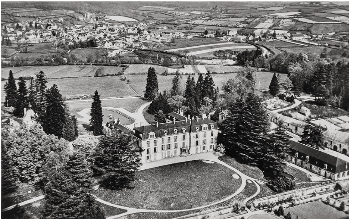
Vue aérienne du château et de ses dépendances.

58, Saint-Honoré-les-Bains, lieudit : écart de La Montagne