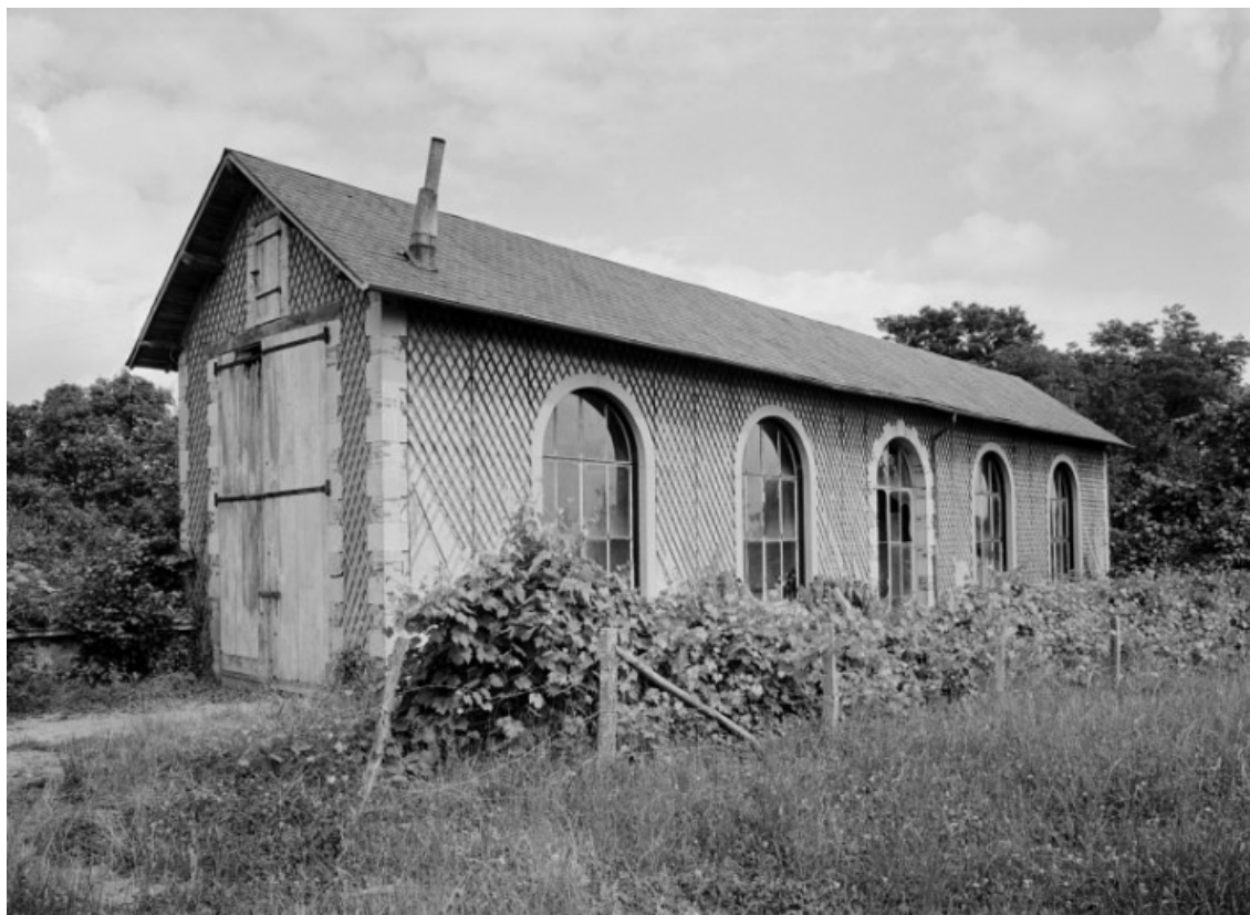
Orangerie, vue prise en 1977.

58, Saint-Honoré-les-Bains, lieudit : écart de La Montagne