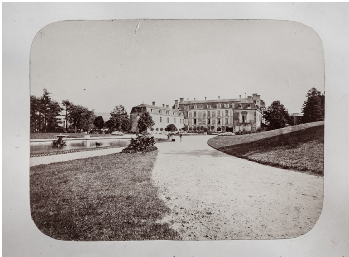
Vue d'ensemble depuis le nord-ouest en 1874.

58, Saint-Honoré-les-Bains, lieudit : écart de La Montagne