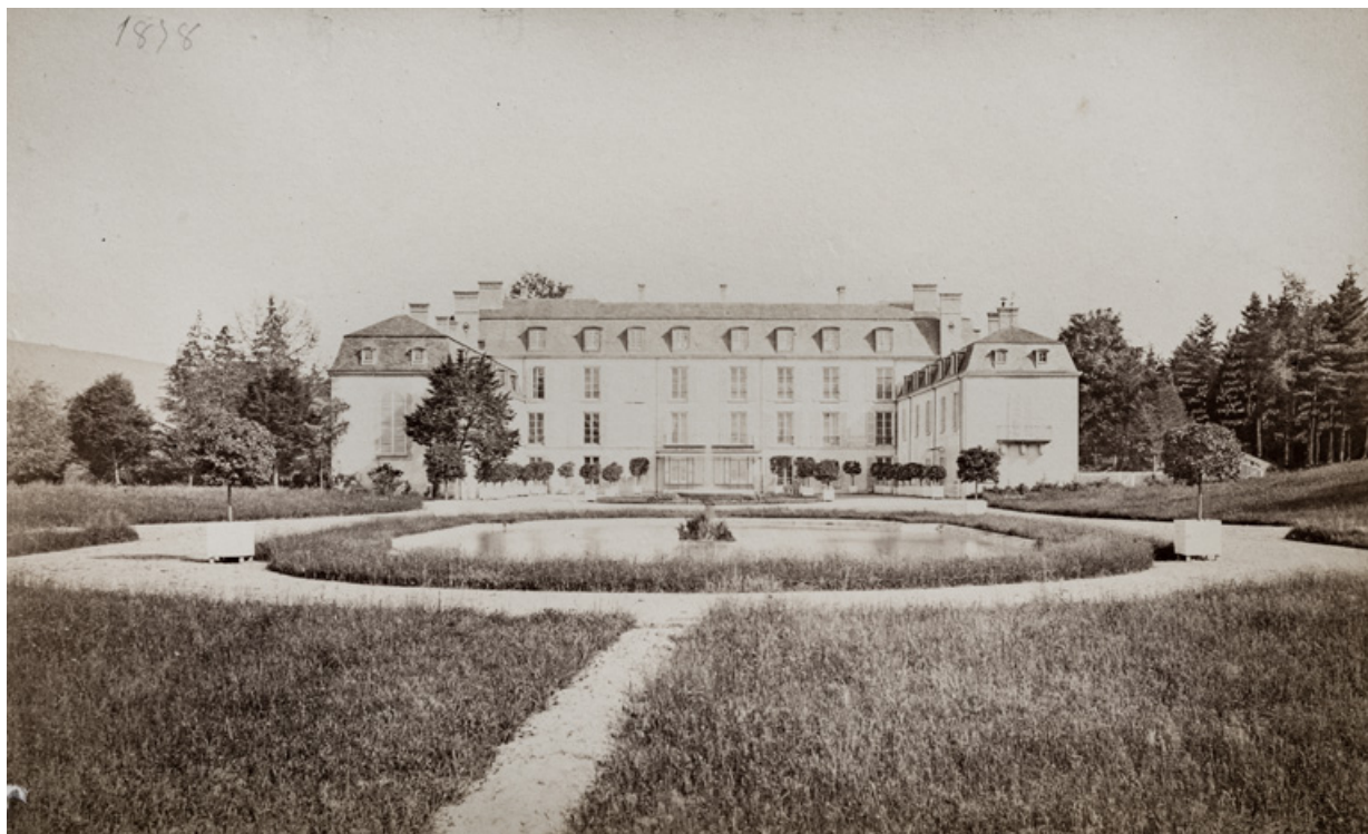
Vue d'ensemble depuis le nord-ouest en 1878.

58, Saint-Honoré-les-Bains, lieudit : écart de La Montagne