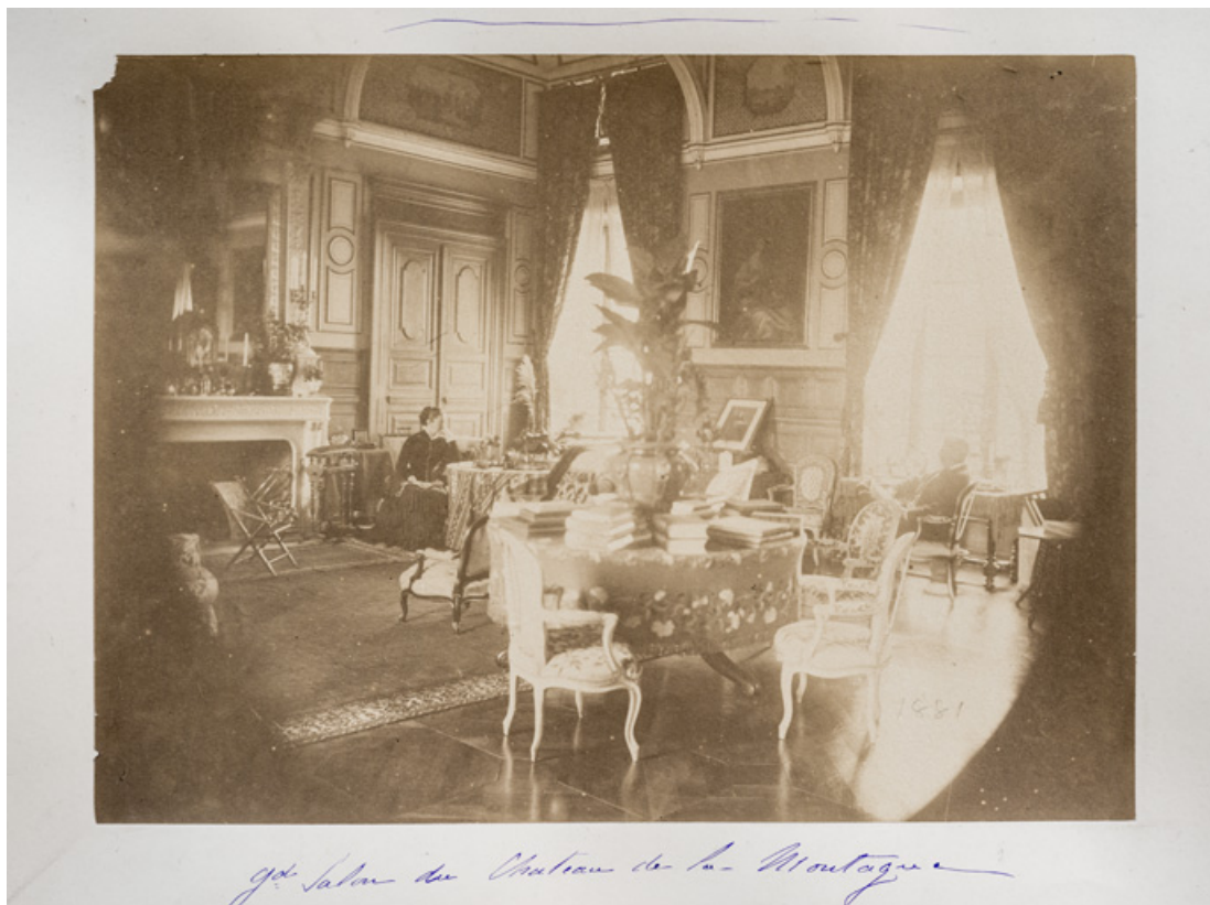
Vue intérieure du grand salon en 1881.

58, Saint-Honoré-les-Bains, lieudit : écart de La Montagne