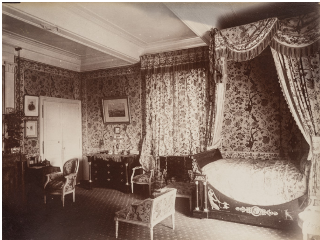
Vue intérieure d'une chambre à coucher à la fin du 19e siècle.

58, Saint-Honoré-les-Bains, lieudit : écart de La Montagne