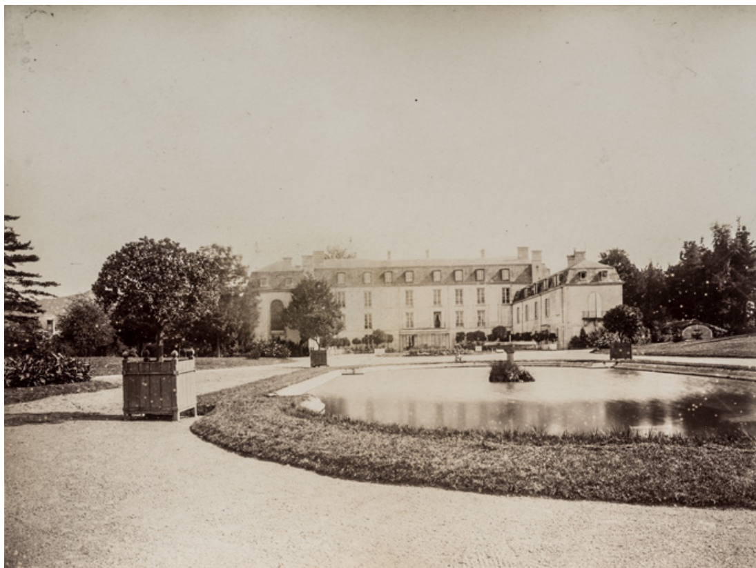
Bassin et vue sur la cour.

58, Saint-Honoré-les-Bains, lieudit : écart de La Montagne