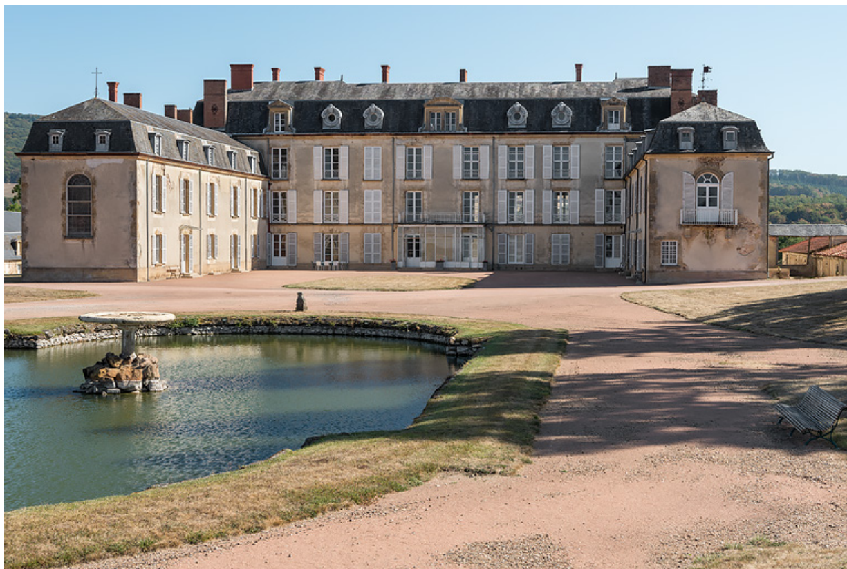
Façade sur la cour et le bassin, vue de trois-quarts.

58, Saint-Honoré-les-Bains, lieudit : écart de La Montagne