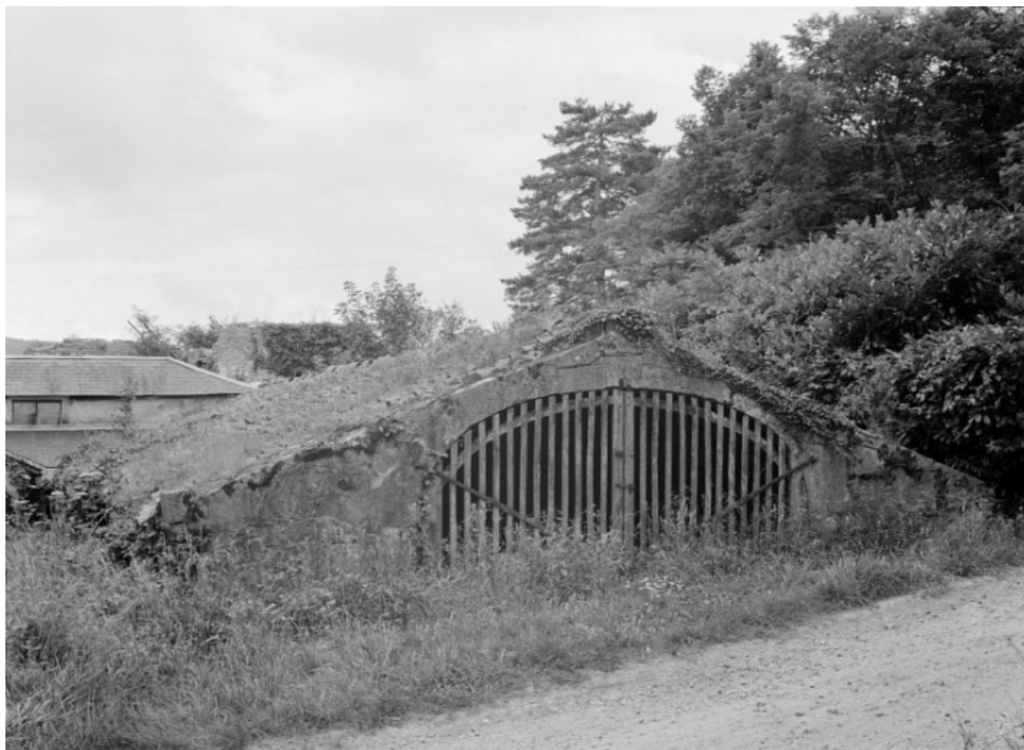
Cellier, vue prise en 1977.

58, Saint-Honoré-les-Bains, lieudit : écart de La Montagne