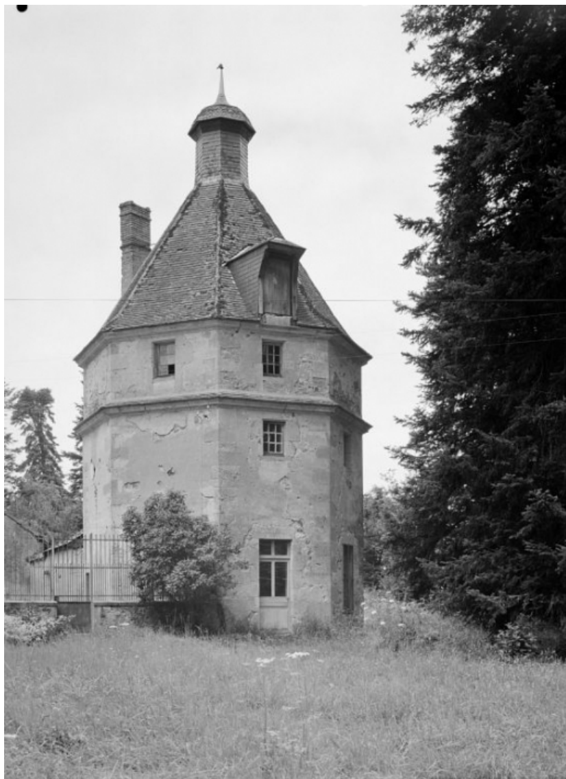
Colombier, vue prise en 1977.

58, Saint-Honoré-les-Bains, lieudit : écart de La Montagne