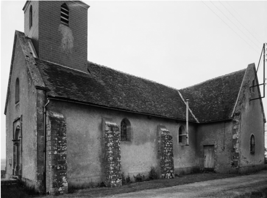
Elévation latérale gauche.