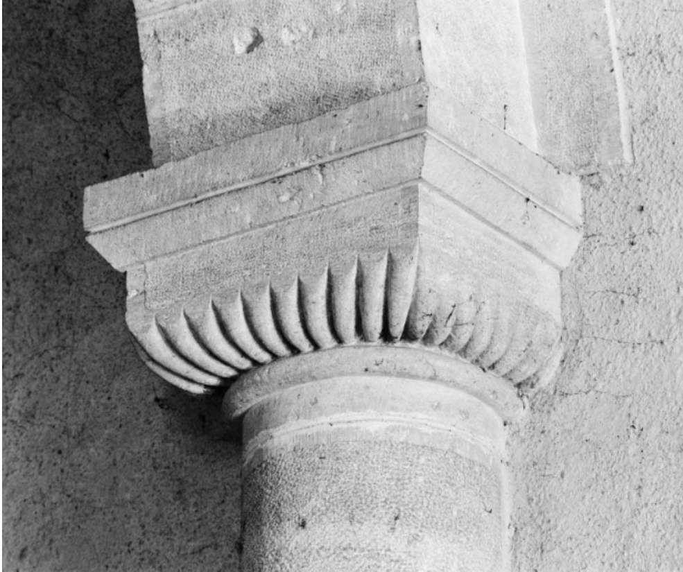
Détail du chapiteau de la deuxième colonne de droite de la nef. 58, Isenay