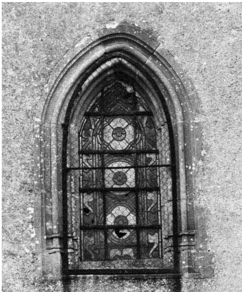
Détail de la deuxième baie de la chapelle droite, face droite.