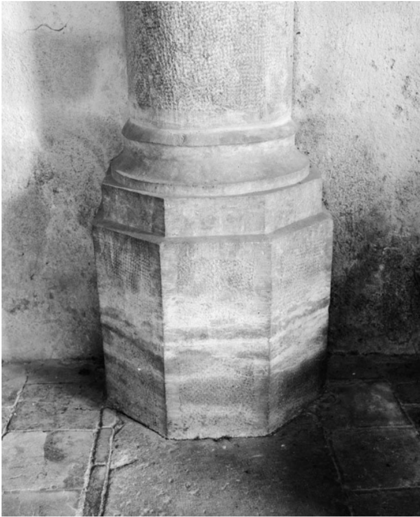
Base de la colonne antérieure droite de la nef.