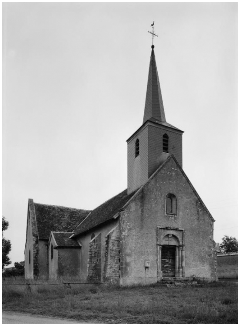
Vue d'ensemble, de trois-quarts.