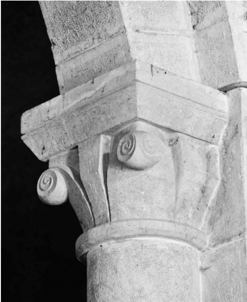
Détail du chapiteau de la troisième colonne de droite de la nef. 58, Isenay